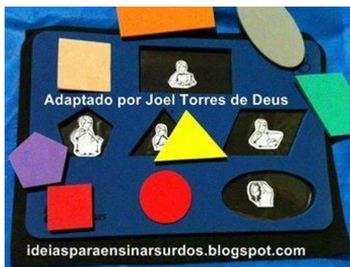
Figura 3 - Atividade lúdica para alunos surdos