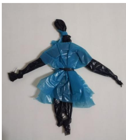
Fig. 02 – Abayomi de Plástico

Sendo assim, entregar a monitoria nas mãos dos meninos foi de alguma forma, um gesto de proporcionar-lhes esse momento de alívio e satisfação defendido por Costa (2005). Para cada turno, indicamos 2 alunos para serem os monitores, que apresentariam as peças realizadas não só por eles, mas tudo produzido pela coletividade. Além do trabalho dos meninos exalar delicadeza e beleza, a forma a qual eles conduziram a mostra foi impactante. Suas histórias se misturavam a suas apresentações. Todo o corpo docente, todo o quadro de funcionários do sócio educativo visitou a exposição. Foi mesmo impactante o resultado do trabalho daqueles meninos.