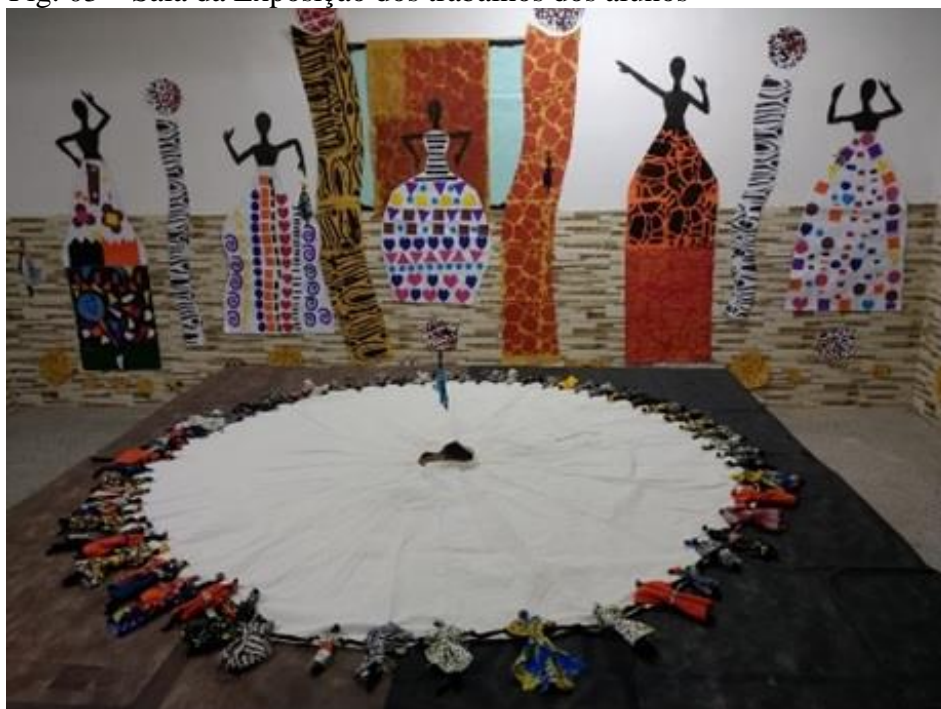
Fig. 03 – Sala da Exposição dos trabalhos dos alunos

Essa boneca, diferente das outras, não foi feita com tecidos. Foi feita com o material disponível naquele espaço, no caso, pedaços de plásticos de saco de lixo, único material que ele achou disponível em momentos posteriores a aula (fig.2). Dentro das alas, não são permitidos materiais que a instituição desconheça, ele então decidiu inovar ao fazer sua Abayomi. Ele me contou como foi o seu trajeto logo que saiu da sala de aula, após a confecção das bonecas para a exposição. Durante o percurso realizado com os agentes, ele foi ao longo de todo o trajeto pensando nas amarrações vivenciadas horas antes do seu retorno para os alojamentos. E, sentindo o desejo de prolongar o que havia experimentado horas antes, foi inspirado a rasgar pedaços de sacos de plásticos dos cestos de lixos que via durante o trajeto. Viu que através desse ato uma forma de dar continuidade ao fazer artístico, de sentir-se útil, amado, liberto.