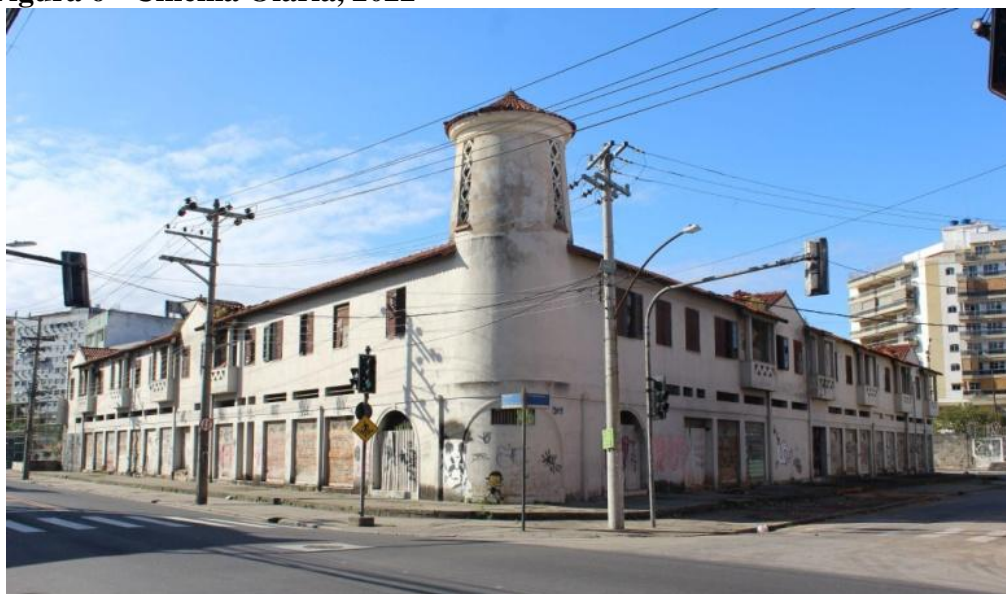
Figura 6 - Cinema Olaria, 2022

Em 2012, o cinema Olaria foi incluído, junto com outros quatro cinemas da Zona Norte, na promessa de revitalização de suas salas. A iniciativa foi feita pela Prefeitura do Rio de Janeiro e, na época, o levantamento feito pela RioFilme em conjunto com a Subsecretaria de Patrimônio Cultural escolheu cinco imóveis para receber o investimento, mas ele nunca saiu do papel. Em 2016, foi anunciado que o Cinema passaria por uma “modernização” elaborada pelo Grupo Severiano Ribeiro, que administra o imóvel. Houve uma flexibilização do tombamento para que realizassem as obras que contava com uma filial de uma linha de academias e apartamentos residenciais, a obra chegou a começar, mas foi abandonada.