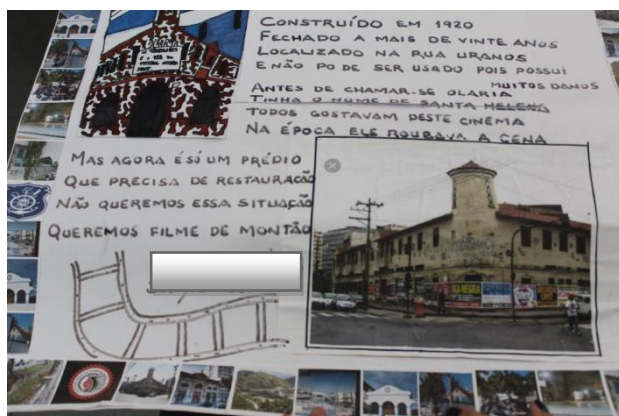
Trabalho sobre a importância e o resgate da história sobre o cinema Olaria. Importante notar o texto mencionando o abandono do prédio e o desejo pela volta do Cinema.