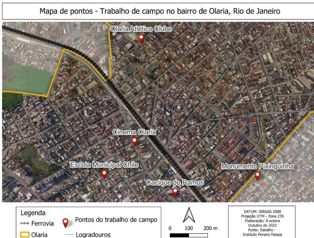
Figura 3 - Mapa de localização de pontos do trabalho de campo