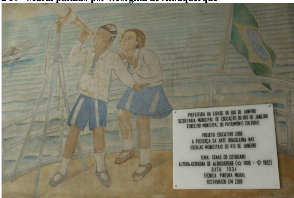
Figura 10 - Mural pintado por Georgina de Albuquerque

Em outubro de 1997 a Folha de São Paulo 2 noticiou que a Associação de Pais e Alunos da escola, através de um aviso de uma funcionária, havia descoberto as obras que tiveram sua autenticidade confirmada a partir de uma análise técnica. As obras haviam sido descobertas anos antes, nos anos de 1970, mas tiveram que ser escondidas novamente por falta de apoio financeiro para sua restauração. A partir disso a Secretaria de Educação iniciou uma campanha para conseguir apoio para a restauração das obras. Os murais foram tombados a partir da Lei Municipal número 3009 de 18 de janeiro de 2000 reconhecendo seu valor cultural, histórico e artístico.