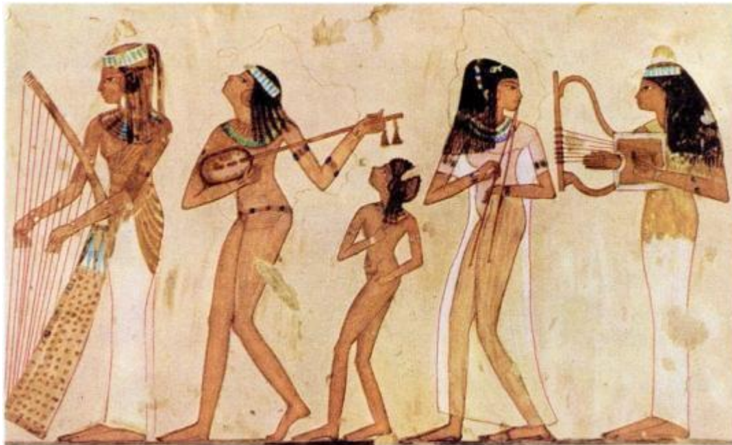
Imagem 1 – Povo egípcio fazendo uso de instrumentos musicais

Vale destacar que os egípcios, por volta de 4.000 a.C., já utilizavam, em rituais religiosos e celebrações, instrumentos como harpas, flautas e duplos clarinetes.