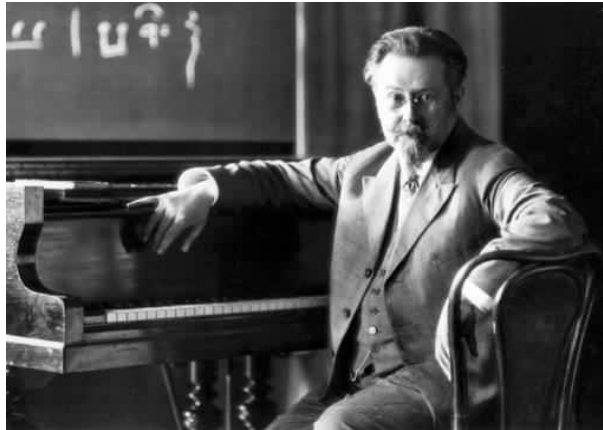
Imagem 2- Foto de Émile Jaques Dalcroze