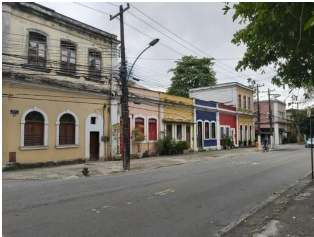
Figura 2 – Rua Pacheco Leão, local onde ficava a Fábrica de Tecidos Carioca