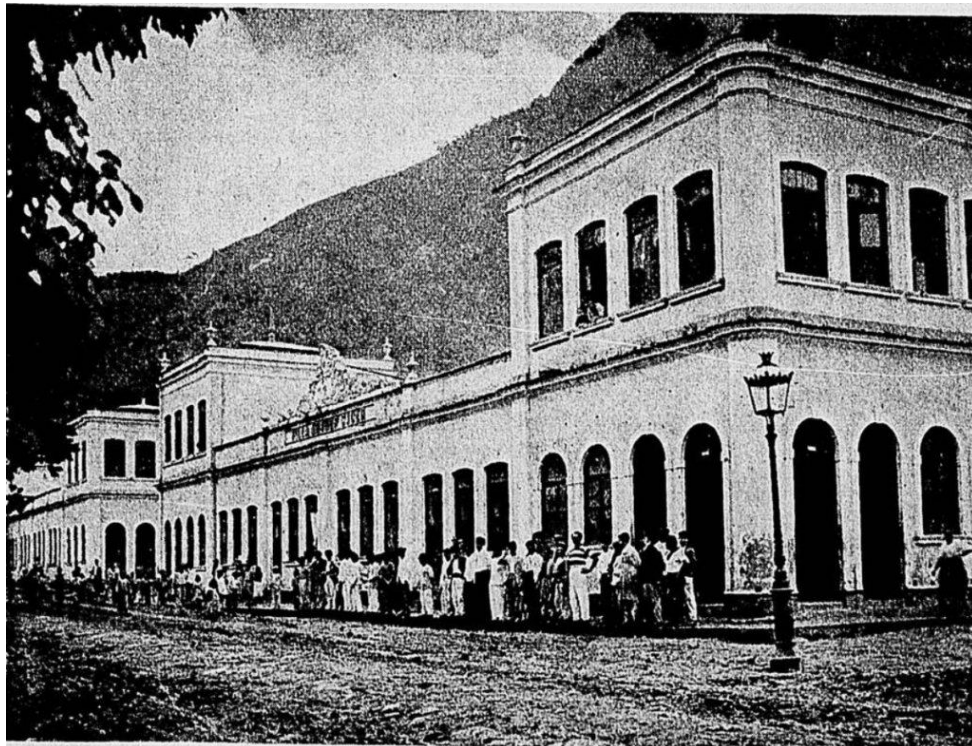
Figura 6 – Funcionários em frente à Vila Arthur Sauer. Revista da Semana, 10 de março de 1901.