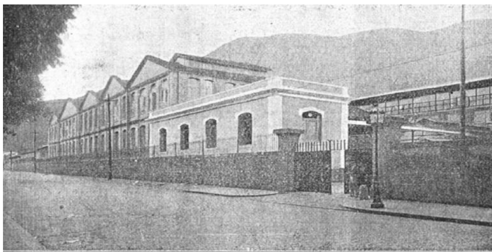
ENTRADA DA FABRICA CARIOCA