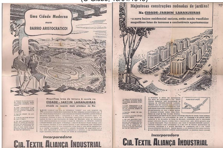
Figura 4 – Anúncio publicitário do empreendimento imobiliário que foi edificado no local da Fábrica de Tecidos Aliança, após sua demolição (O Globo, 15/01/1945)