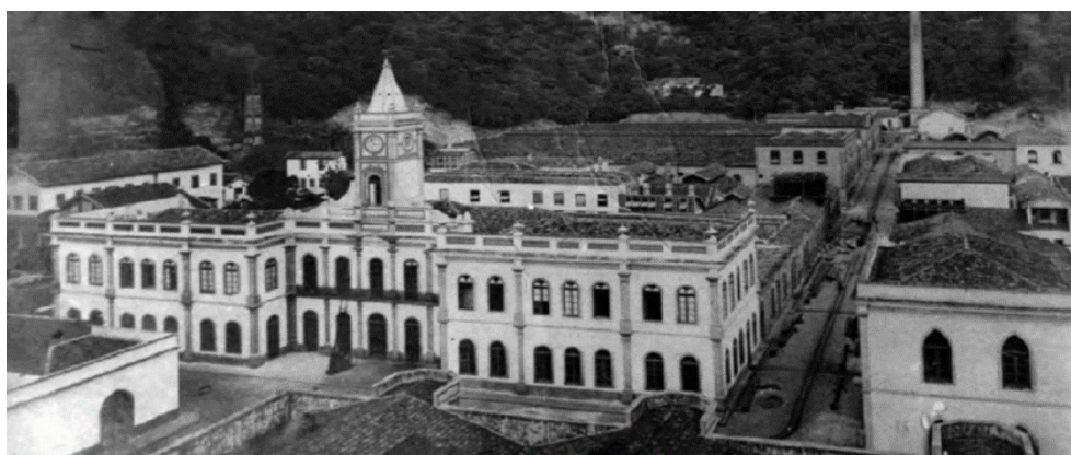
Figura 3 – Vista aérea da fábrica de tecidos Aliança