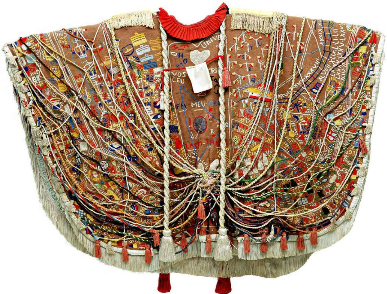
IMAGEM 4: Arthur Bispo do Rosário, Manto da Apresentação (título atribuído), bordado, costura e escrita 1 .

As práticas de apropriação e assemblage rompem com a noção tradicional de escultura e pintura, utilizando o cotidiano como matéria-prima para a criação. Elas desafiam os limites entre arte e não-arte, promovendo uma reflexão crítica sobre consumo, valor, memória, dentre outras coisas. Essas práticas encontram uma expressão singular na obra de Arthur Bispo do Rosário (1909-1989) que elaborou uma produção marcada pela composição com objetos cotidianos como fios, tecidos, utensílios e pedaços de roupas. Sua obra Manto da Apresentação (IMAGEM 4) é um exemplo emblemático de assemblage , onde elementos aparentemente banais são transformados em arte sacralizada, evocando um universo simbólico próprio, espiritual e memorialista. Nesse processo, Bispo reafirma a potência criativa do reaproveitamento, transformando resíduos em testemunhos de existência.