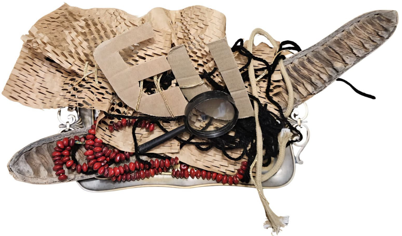
IMAGEM 12: Paula Onofre. Eu, de Bandeja. Fotografia, 2025.

E assim, no gesto de colar, amarrar, pintar e esculpir, aquilo que um dia foi rejeitado se torna linguagem. A criação nasce do resíduo, a beleza emerge daquilo que foi negado.