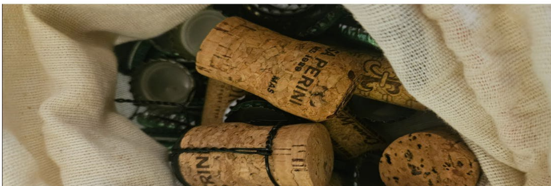
IMAGEM 2: Paula Onofre. Tudo isso é Material . Fotografia, 2025