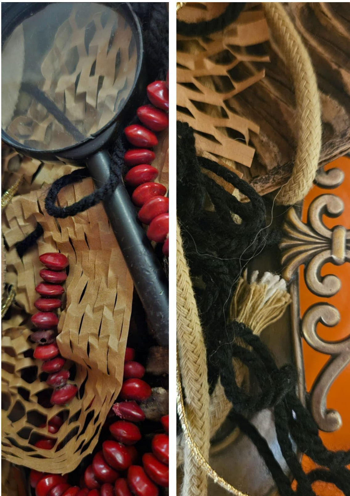
IMAGEM 3: Paula Onofre. Fragmentos . Fotografia, 2025