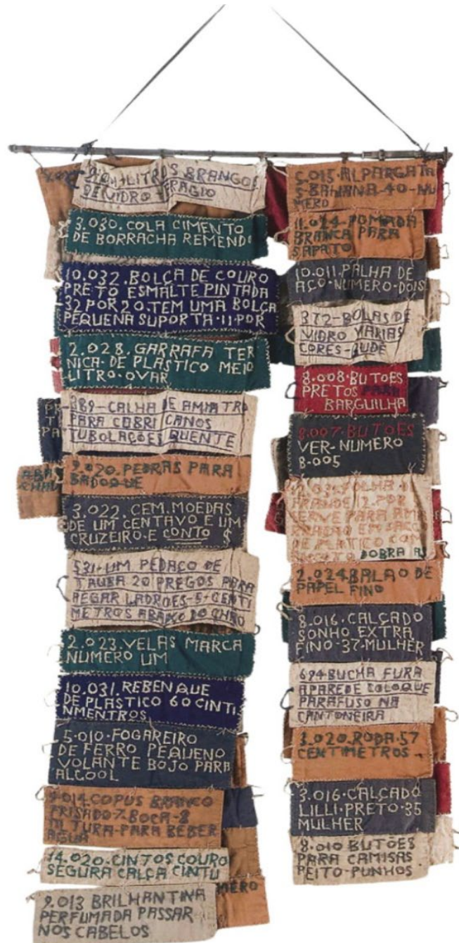
IMAGEM 13 Arthur Bispo do Rosário, costura e escrita 3 .

um convite para se olhar bem de perto, quase que por dentro, com ajuda de uma lupa de brinquedo, daquelas que foram muitas vezes ao chão de terra durante o brincar de uma criança querendo descobrir as “pequenezes” do seu mundo, e que está nesse trabalho para que, ao olhar-se através dela, se veja, se encontre, perceba e sinta todas as formas, jeitos e texturas de ser e estar nesse mundo.