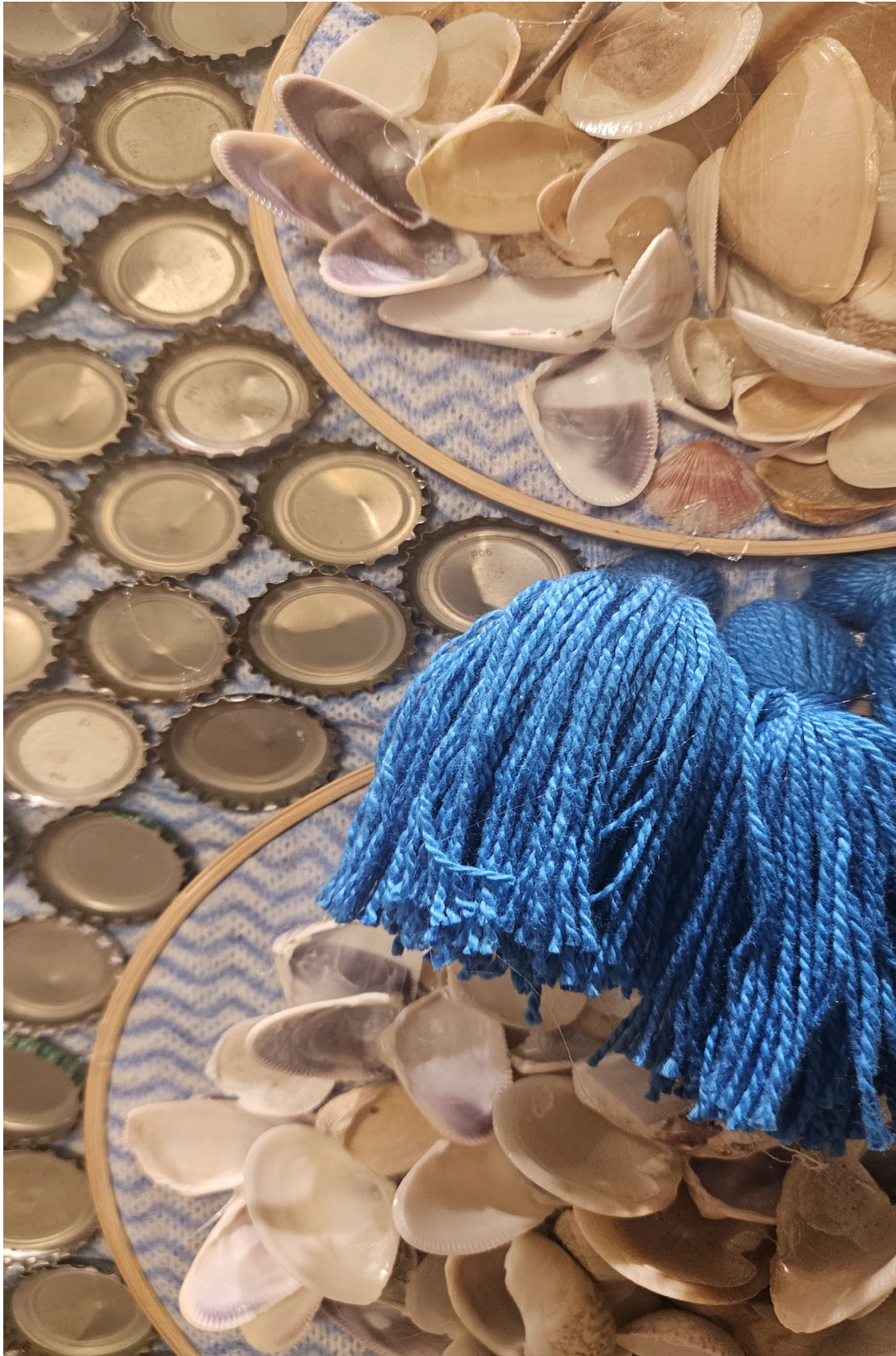
IMAGEM 5: Paula Onofre. Perfex ao Mar. Detalhe . Fotografia, 2025