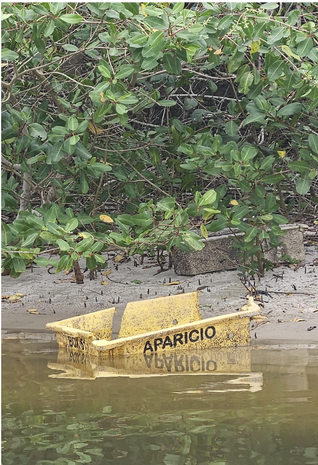
IMAGEM 1: Paula Onofre. Aparicio . Fotografia, 2025

Um amontoado de lixo? Uma velha caixa boiando na Lagoa de Itaipu? Um universo à espera de um olhar atento?