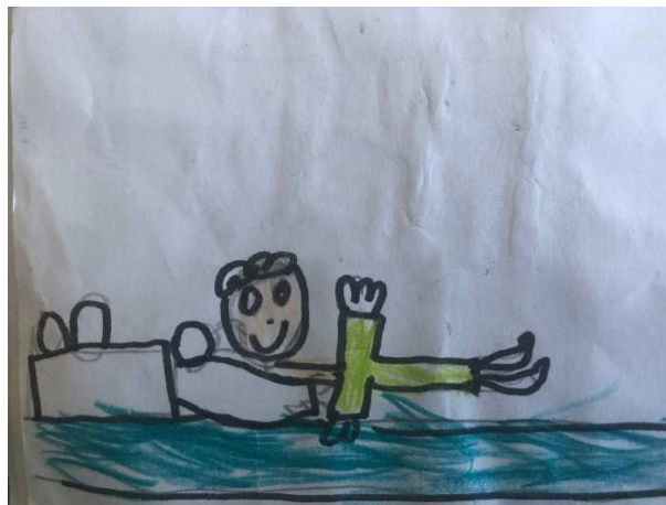
Figura 10 - Desenho feito pelas crianças sobre Paz