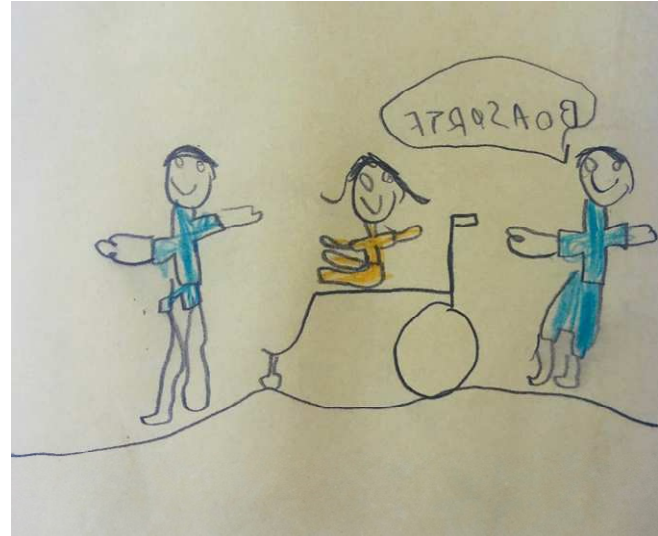
Fonte: Elaborado por alunos do segundo ano da Escola Sá Pereira.