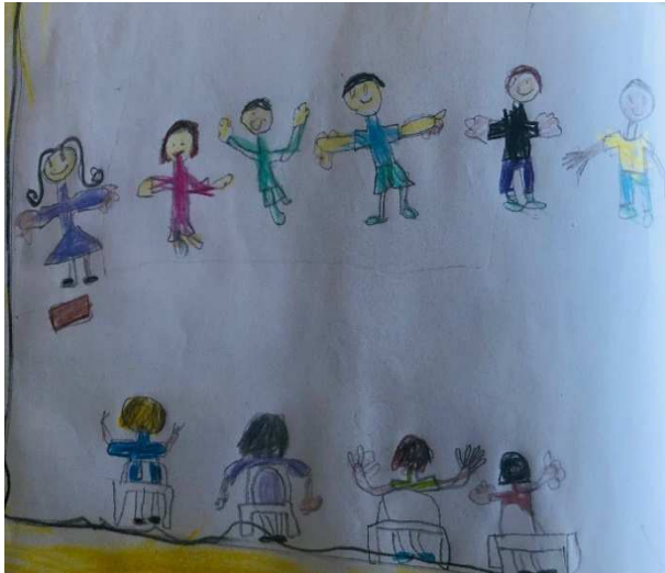
Figura 15 - Toda criança tem direito de estudar