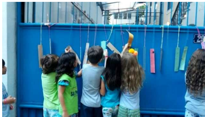
Figura 2 - Semana da Poesia. Crianças do Segundo Ano colocando poesias no portão para serem lidas pelos pedestres.

materialmente e simbolicamente nas artes é uma forma necessária de conhecimento de si e do outro. Nesse sentido, convém destacar o pensamento de Morin sobre a importância dos valores estéticos da Arte: “As artes levam-nos à dimensão estética da existência e – conforme o adágio que diz que a natureza imita a obra de arte – elas nos ensinam a ver o mundo esteticamente.” (MORIN, 2000, p. 45).