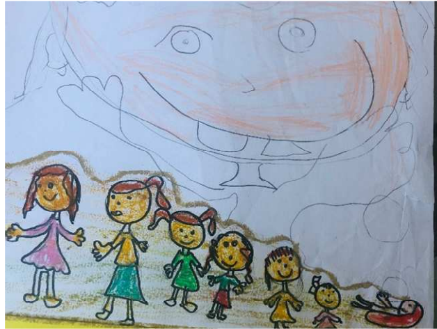
Figura 23 - Toda criança tem direito de crescer sem medo