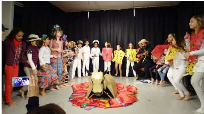
Figura 1- Representação da peça “Cavalo Marinho”.

A literatura, em especial a infantil, tem uma tarefa fundamental a cumprir nesta sociedade em transformação: a de servir como agente de formação. O livro é o passaporte fundamental para que a criança e o jovem apreciem a escrita do mundo. A literatura constitui para a criança uma forma eficaz de ler o mundo, rica e repleta de imaginação.