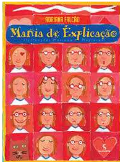
Figura 8- Capa do livro “Mania de Explicação” Falcão (2001)

Neste momento, outro livro que nos provocou foi Mania de Explicação (2001), de Adriana Falcão. Esse livro traz conceitos de palavras como Solidão, Saudade, Lembrança, Alegria, Felicidade, entre outras, com definições infantis. Aproveitamos para definir palavras que vinham fazendo parte do nosso vocabulário nas últimas conversas.