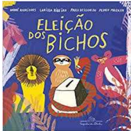
Figura 6 - Capa do livro “A Eleição dos Bichos” Rodrigues, Ribeiro, Desgualdo e Markun (2018)

O livro “A Eleição dos Bichos” de Rodrigues; Ribeiro; Desgualdo & Markun (2018), foi apresentado na roda com todas as suas informações: autores, ilustradores e editora.