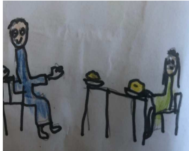
Figura 16 - Toda criança tem direito de ter comida na mesa