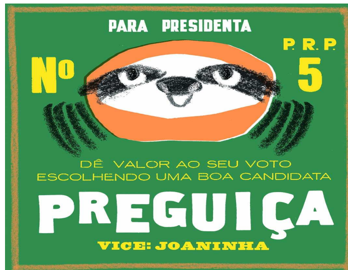
Figura 7 - Cartaz de propaganda políticas do livro “A Eleição dos Bichos”

comparação instantânea com um processo eleitoral convencional, com disputas, manipulações e projetos de governo.