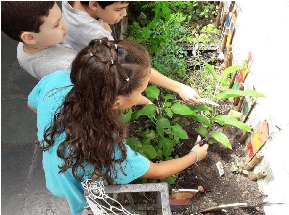
Figura 5 - Início do trabalho de construção da hortinha e o dia da colheita.