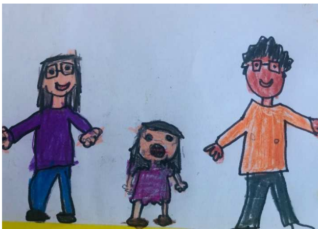
Figura 17 - Toda criança tem direito de ter uma família