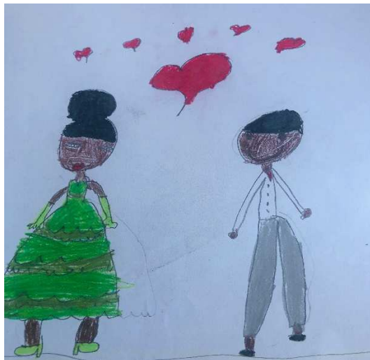
Figura 14 - Desenho feito pelas crianças sobre Amor