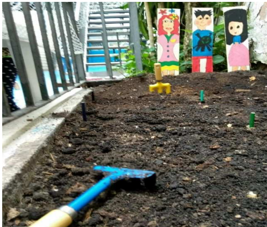
Figura 4 - Início do trabalho de construção da hortinha e o dia da colheita.

Envolvidos pelo desejo de uma auxiliar da escola que é bióloga e gosta das plantas, aprendemos a plantar e a cuidar de um pequeno canteiro do pátio. Vendo que é preciso regar todos os dias, cuidar da terra e contar com a ajuda do sol. Esse foi o produto dessa história. Regado de cuidados, exercitamos o aprendido nas atitudes diárias. É preciso cuidar do mundo, das plantas, do outro. E foi assim, cuidando e conversando que nossa ideia floresceu!