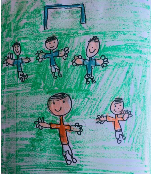
Fonte: Elaborado por alunos do segundo ano da Escola Sá Pereira.