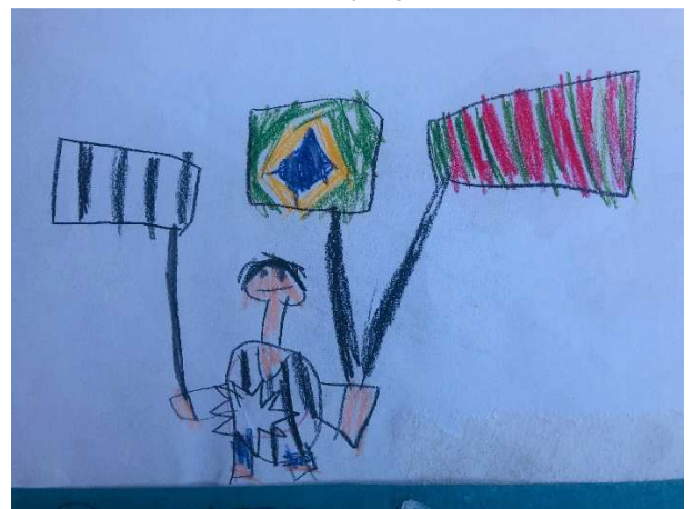
Figura 18 - Toda criança pode escolher o seu time de futebol e tem o dever de respeitar quem gosta de outro time

Fonte: Elaborado por alunos do segundo ano da Escola Sá Pereira.