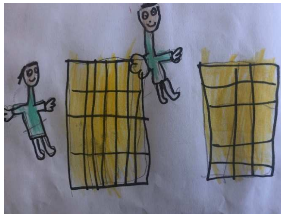
Figura 12 - Desenho feito pelas crianças sobre Liberdade