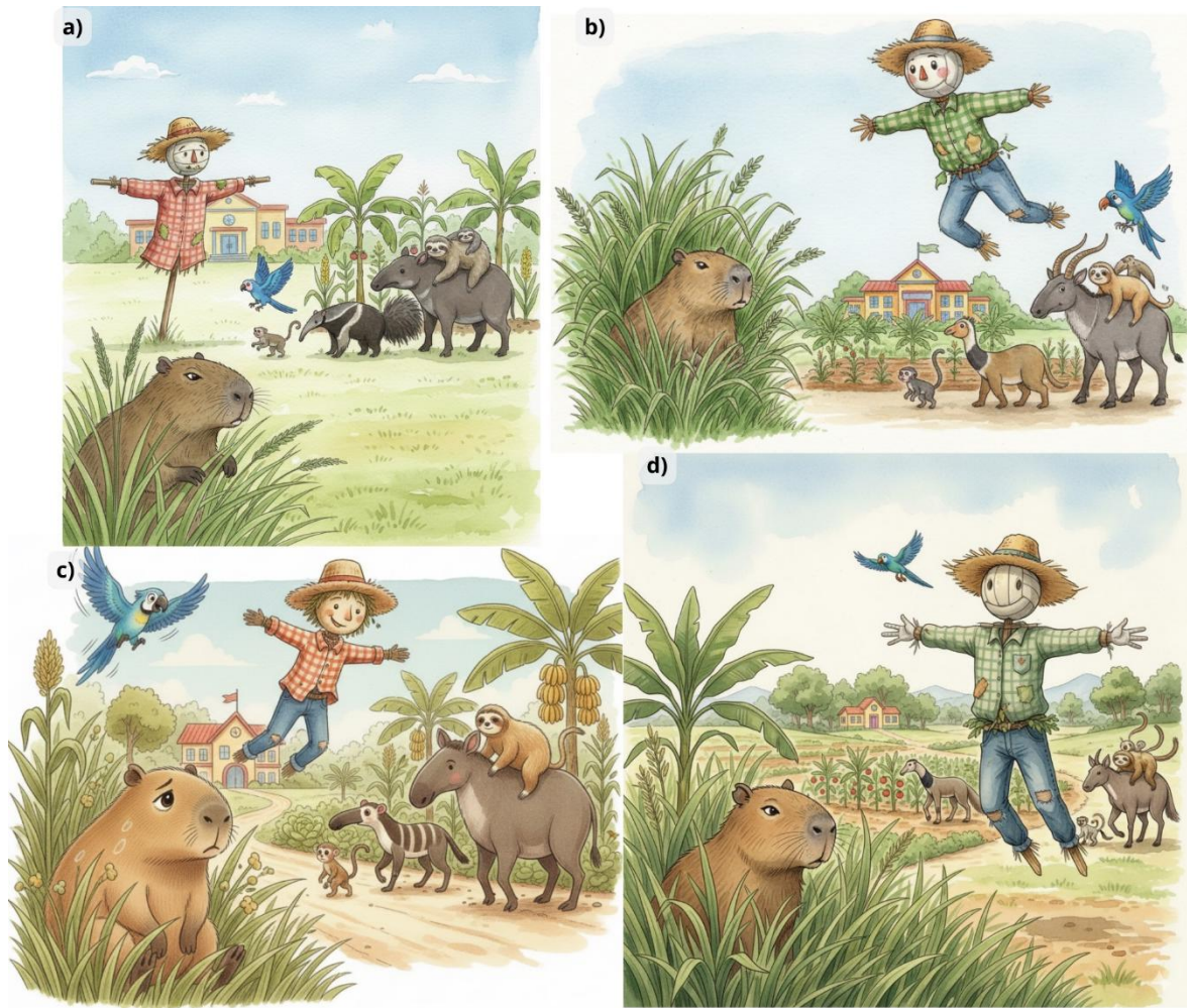
Figura 3- Variações geradas após solicitações de correção

(a) Capi se esconde em moita de capim limão enquanto observa a chegada dos animais, o sagui, a arara-azul, a anta, o tamanduá e a preguiça, Ervildo se aproxima dela, a horta é vista ao fundo, há incongruências botânicas como tomates nascendo na bananeira, espiga de milho não natural. (b) Capi se esconde em moita de capim limão enquanto observa a chegada dos animais, o sagui, a arara-azul, a anta, o tamanduá e a preguiça, Ervildo se aproxima dela, a horta é vista ao fundo, há incongruências botânicas como o tomate crescendo na bananeira, o fenótipo dos animais está inconsistente. (c) Capi se esconde em moita de capim limão enquanto observa a chegada dos animais, o sagui, a arara-azul, a anta, o tamanduá e a preguiça, Ervildo se aproxima dela, a horta é vista ao fundo, há incongruências na anatômica dos animais. (d) Capi se esconde em moita de capim limão enquanto observa a chegada dos animais, o sagui, a arara-azul, a anta, o tamanduá e a preguiça, Ervildo se aproxima dela, a horta é vista ao fundo, há incongruências botânicas, como tomates crescendo na bananeira e anatômicas.