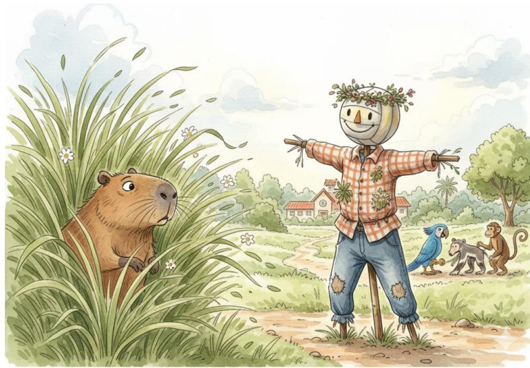
Figura 2 -Imagem gerada pela IA a partir do prompt individualizado