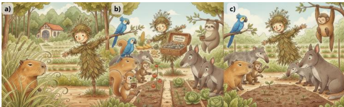
Figura 1- Ilustrações obtidas a partir de um único prompt

(a) Capi e Ervildo com a horta ao fundo (b) Capivara, Arara-Azul, Preguiça, Anta e Tamanduá observam a horta, Ervildo segura caixa com sementes, alguns animais foram adicionados em duplicata, há elementos inconsistentes como membros duplicados e erros no fenótipo dos animais. (c) Todos os animais observam a horta, há algumas inconsistências como membros duplicados e erros no fenótipo dos animais.