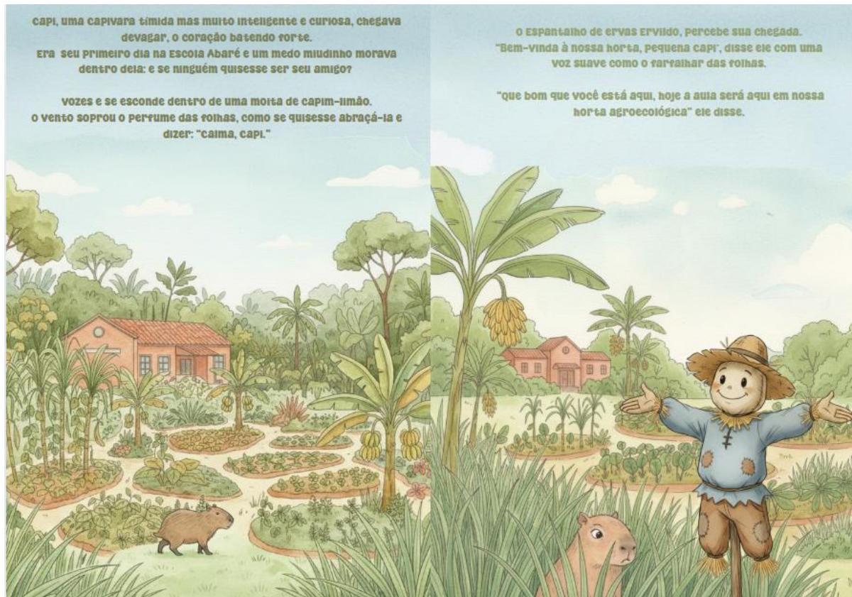
Figura 5 - Resultado da técnica mista de ilustração