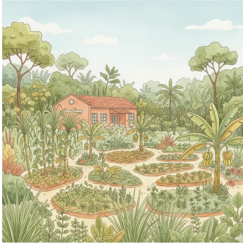
Figura 4 - Paisagem gerada por IA com prompt refinado