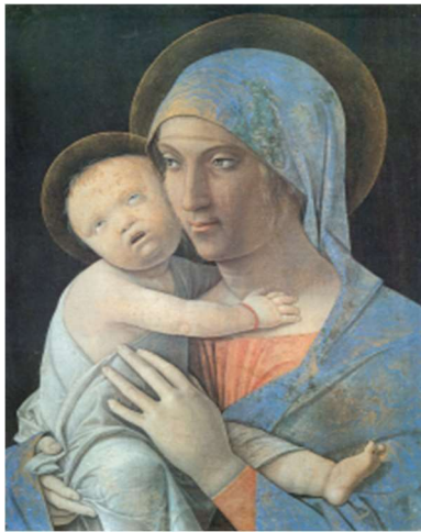
Figura 2 - Pintura Virgem e Criança

Fonte: Andrea Mantegna, cerca de 1460 – Mântua, Itália