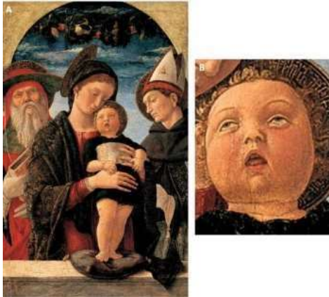
Figura 1 - Pintura Madona e Criança

Fonte: Andrea Mantegna, cerca de 1460 – Mântua, Itália