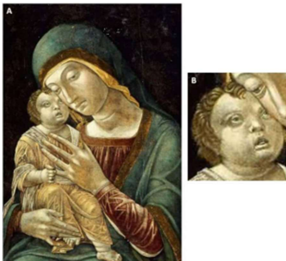
Figura 3 - Pintura Adoração do Menino Jesus

Fonte: Autor não confirmado, cerca de 1515 - Bélgicaou, Alemanha