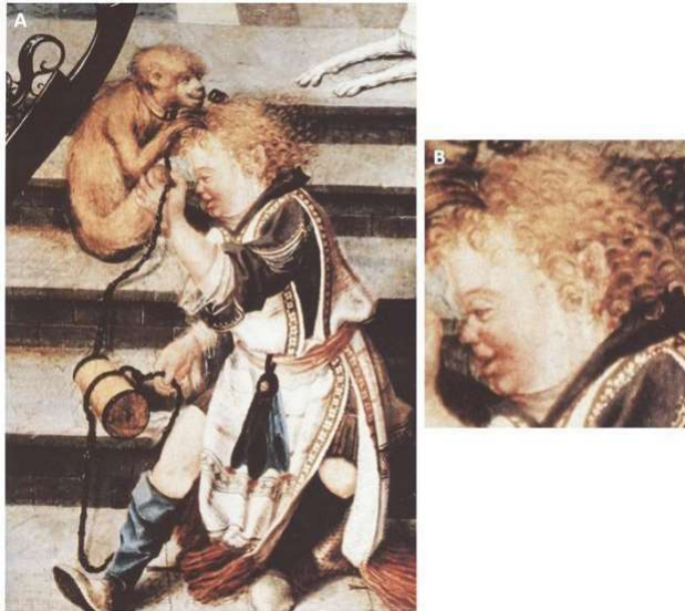
Figura 4 - Pintura de Criança e Macaco

Fonte: Autoria provável do artesão do altar da catedral, 1505 - Dusseldorf, Alemanha