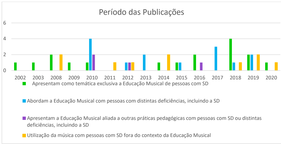
Gráfico 3 – Período das Publicações