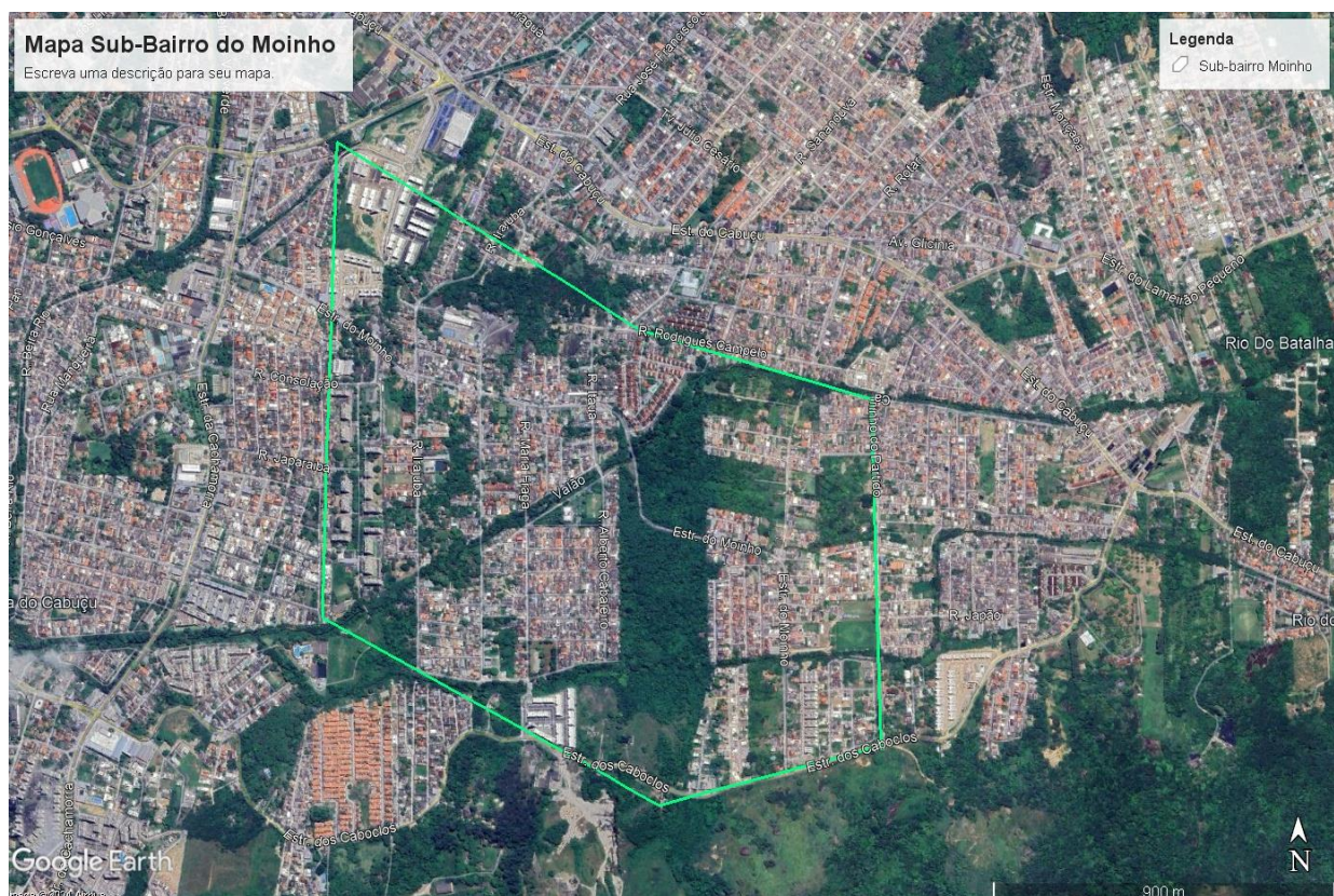
Mapa 1 – Mapa do Sub-bairro do Moinho

O Moinho é um sub-bairro localizado no bairro de Campo Grande, na Zona Oeste do Rio de Janeiro. O mapa 1 a seguir é uma delimitação do sub-bairro do Moinho e foi realizada pelo pesquisador com base nas respostas obtidas por meio de perguntas direcionadas aos moradores do local. Na legislação urbanística, não existe um conceito que trata ou define sub-bairros. Entretanto, entendemos aqui, que se trata de uma porção de um bairro que engloba um conjunto de ruas, avenidas, lugares símbolos e marcos espaciais, como praças e igrejas, que passam a ser conhecidos como parte de um sub-bairro. Logo, sub-bairro também é conhecido como uma divisão menor de um bairro. Tudo isso, operando em função de um padrão de apropriação do espaço por parte de seus habitantes, que com ele estabelecem um forte sentimento de pertencimento.