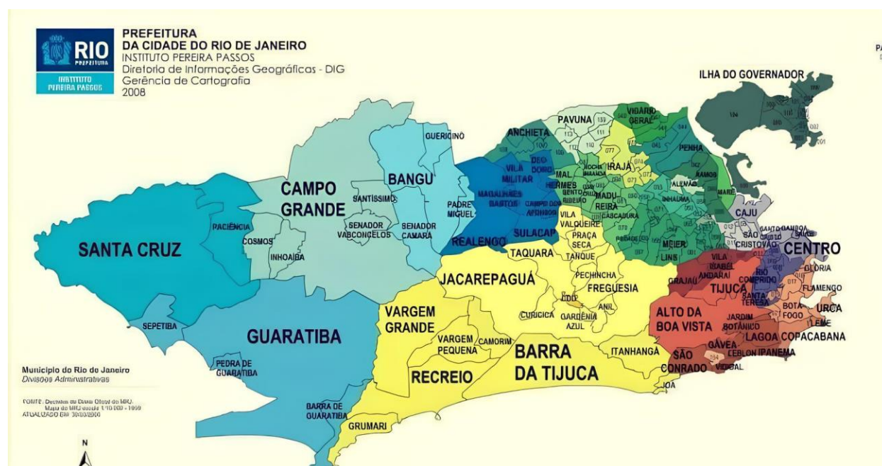
Figura 1 – Mapa do Município do Rio de Janeiro (Bairro de Campo Grande)

Desse modo, a pesquisa surge a partir da perspectiva do usuário do serviço público, com o intuito de investigar se a população está satisfeita ou não com a saúde e educação; se a sua estrutura e disponibilidade as atende. Assim, devido à grande extensão do bairro de Campo Grande (Figura 1), buscou-se delimitar um recorte espacial menor, o do sub-bairro do Moinho, já que o este sub-bairro carece postos e escolas públicas.