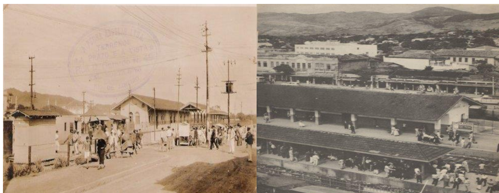
Figura 2 – Estação de Campo Grande no final do século XIX e em meados do século XX