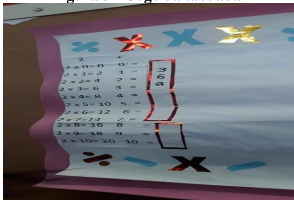
Figura 31- Jogo da tabuada