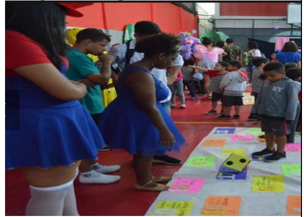
Figura 30- Jogo circuito matemático