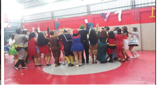
Figura 18- Dança da paródia