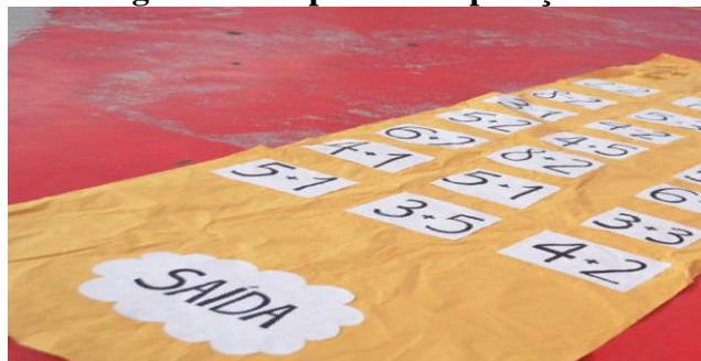
Figura 24- Tapete com operações