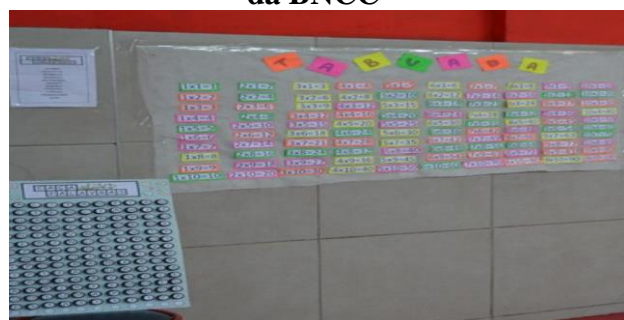
Figura 26- Jogos com as unidades temáticas da BNCC