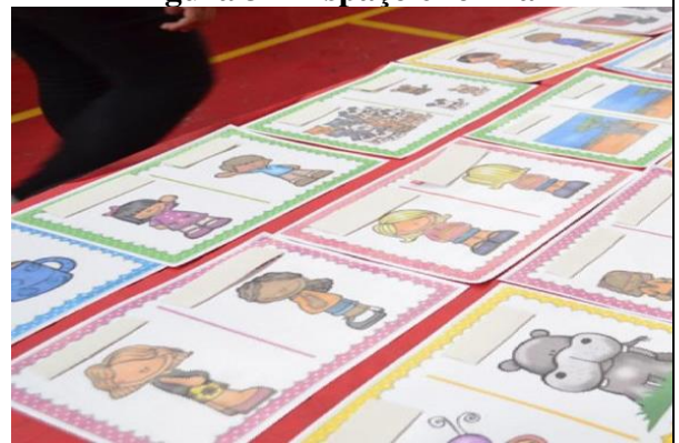
Figura 32- Espaço e forma