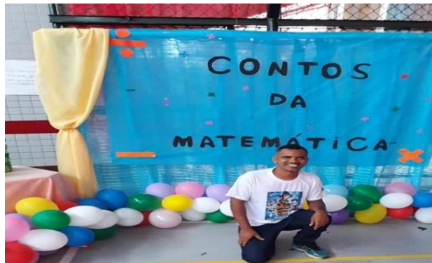
Figura 12- Atividades Contos da Matemática