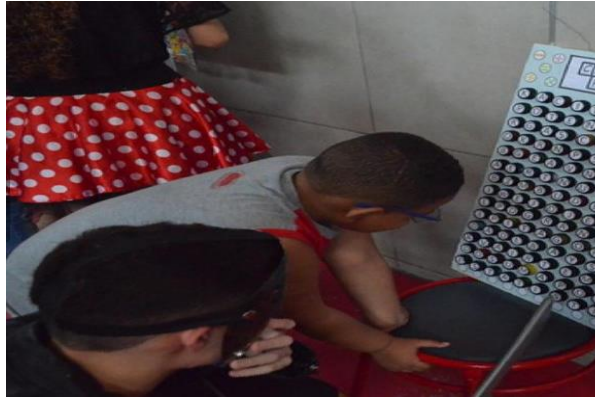
Figura 29- Caça palavras das unidades temáticas da BNCC