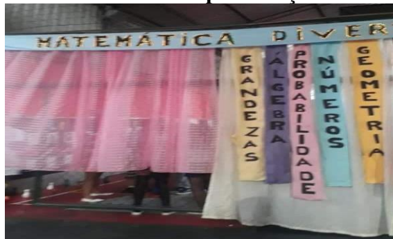
Figura 11- Unidades temáticas da Matemática uma apresentação oral