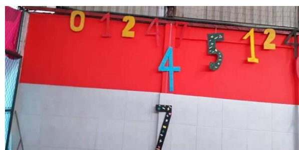
Figura 10- Os números em destaque