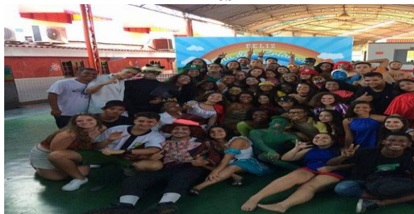
Figura 20- Matemática nos desenhos e filmes