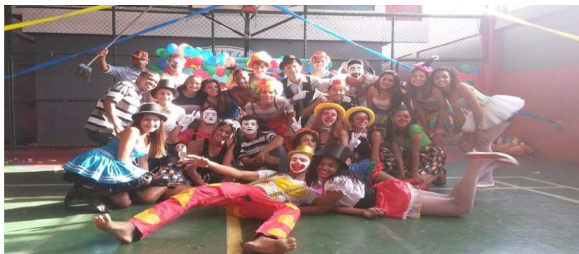
Figura 19- Matemática no circo

Cada aluno e aluna do Ensino Médio podem escolher um personagem para se caracterizar durante o evento. Este tipo de participação é opcional e quando escolhida pelo aluno é feita de acordo com o subtema e o grupo que ele acompanha, de maneira que o deixe o mais confortável possível. É este personagem que dá vida ao projeto, aproximando as crianças e as incentivando na participação das atividades. Há alunos que participam sem estar caracterizados, porém é cada vez menor o número de participantes não caracterizados.