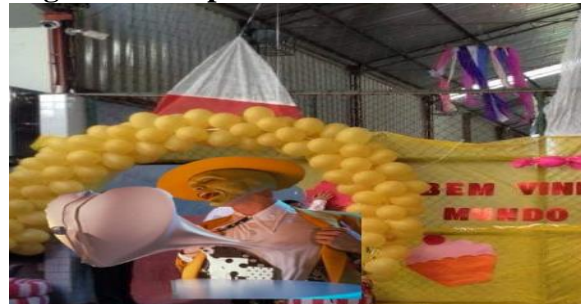
Figura 8- Grupo Matemática Encantada