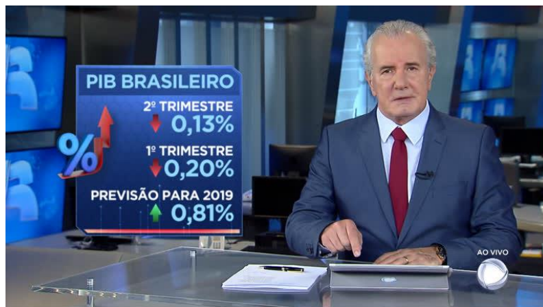
Figura- 4 Jornalismo televisivo