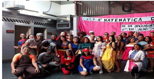
Figura 21- Superando os desafios