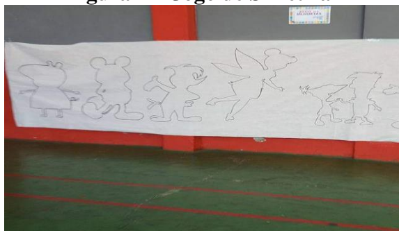
Figura 27- Jogo de Simetria