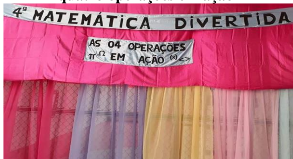
Figura 9- Representação teatral: As quatro operações em ação