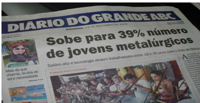
Figura 1-Uso da Matemática em porcentagem.

As reportagens a seguir ilustram a presença dos números e suas diversas interpretações para diferentes situações do cotidiano. É importante que a criança e o adolescente em idade escolar se apropriem de tal conhecimento para transformar e transformar-se.