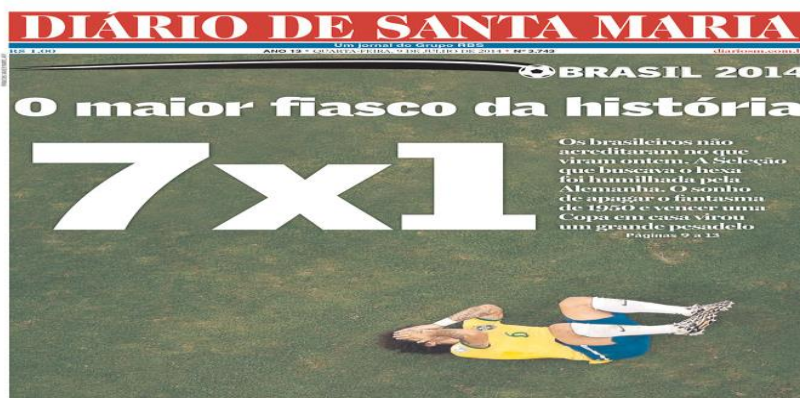
Figura 2 -Uso de números para informar o ano e o placar de um jogo de futebol