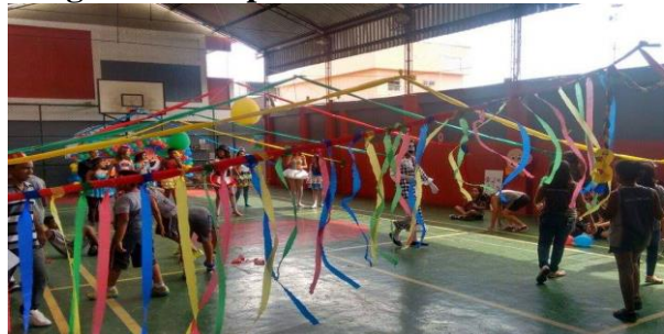
Figura 7- Grupo a Matemática no circo

sempre a conexão com a Matemática sem deixar de pensar no subtema do projeto sobre o qual o grupo específico irá trabalhar. Vejamos algumas cenas do projeto