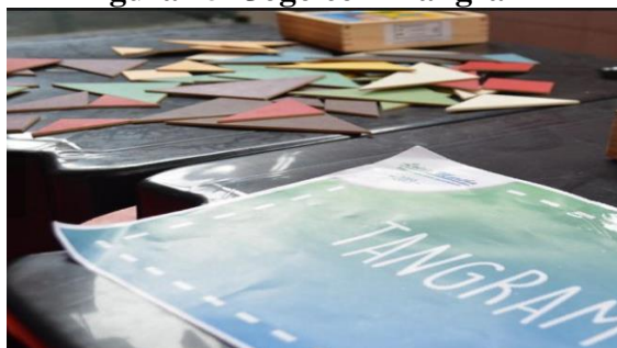
Figura 25- Jogo com Tangram