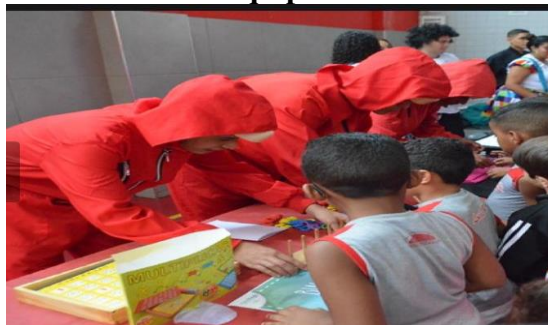
Figura 23- Jogo de tabuleiro em equipe