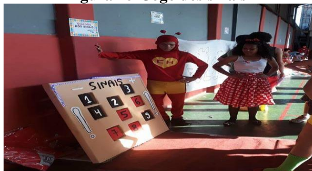
Figura 28- Jogo dos sinais