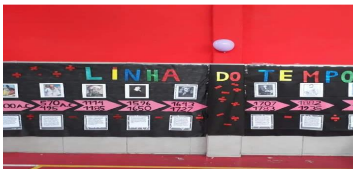
Figura 22- O jogo da Memória: A linha do Tempo

Cada grupo fica responsável por uma série da Educação Infantil e do Ensino Fundamental I para escolher o jogo que será aplicado. Existem jogos livres de colaboração, jogos individuais, jogos de tabuleiro, jogos de estratégia, desafios de Lógica-Matemática, jogos eletrônicos e até atividades desenvolvidas para celulares através de aplicativos. Esses jogos são avaliados também pelos professores e os mesmos aplicados previamente na sala de aula pela equipe de mediadores. Nem todos os jogos apresentados em sala estão presentes no dia do projeto, elemento de grande expectativa dos alunos, principalmente a dúvida em saber se o jogo mais popular estará ou não presente no dia do evento.