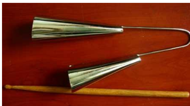
Figura 9 - Foto de um agogô, outro instrumento musical utilizado nos cultos de candomblé