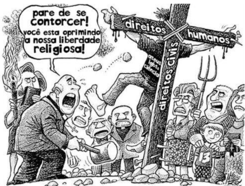
Figura 15 - Charge sobre intolerância religiosa