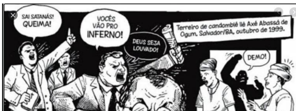
Figura 13 - Ilustração sobre perseguição dos terreiros de candomblé