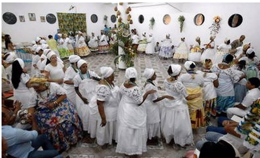
Figura 6 - Foto de um terreiro de candomblé