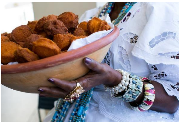
Figura 7 - ACARAJÉ - comida votiva preparada para culto à divindade Oyá