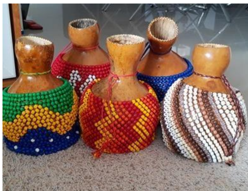
Figura 8 - Foto de xequerês instrumento musical utilizado nos cultos de candomblé