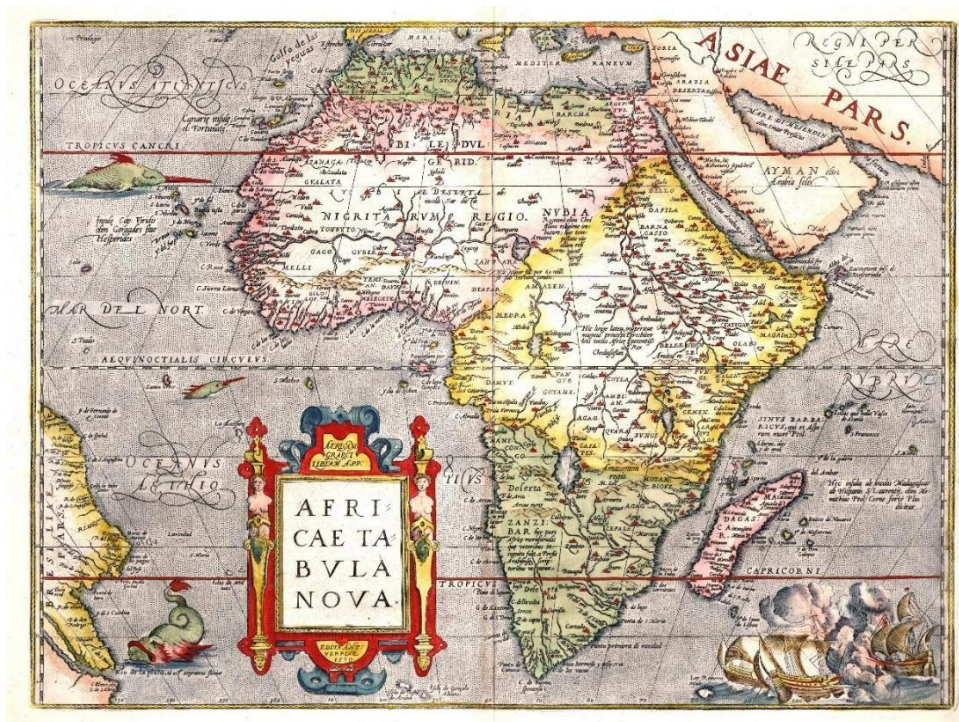
Figura 4 - Mapa desenhado de 1570 do Continente Africano