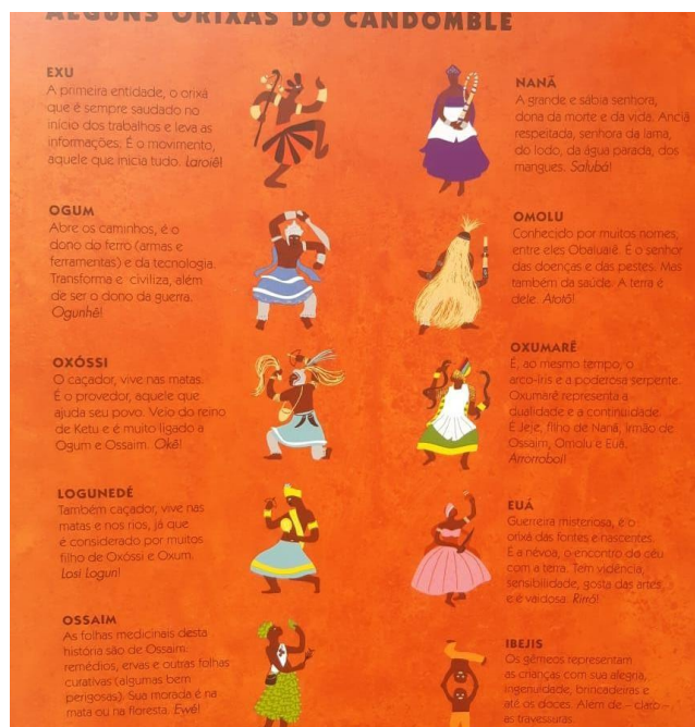
Figura 11 - Imagem de alguns Orixás