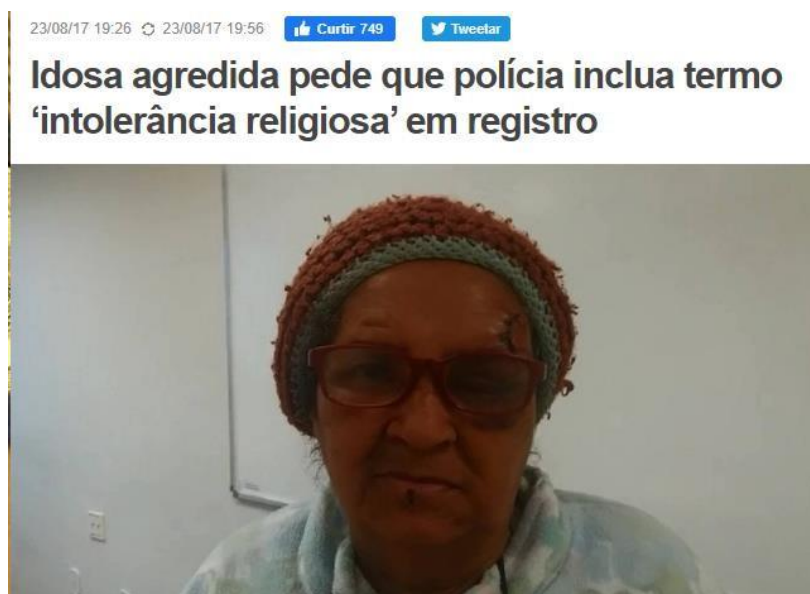
Figura 20 - Reportagem sobre idosa agredida por racismo religioso