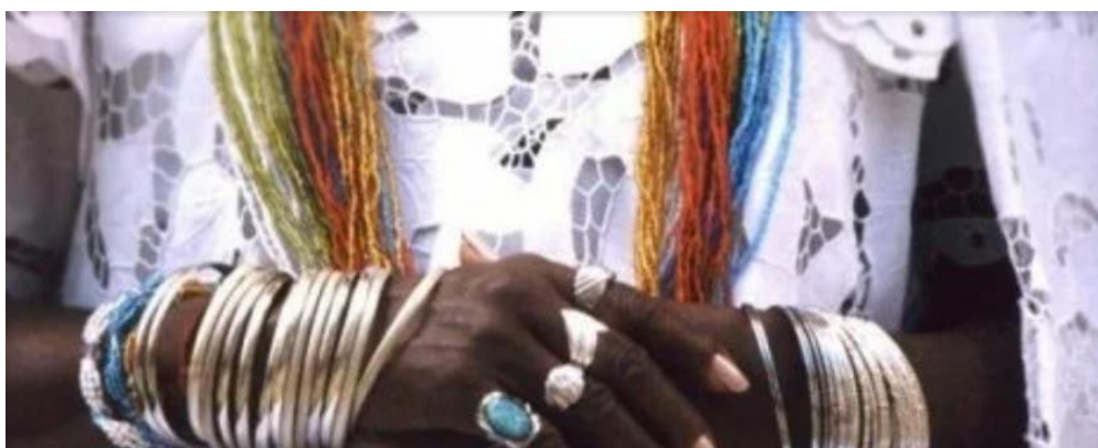
Figura 17 - Reportagem sobre discriminação religiosa no trabalho