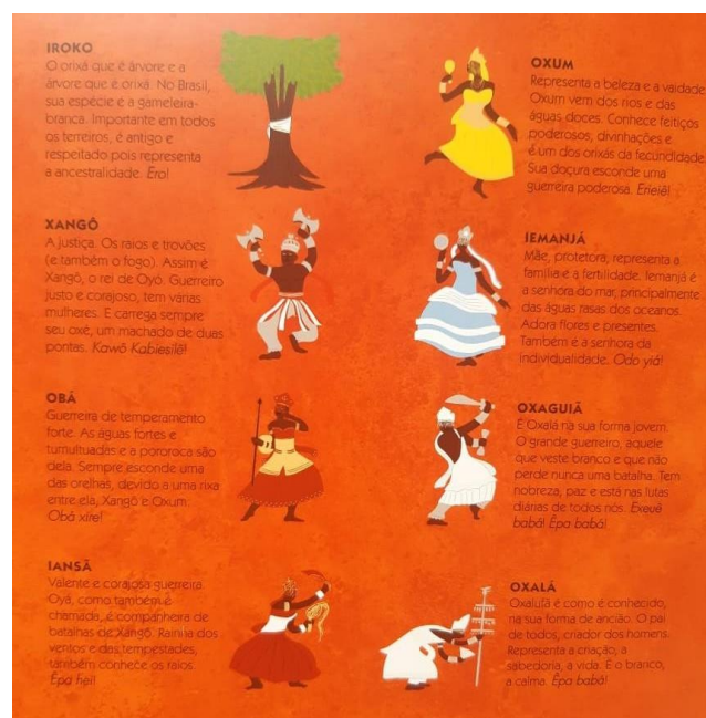
Figura 12 - Imagem de alguns Orixás