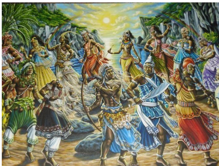
Figura 10 - Representação ilustrada dos Orixás