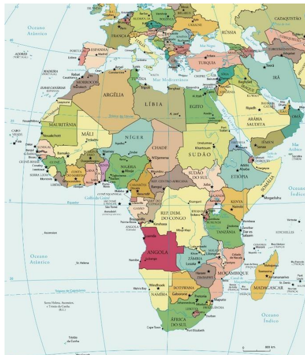
Figura 5 - Mapa Político do Continente Africano atualizado