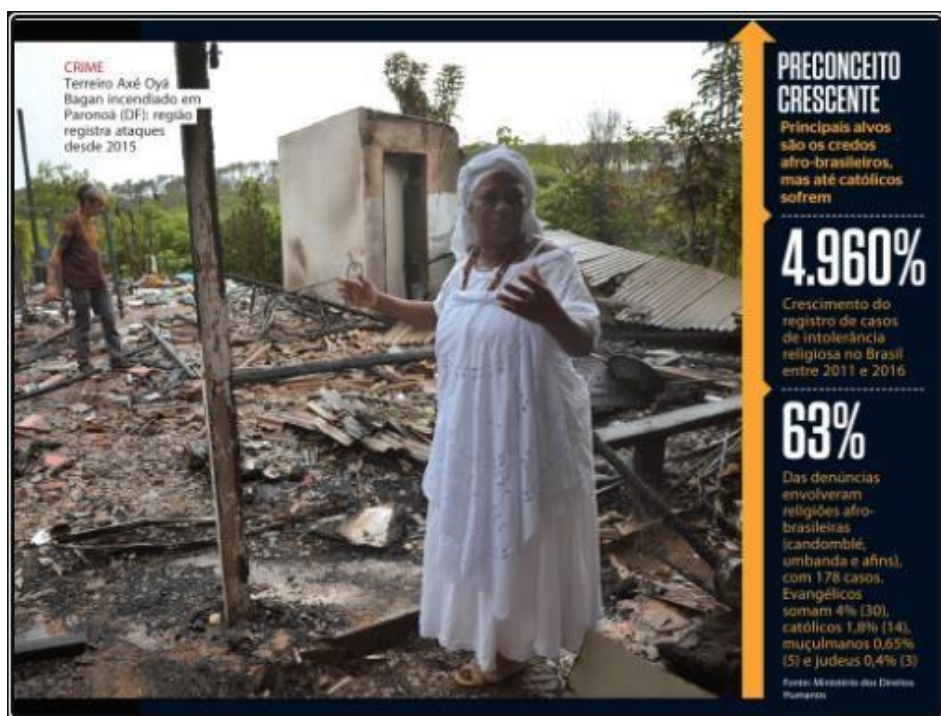
Figura 18 - Reportagem sobre incêndio criminoso em uma casa de candomblé