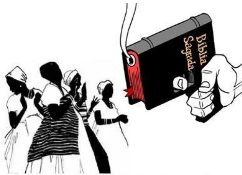
Figura 16 - Ilustração sobre perseguição cristã aos povos de terreiro