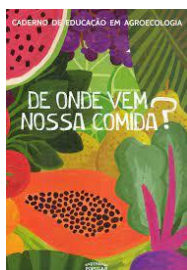
Figura 2- Capa do livro de vem nossa comida?

Esse caderninho, lançado pelo Movimento dos Trabalhadores Sem-Terra durante a 1ª Feira Nacional da Reforma Agrária de 2015, chega a sua 2ª edição em março de 2016. Ele serve de material de trabalho junto aos jovens no sentido de conhecermos um pouco sobre a produção das plantas, a domesticação dos animais, as mudanças que ocorrem na agricultura e que impactos trouxeram sobre a vida. Como começamos a cultivar os alimentos? Como começou a agricultura? De onde ela veio? Esperamos, com esse caderninho, compreender melhor a importância da produção de alimentos saudáveis e da agroecologia. (In: EXPRESSÃO POPULAR. De Onde Vem Nossa Comida? 2016.)