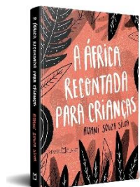
Figura 4- Capa do livro A África recontada para crianças

Com muita criatividade, este livro nos convida a uma viagem pelas histórias contadas nos países africanos onde também se fala português. Angola, Moçambique, Guiné- Bissau, Cabo Verde e São Tomé e Príncipe... Lá tem lobo, coelho, leão – e muitas outras aventuras. As histórias deste livro são, acima de tudo, bem humoradas. Atravessadas por adivinhas, músicas, descrições de gastronomia, vestimentas e tantos outros elementos que formam a cultura de um país. Um tributo à África, à língua portuguesa e aos contadores de histórias. As crianças agradecerão, e nós, adultos, também. (In: SILVA, Avani Souza. A África Recontada para Crianças. São Paulo: Martin Claret,2020.)