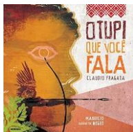
Figura 5- Capa do livro O tupi que você fala

Guri, pipoca, saci, guaraná, abacaxi. Podemos não perceber, mas é comum falarmos tupi. As palavras de origem indígena fazem parte do nosso cotidiano e com O tupi que você fala as crianças descobrirão que vários alimentos, animais e plantas têm nomes dados pelos índios. (In: FRAGATA, Cláudio. O Tupi que Você Fala. São Paulo: Globo Livros, 2015.)