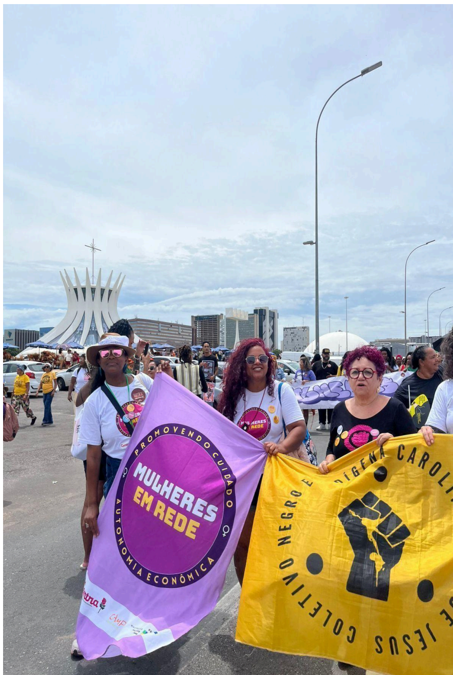
Imagem 29 – Participação na II Marcha das Mulheres Negras