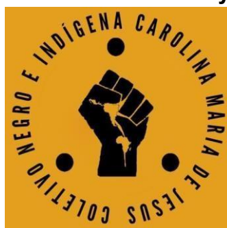
Figura 3 – Terceira Logo do Coletivo, Punho Antirracista envolto do Grafismo Puri e com o território de Abya Ayala