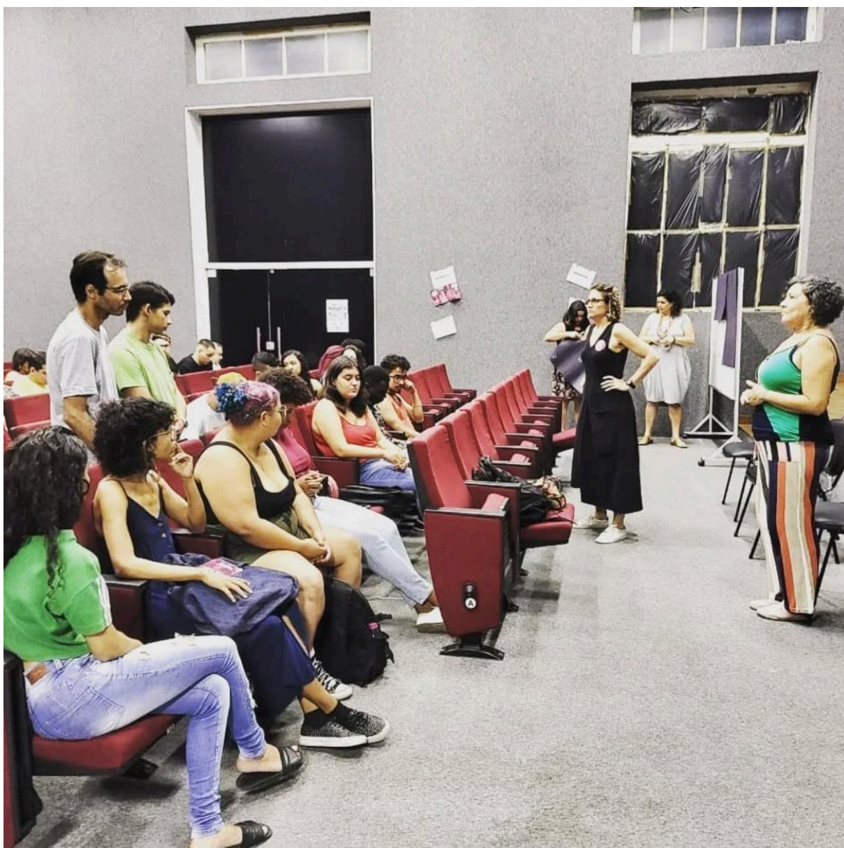
Imagem 13 – Roda de Conversa: Não vamos fechar os olhos