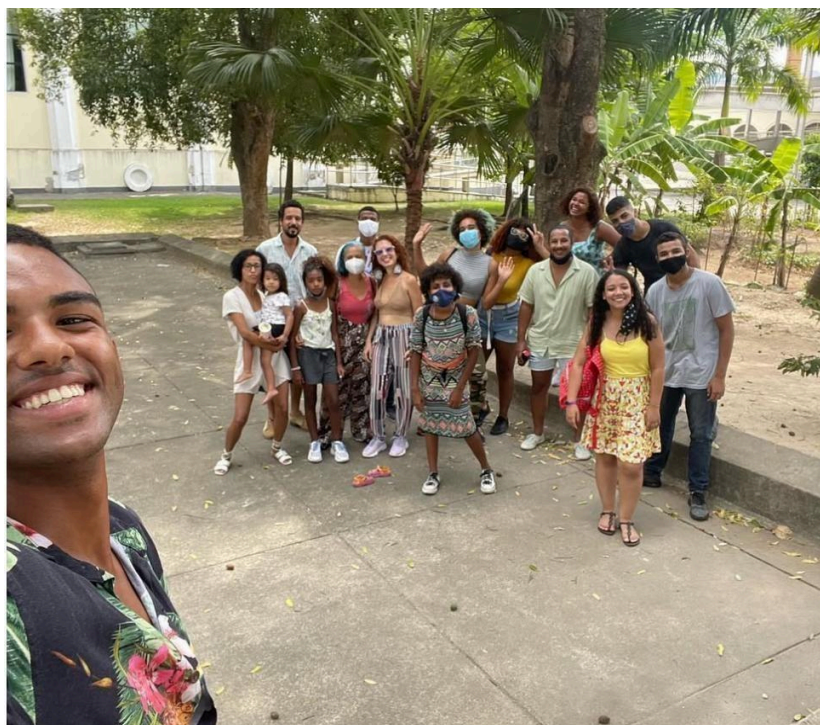
Imagem 12 – (Re)Existências Negras na Voz de Elza Soares