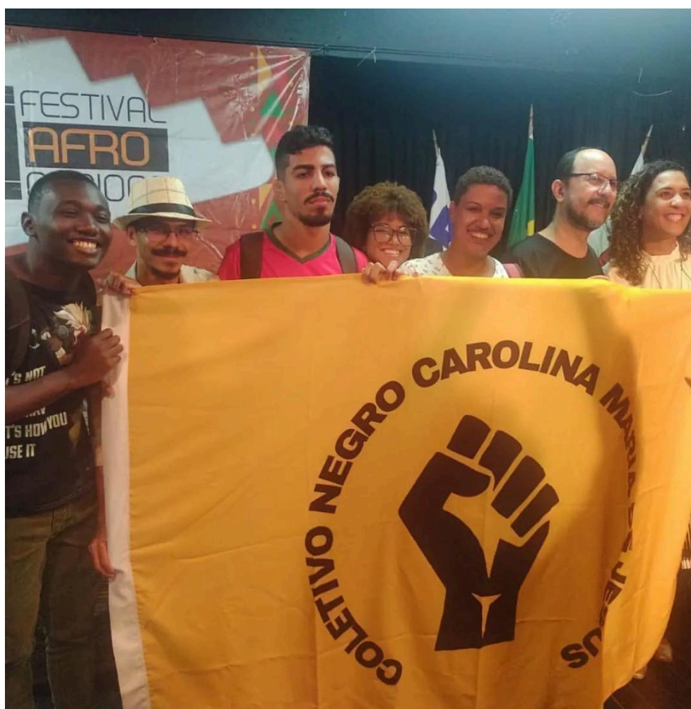
Imagem 26 – Integrantes do Coletivo no evento Rio Antirracista com a Ministra Anielle Franco