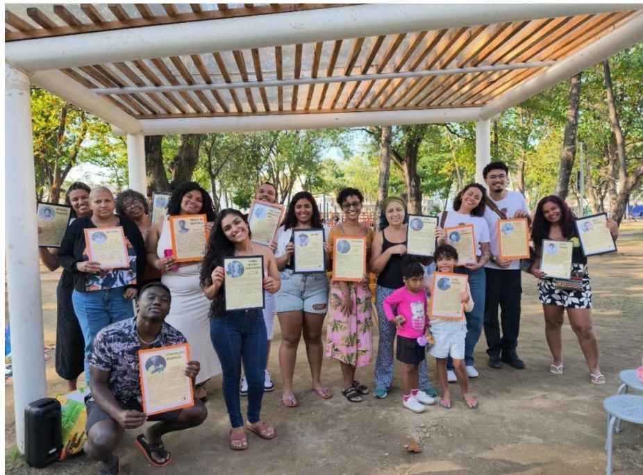
Imagem 22 – Participantes da Feijoada das Pretas com Referenciais de Mulheres Negras