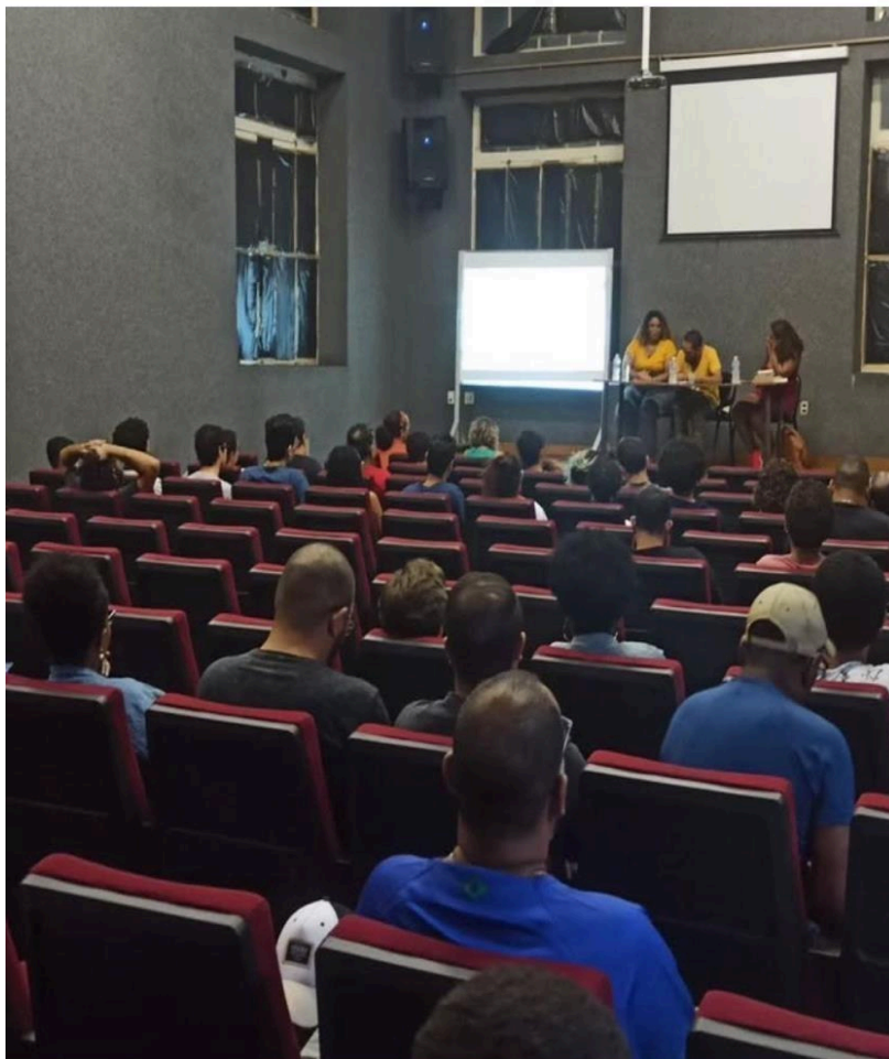
Imagem 14 – Palestra Mês da Consciência Negra