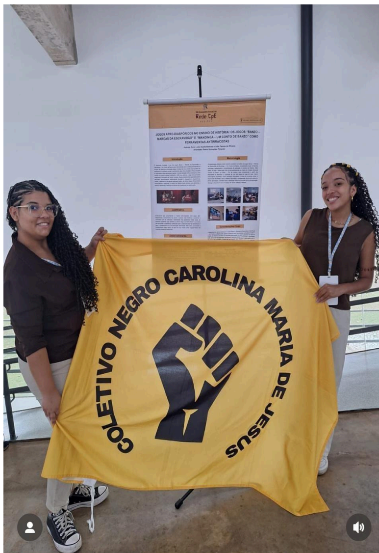
Imagem 28 – Apresentação de trabalho no Encontro Nacional da CPE