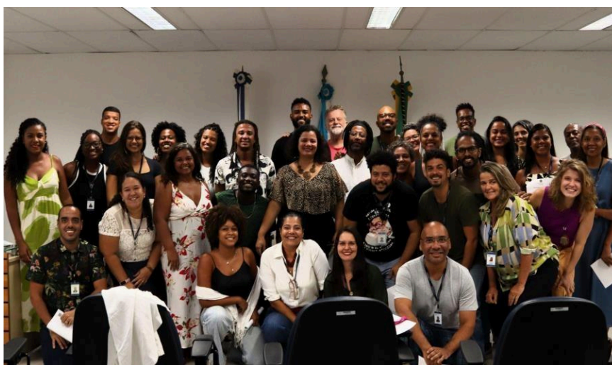
Imagem 9 – Posse do Comitê de heteroidentificação