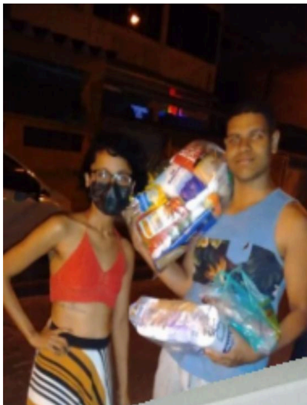
Imagem 5 – Doação de Cesta Básica