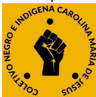
Figura 2 – Segunda logo do Coletivo, após o ingresso de um integrante indígena, com o grafismo Puri – Pirirêma – que significa Coletivo, Grupo