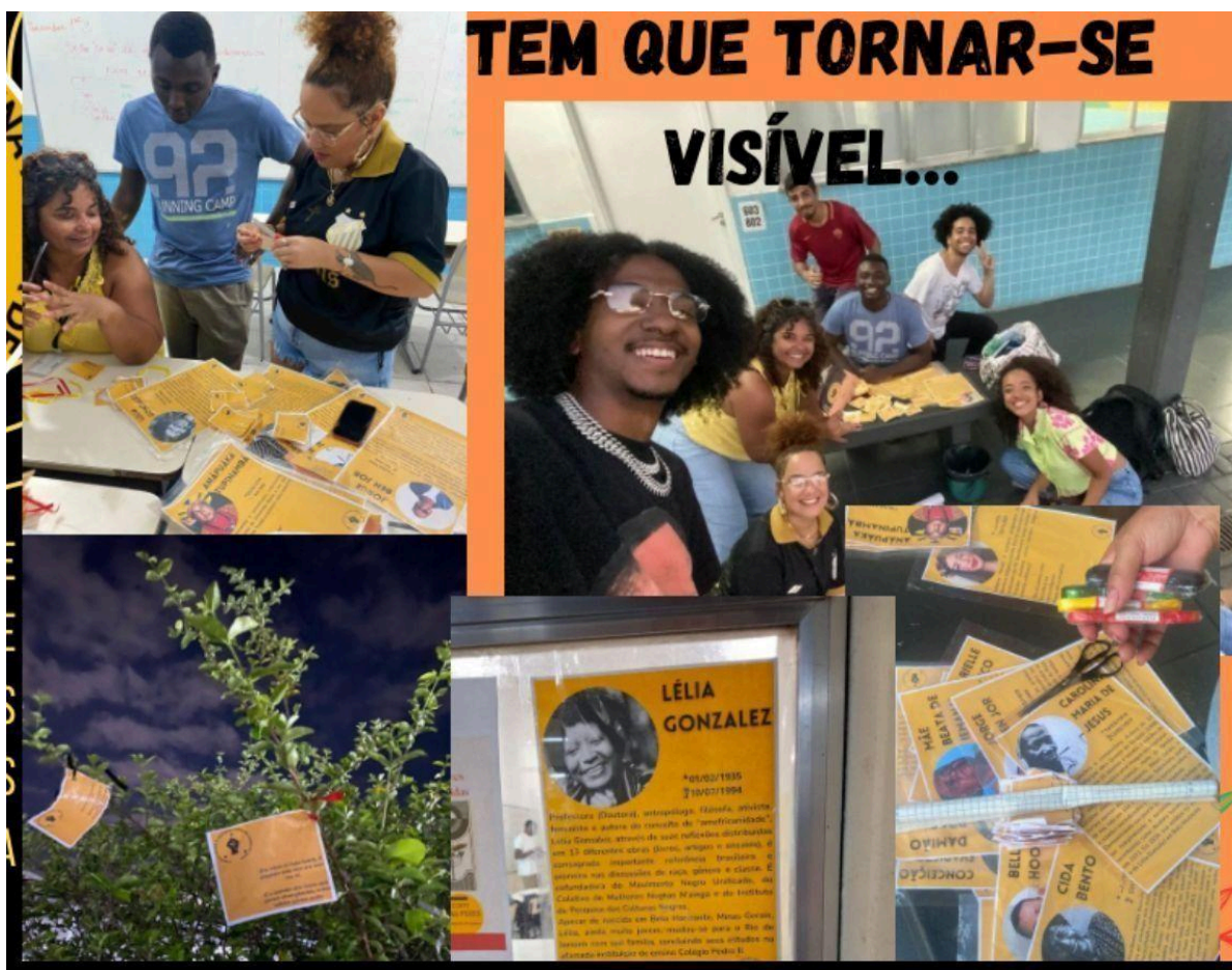
Imagem 18 – Montagem da exposição do projeto Decoloniza CP2 Realengo