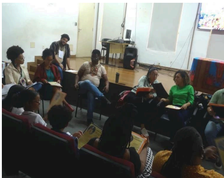
Imagem 23 – Participantes do II Fórum de Educação Antirracista contemplando os referenciais negros e indígenas