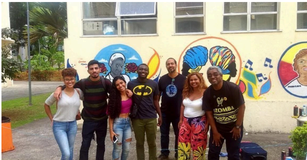
Imagem 16 – Kizomba 2025: Oficina Tornar-se Negro e Indígena