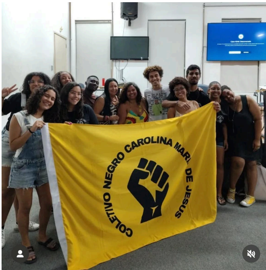
Imagem 21 – Integrantes do Coletivo na Semana Acadêmica de História 2025