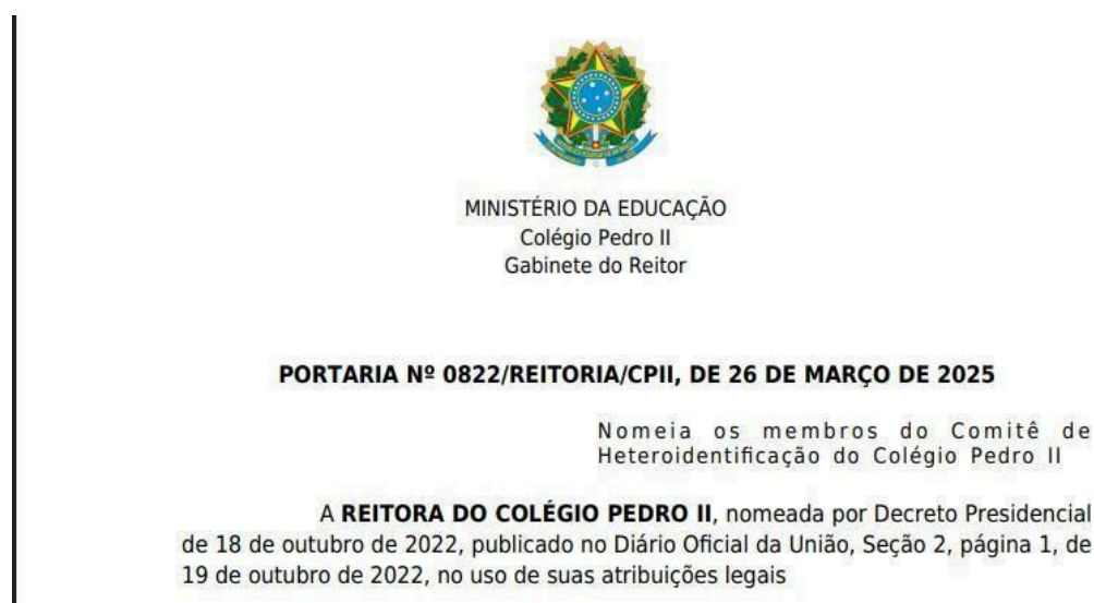
Imagem 8 – Trecho da Portaria nº 0822/REITORIA/CPII e membros do Coletivo nomeados