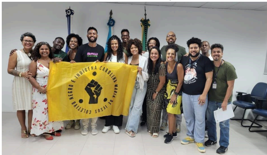
Imagem 10 – Membros do Neabi e CNICMJ na posse do Comitê de heteroidentificação