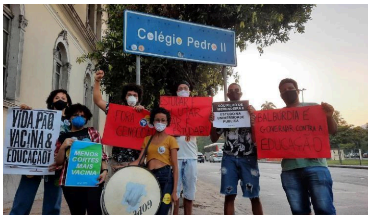
Imagem 1 – Integrantes do Coletivo no Ato Ocupa Pedrão: CP2 Resiste