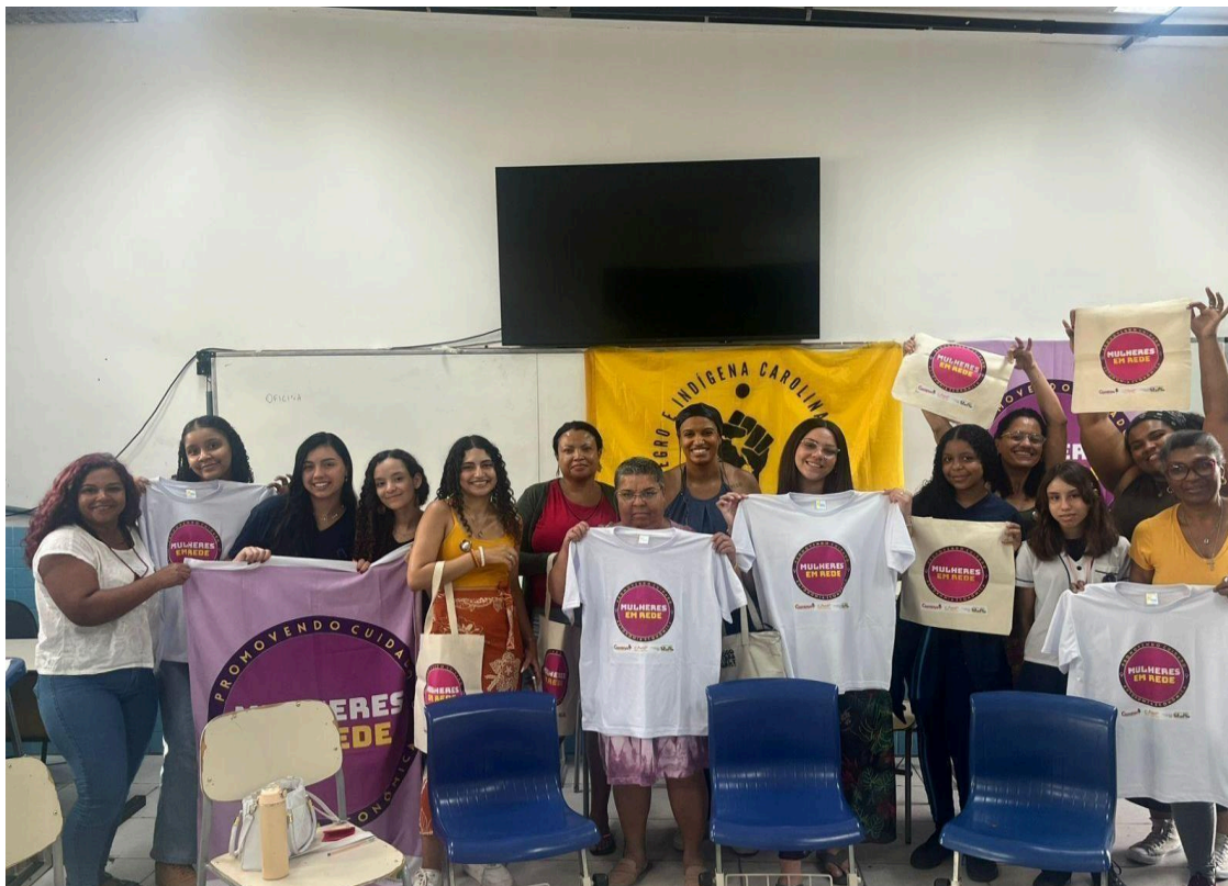
Imagem 17 – Kizomba 2025: Oficina Meninas e Mulheres: entre Cuidados, Sonhos e Estudos