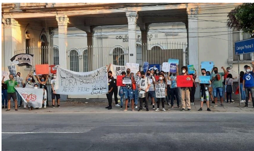
Imagem 2 – Ato Ocupa Pedrão: CP2 Resiste