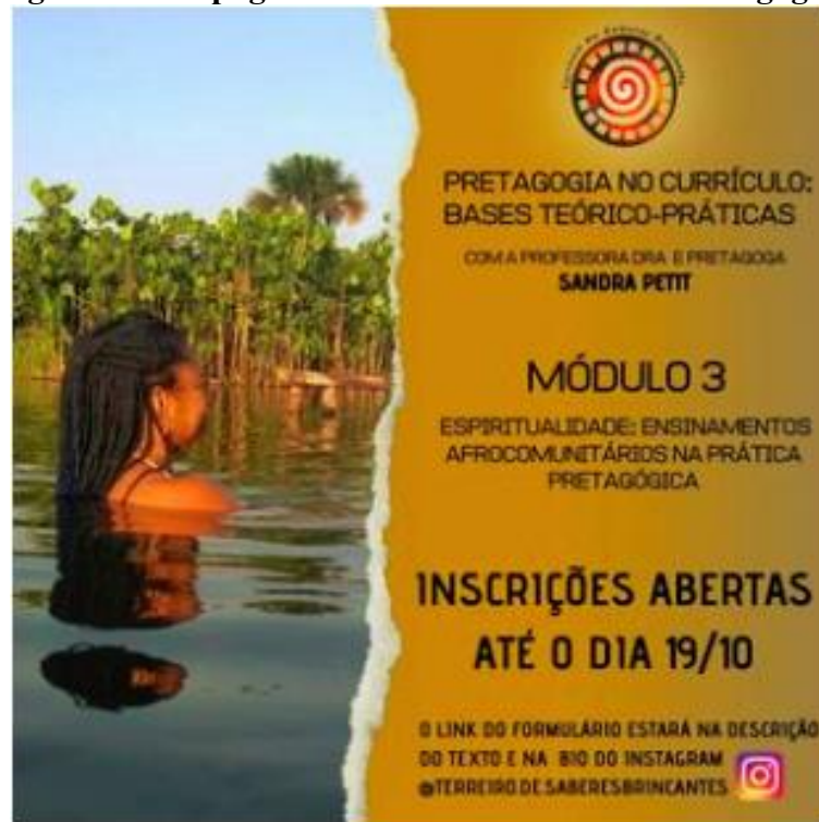
Figura 3 – Propaganda do módulo 3 do curso Pretagogia.