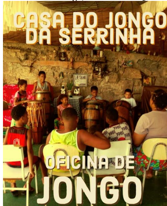
Figura 10 – Oficina de Jongo, realizada no Quilombinho.