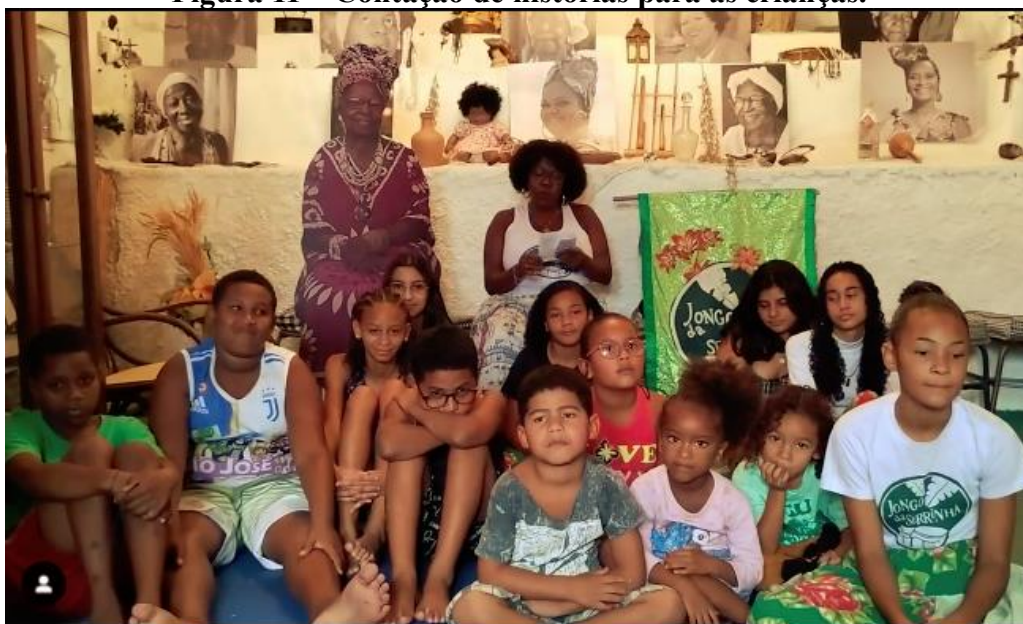
Figura 11 – Contação de histórias para as crianças.