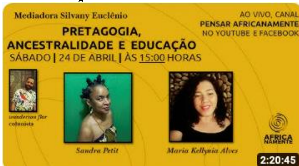
Figura 4 – Palestra virtual no Youtube.