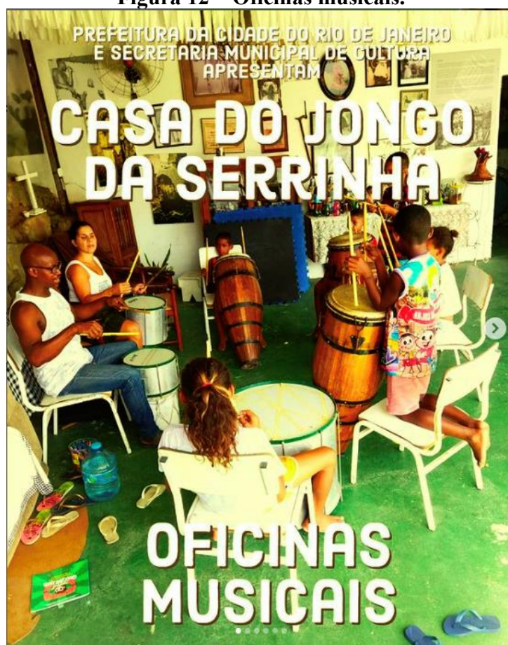
Figura 12 – Oficinas musicais.