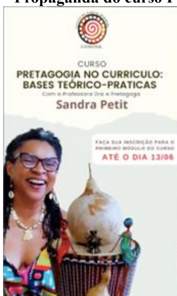
Figura 2 – Propaganda do curso Pretagogia.