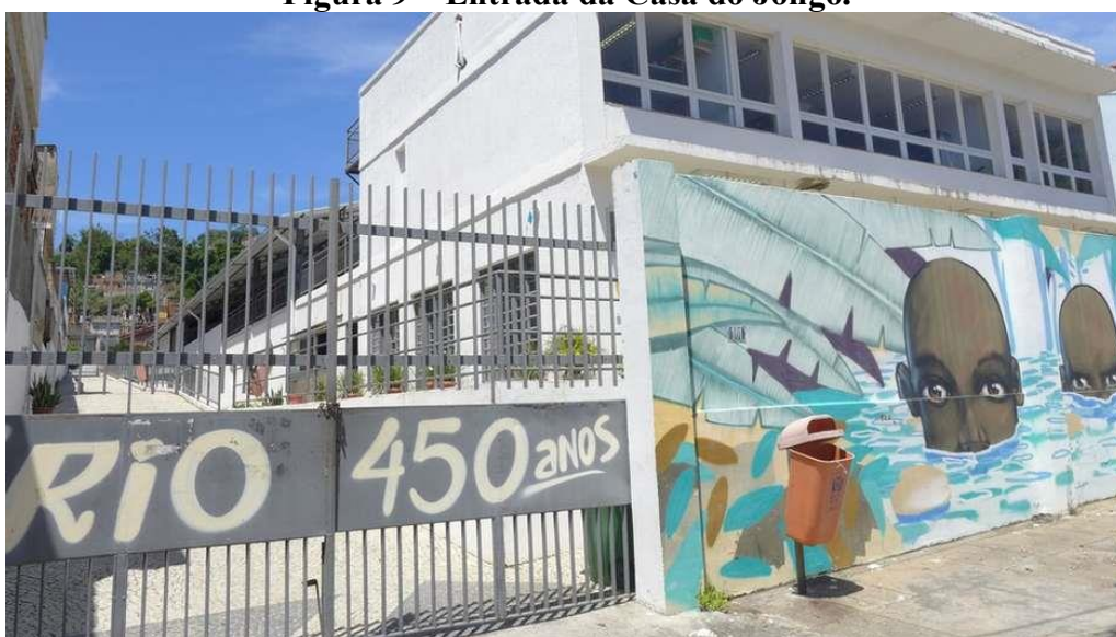
Figura 9 – Entrada da Casa do Jongo.

O grupo musical Jongo da Serrinha atua até hoje sendo administrado pelos herdeiros e demais colaboradores. No ano de 2000 virou a Organização Não Governamental Associação Grupo Cultural Jongo da Serrinha, adotando um caráter jurídico e, ao longo do tempo, ampliando suas frentes de trabalho: concorrendo a editais de cultura, captação de recursos e oferecendo formação socioeducativa através de oficinas artísticas para mais de 100 crianças e jovens. Sua sede fica na Casa do Jongo 57 , no bairro de Madureira, zona norte da cidade do Rio de Janeiro.