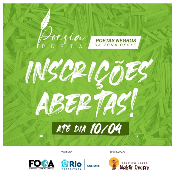
Figura 5 - Inscrições do Poesia Preta: Poetas Negros(as) da Zona Oeste