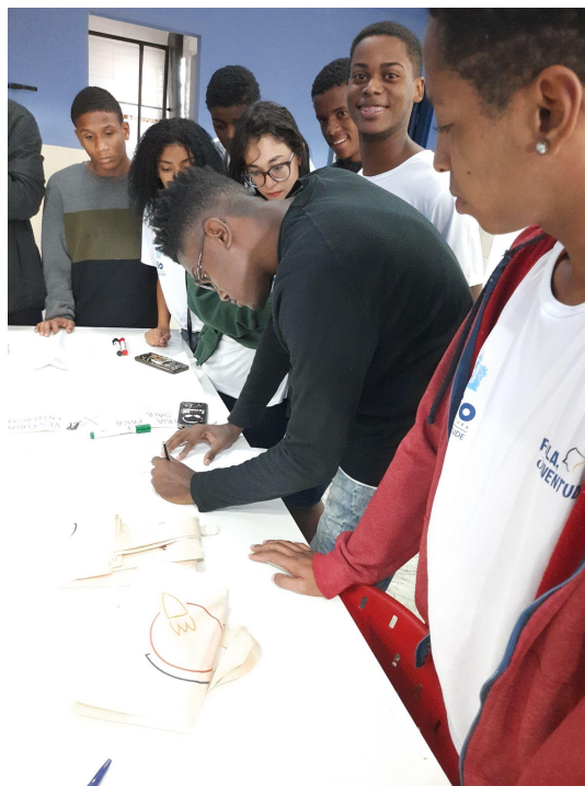
Figura 6 - Alunos da Cidade de Deus fazendo o Mapa dos Movimento Periféricos

Fonte: Foto tirada pela autora, projeto Papo de Futuro na Cidade de Deus (2022).