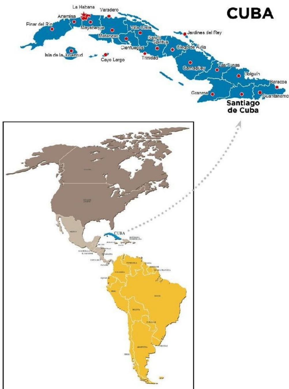
Anexo 4: Mapa da América com localização geográfica de Cuba