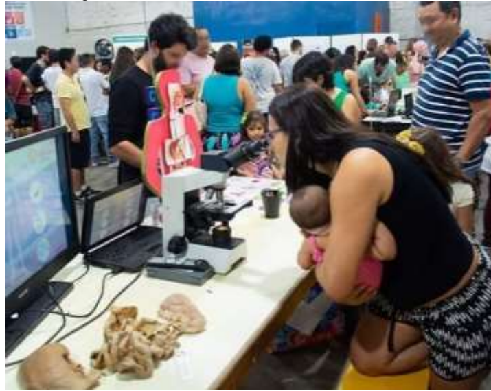
Figura 27 – Público visitante em evento no ECV