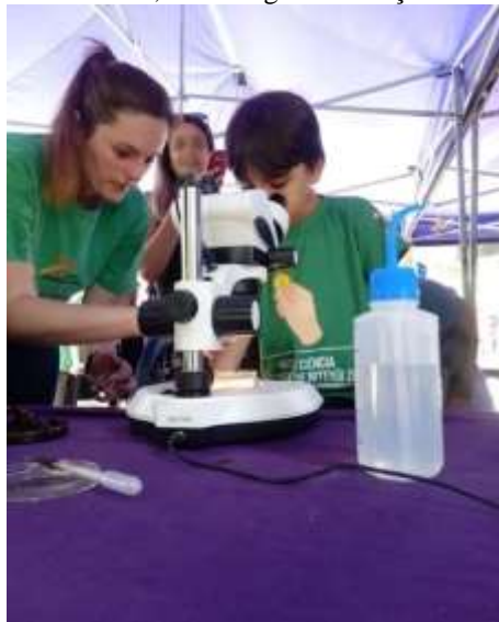
Figura 7 – Menino olhando na lupa durante participação do ECV no projeto Ciência Sob Tendas, da IV Feira Municipal de Ciência, Tecnologia e Inovação de Niterói, em 2019