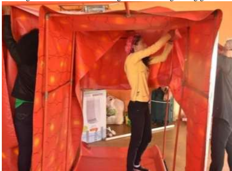
Figura 35 - Processo de montagem de vaso sanguíneo gigante