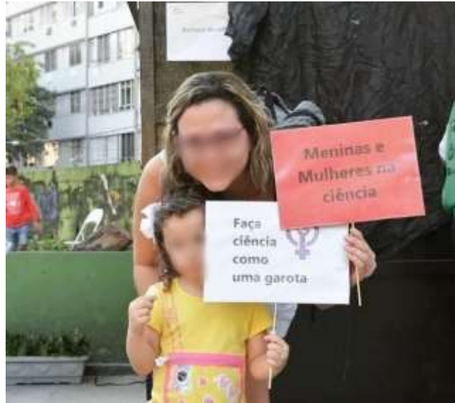
Figura 14 – Mulher com menina no Sábado da Ciência intitulado “As Incríveis Mulheres Cientistas”