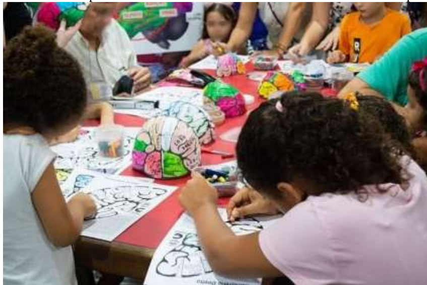
Figura 17 – Oficina de pintura no Sábado da Ciência com tema “Por dentro do corpo humano”