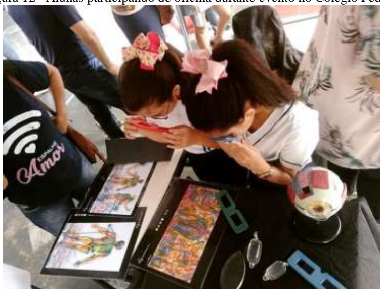
Figura 12– Alunas participando de oficina durante evento no Colégio Pedro II