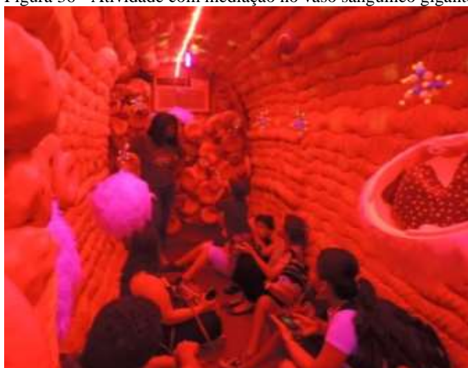
Figura 36 - Atividade com mediação no vaso sanguíneo gigante