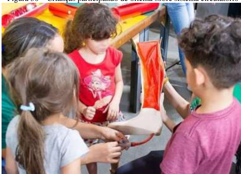
Figura 30 – Crianças participando de oficina sobre sistema circulatório