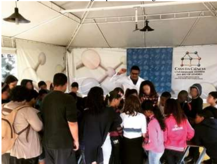
Figura 11 – Apresentação da oficina "Uma viagem pelo sistema digestório" em evento na Casa da Ciência