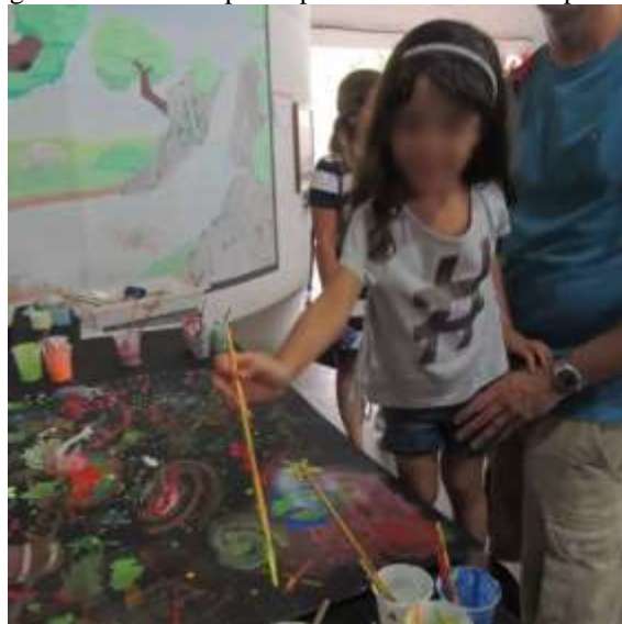
Figura 34 – Menina participando de atividade de pintura