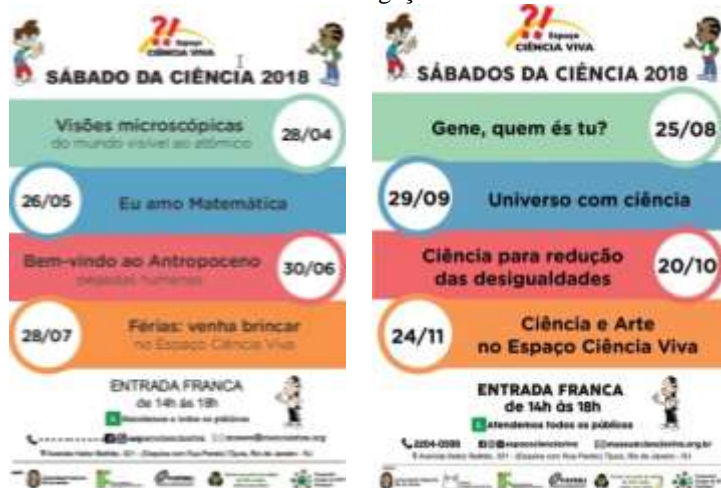
Figura 20 - Cartazes semestrais de divulgação dos Sábados da Ciência de 2018