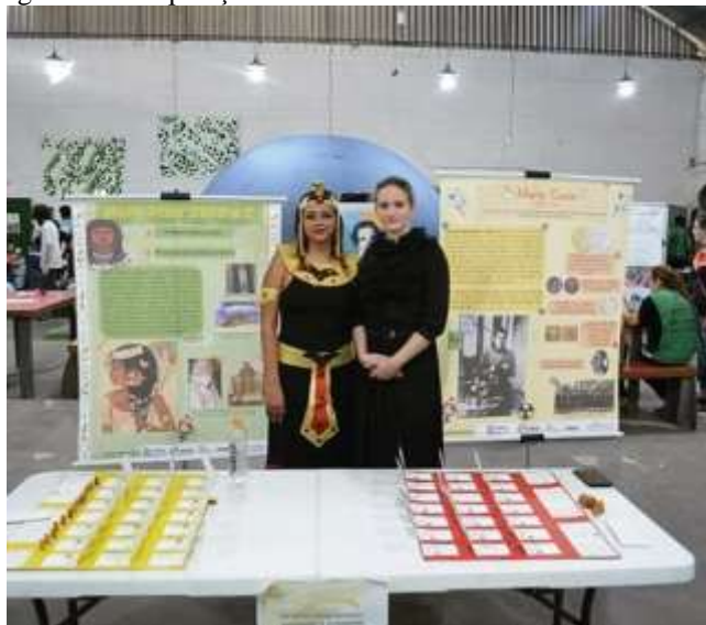
Figura 32 – Exposição sobre “As incríveis mulheres cientistas”

As figuras 33 a 36 ilustram mais algumas oficinas que são desenvolvidas no ECV nos Sábados da Ciência.