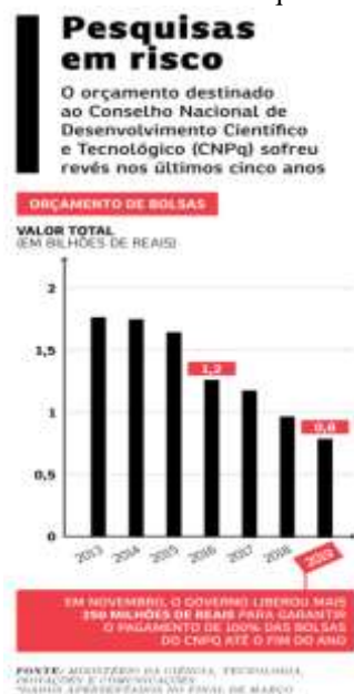
Figura 31 – Recorte da reportagem “Cortes e mais cortes: o que será da Ciência e da pesquisa no Brasil?” 9