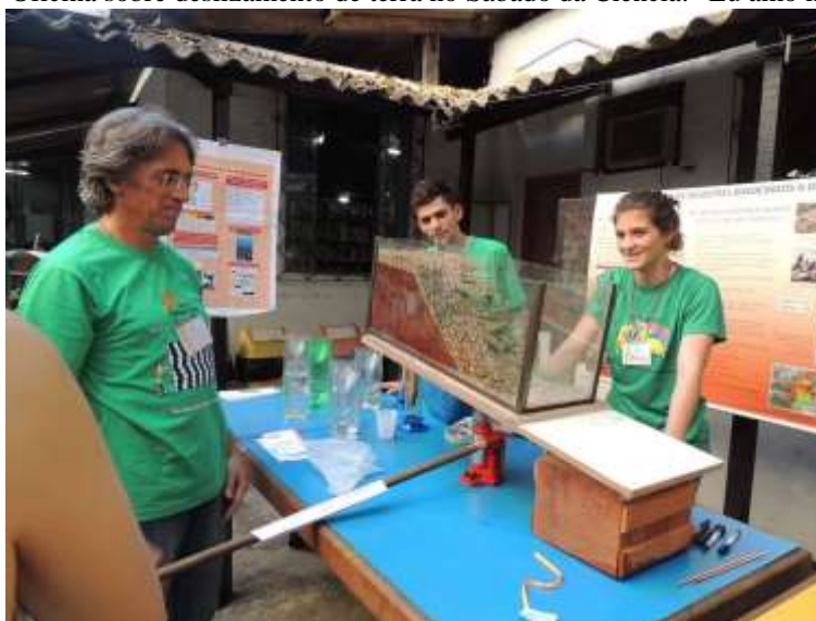
Figura 24 - Oficina sobre deslizamento de terra no Sábado da Ciência: "Eu amo matemática!"

As imagens (figuras 24 a 30) abaixo ilustram algumas dessas atividades. A figura 24, por exemplo, mostra a utilização de maquetes para explicar os mecanismos físicos dos deslizamentos de terra e como as ações do homem (e as características naturais) influenciam nesse processo. Já na figura 25, os participantes estão aprendendo a construir instrumentos de sopro utilizando materiais recicláveis.