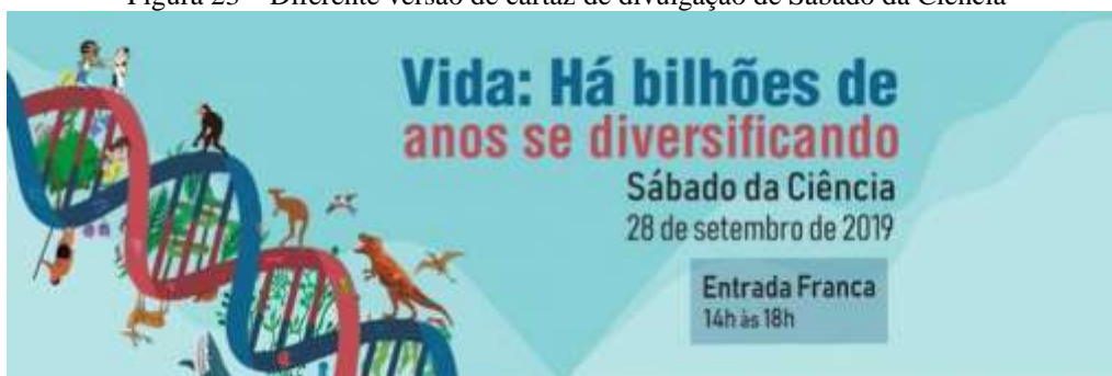
Figura 23 – Diferente versão de cartaz de divulgação de Sábado da Ciência