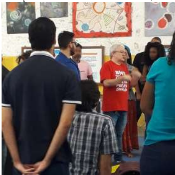
Figura 6 - Curso de Formação de Planetaristas do Museu da Vida, sediado pelo ECV em 2020