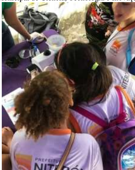
Figura 8 – Crianças fazendo observação na lupa durante participação do ECV no projeto Ciência Sob Tendas, da IV Feira Municipal de Ciência, Tecnologia e Inovação de Niterói, em 2019