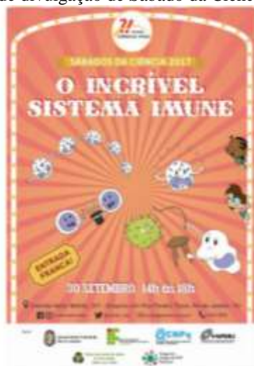
Figura 18 – Cartaz de divulgação de Sábado da Ciência (setembro de 2017)