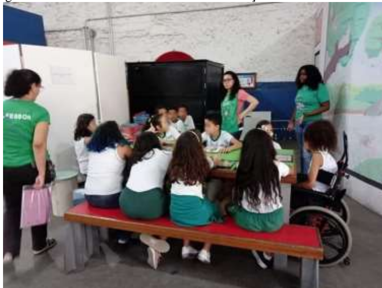
Figura 3 – Mediadoras e alunos durante a visitação de uma escola ao ECV

O museu possui uma exposição fixa que contempla atividades interativas com módulos e oficinas sobre diferentes temáticas, a qual pode ser visitada a partir do agendamento das escolas e outros grupos (Figuras 3 e 4) onde é cobrada uma taxa de entrada por aluno, e é feito o acompanhamento por mediadores bolsistas.