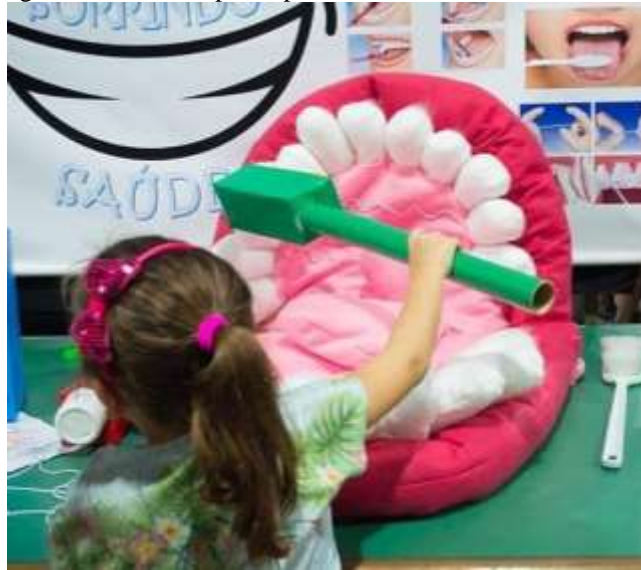
Figura 33 – Menina participando de oficina sobre saúde bucal