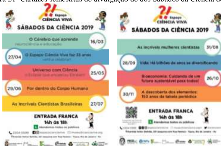
Figura 21- Cartazes semestrais de divulgação de dos Sábados da Ciência de 2019