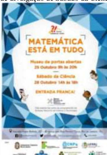
Figura 19– Cartaz de divulgação de Sábado da Ciência (outubro de 2017)