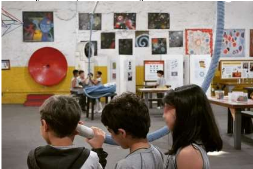
Figura 4 – Grupos de alunos interagindo em oficina sobre sons