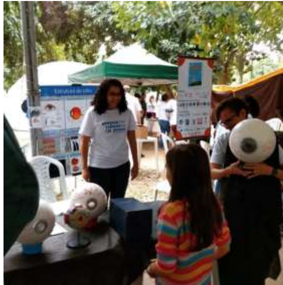
Figura 9 – Participação do ECV no evento "Domingo com Ciência", na Quinta da Boa Vista (Rio de Janeiro)