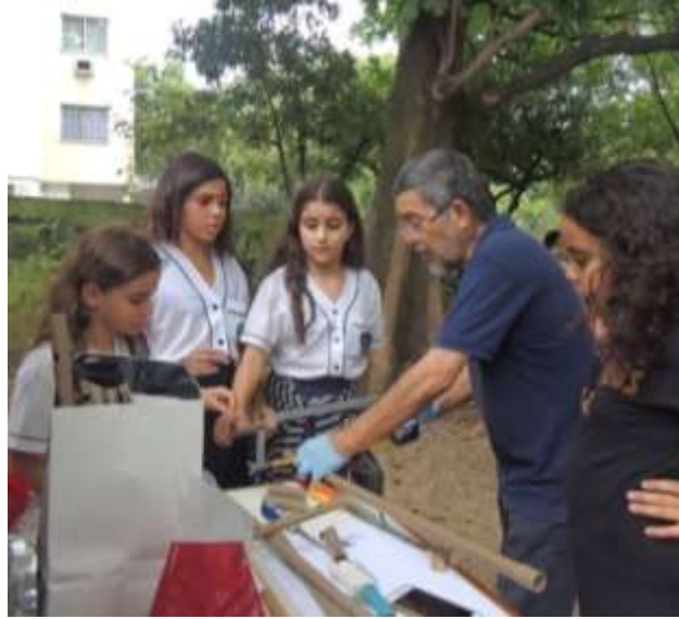
Figura 25 – Visitantes participando da Oficina “Fabricando instrumentos musicais”