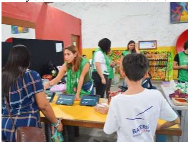
Figura 29 – Mediadora e visitantes em atividade no ECV