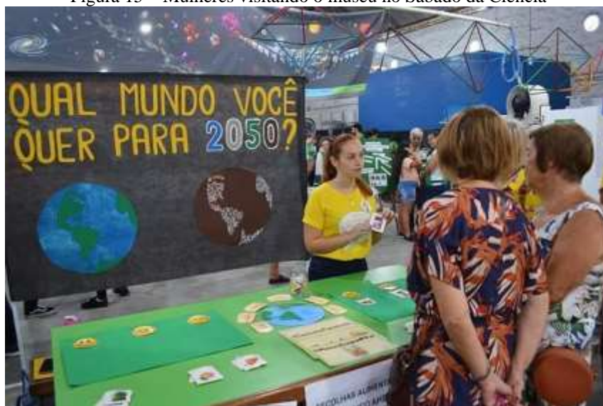
Figura 15 – Mulheres visitando o museu no Sábado da Ciência