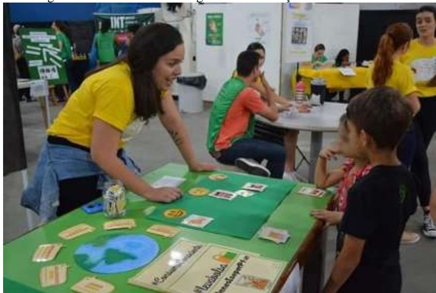
Figura 28 – Mediadora interagindo com crianças durante atividade