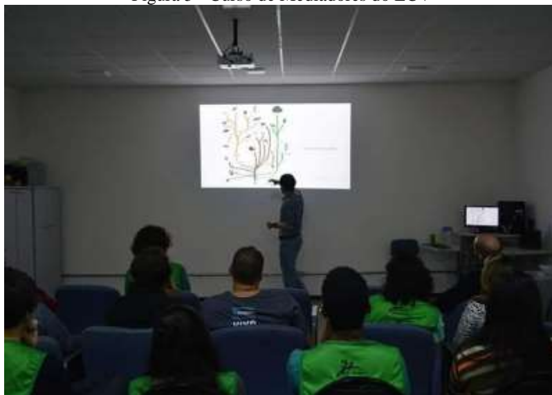
Figura 5 - Curso de Mediadores do ECV