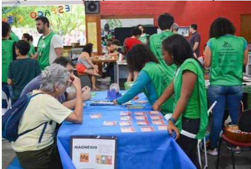
Figura 16 – Adultos participando de oficina sobre elementos químicos