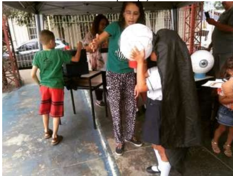
Figura 13– Aluna e mediadora em oficina durante participação do ECV em evento no Colégio Pedro II