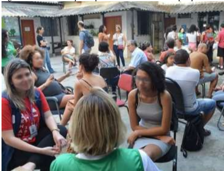
Figura 26 – Visitantes participando da “Conversa com pesquisadores”