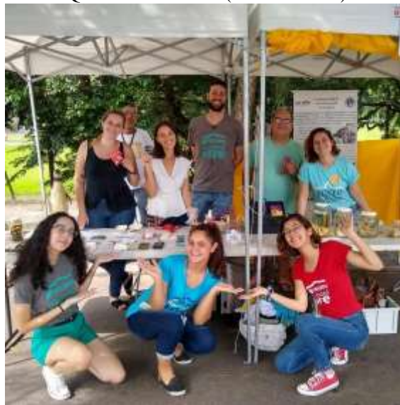
Figura 10 – Participação do ECV no evento "Encontro com a Comunidade sobre educação Sexual", na Quinta da Boa Vista (Rio de Janeiro)