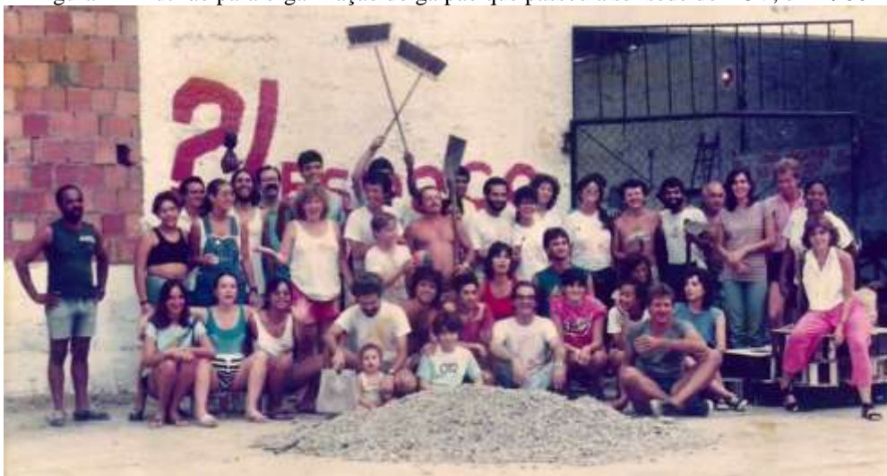
Figura 1 - Mutirão para organização do galpão que passou a ser sede do ECV, em 1986

Em 1987, o ECV passou a ter como sede um galpão (área cedida pelo governo do estado, que à época administrava o Metrô Rio) no bairro Tijuca, local onde funciona até hoje, e assim foi fundado o primeiro museu interativo de Ciências do estado do Rio de Janeiro e o segundo do Brasil (Figura 1).