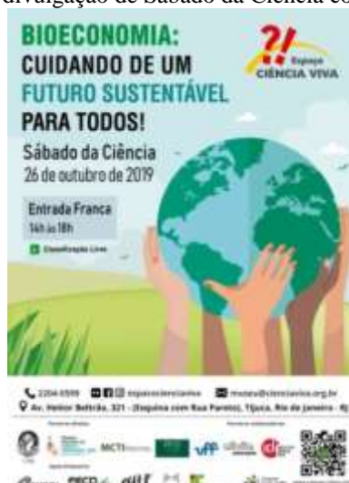
Figura 22 – Cartaz de divulgação de Sábado da Ciência com o tema Bioeconomia