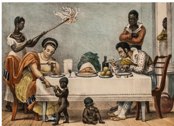
O jantar no Brasil

In: DEBRET, Jean-Baptiste. Viagem Pitoresca e Histórica ao Brasil . Tradução e nota de Sérgio Millet. Belo Horizonte: Ed: Itatiaia, 1989.