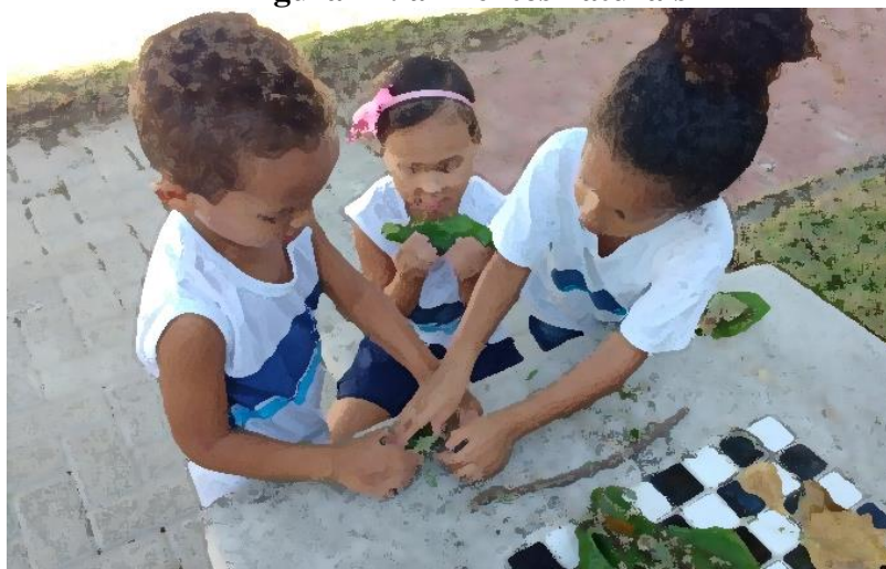
Figura 14: alimentos naturais