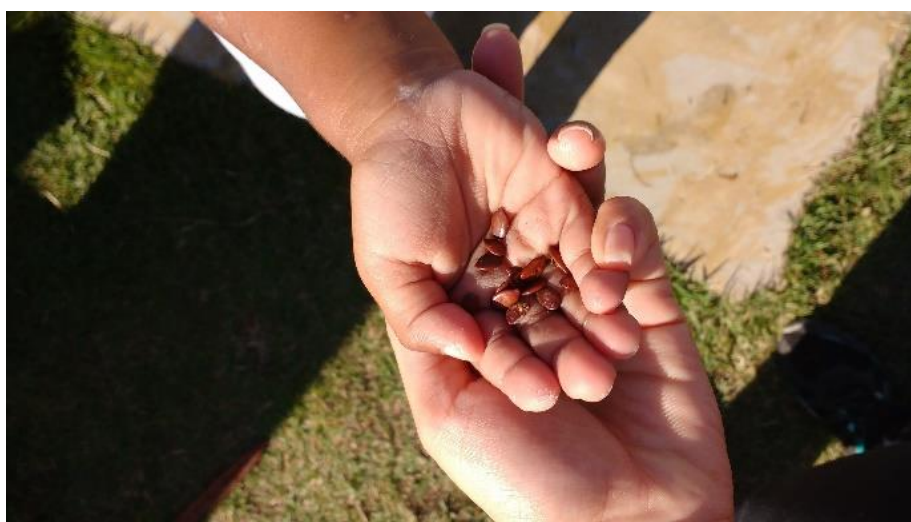
Figura 04: coisas desimportantes