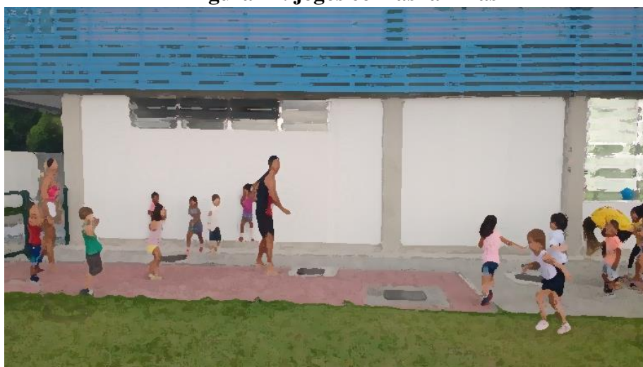
Figura 11: jogos com as famílias