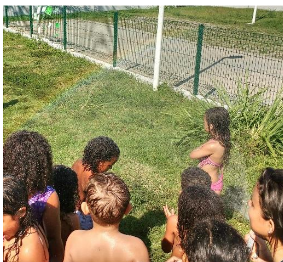
Figura 19: encontro do sol e água

Nunca foi só um banho de mangueira. Era a garantia de um direito; a realização de um plano esperado por duas estações; era o frescor dos dias ensolarados; era a ideia de economizar água da torneira para gastar na mangueira; era cantoria e diversão; era sopro forte para fazer a nuvem passar depressa e liberar o sol para aquecer nossos corpos; era entender a importância da água brincando com ela, percebendo o quanto ela pode ser especial e gerar momentos inesquecíveis; era sobre o encontro do sol e da água que nos fez descobrir o arco-íris (figura 19). Era muito mais que uma rotina. Era um cotidiano atravessado pela Psicomotricidade que, hoje, posso perceber.