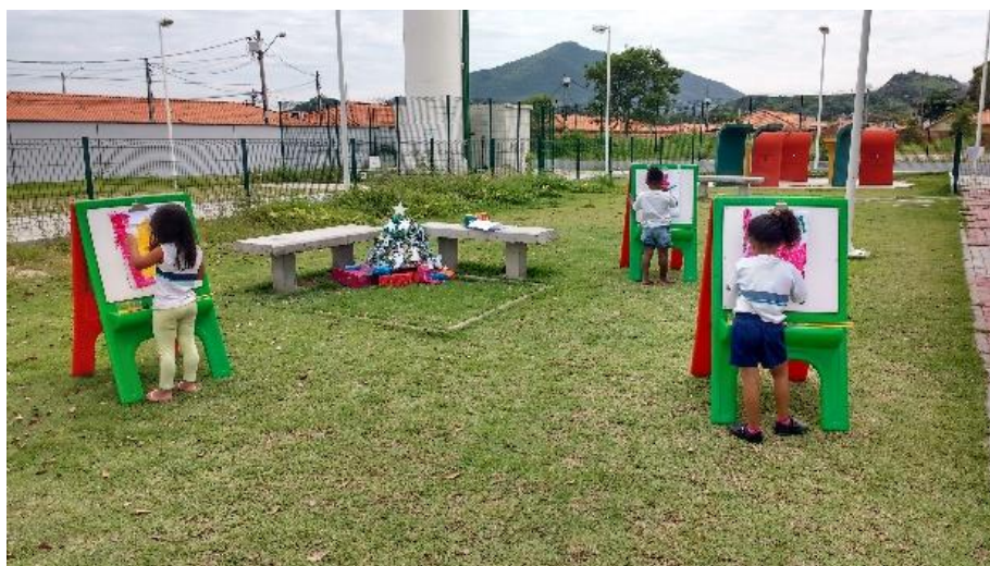
Figura 05: experiências estéticas