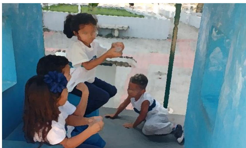
Figuras 15 e 16: videogame de pedra

Nada como chegar em casa e sentar para jogar um videogame (figuras 15 e 16). Piorski (2016, p. 92) nos diz que “Quanto mais simples a casa de brincar, os esconderijos de materiais naturais, maiores a complexidade e os enraizamentos imaginários.”.