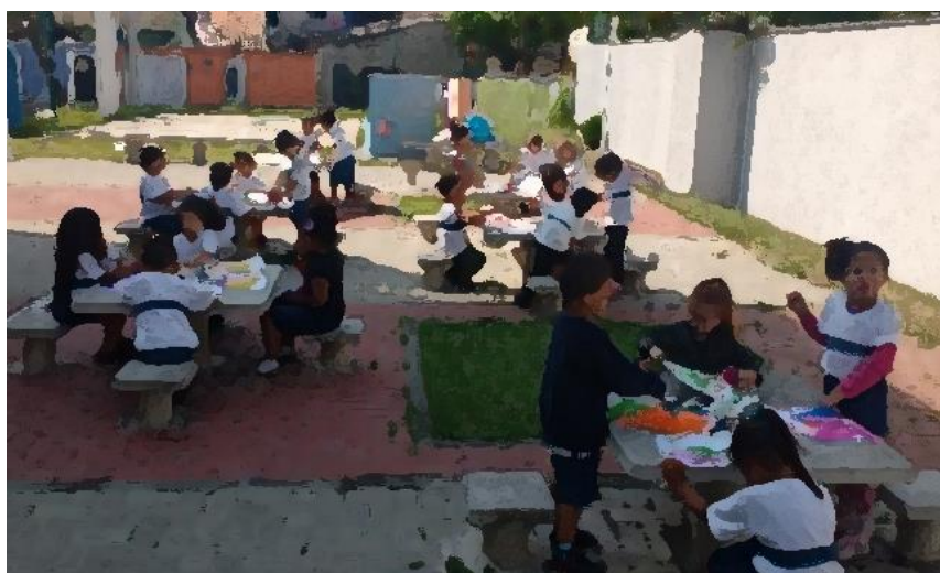
Figura 06: propostas dirigidas desemparedadas

Descobrimos que aquele papo de que nos pátios não dá para controlar as crianças cai por terra (literalmente!) quando as crianças aprendem a se regular e, principalmente, quando a proposta é interessante para elas (figura 06).