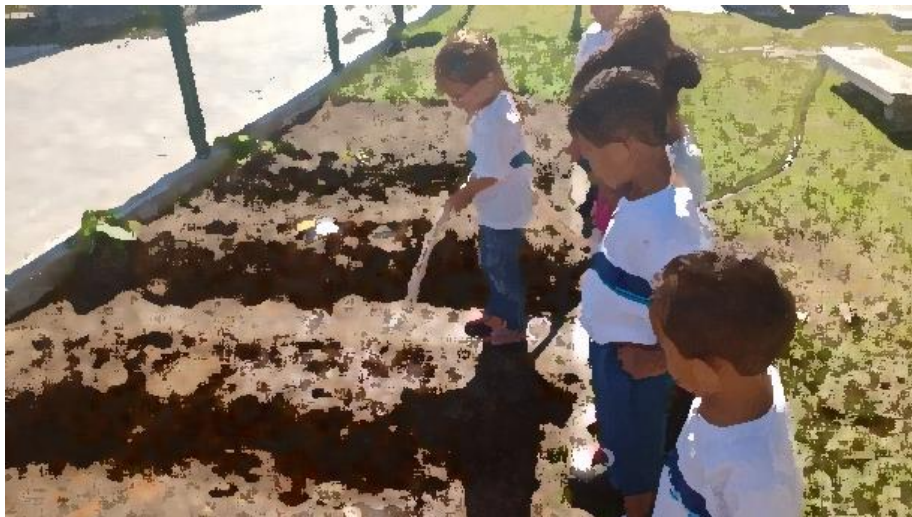
Figura 28: plantio