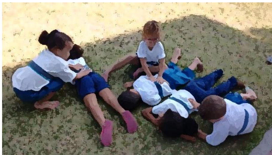
Figura 01: Toques que falam

Descobrimos que nos pátios surgiam perguntas que davam o que falar e também descobrimos que alguns silêncios preenchidos por toques falam muito mais que palavras (figura 01).