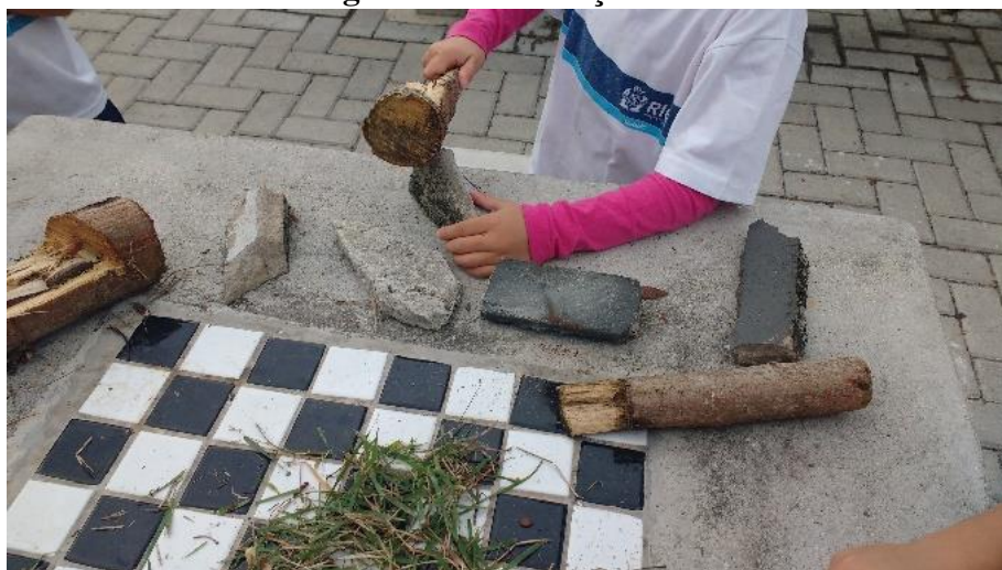
Figura 12: construções naturais