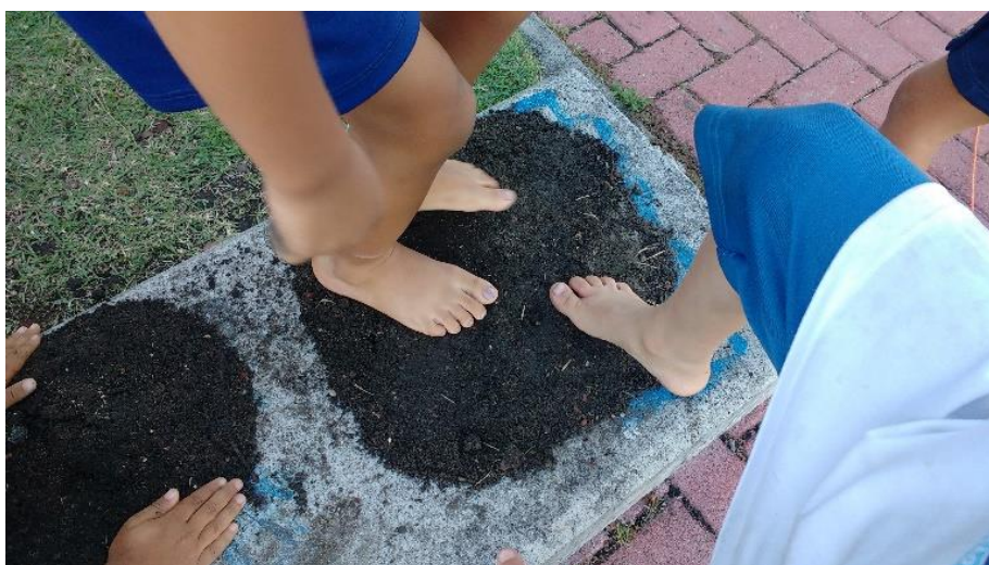
Figura 22: pés na terra

... e há aqueles para os quais as mãos não bastam (figura 22).