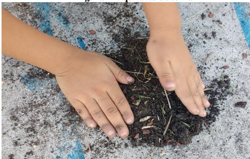
Figura 21: quitutes de terra