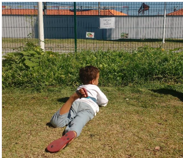
Figura 31: natureza como antídoto para o estresse