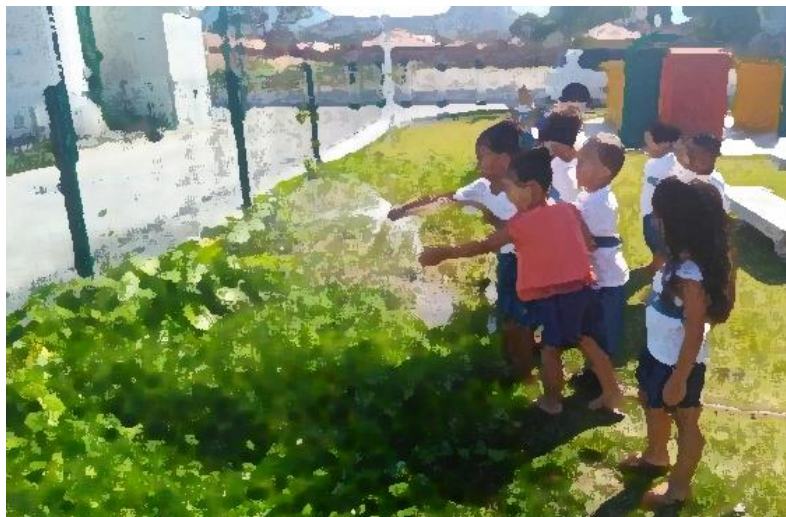
Figura 29: rega