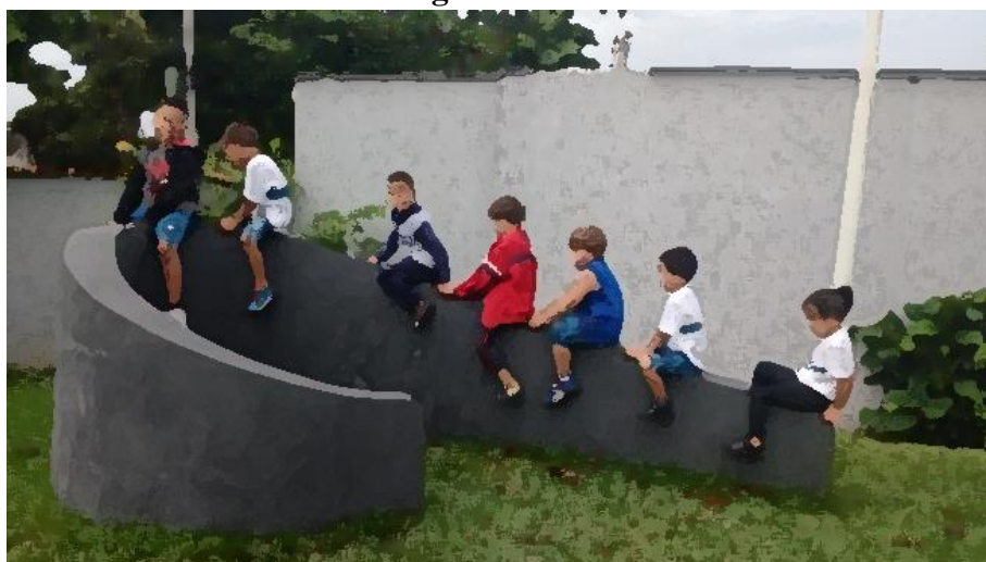
Figura 07: o muro