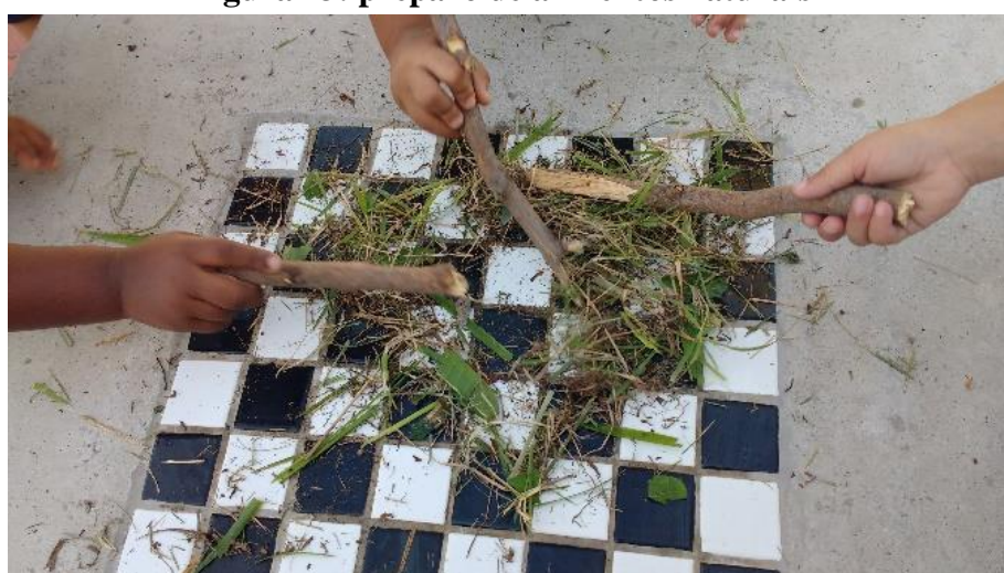
Figura 13: preparo de alimentos naturais

O que para uns era instrumento para fazer fogo, para outros eram os mais deliciosos ingredientes do cardápio de um restaurante repleto de cozinheiros renomados e clientes famintos. Na cozinha, a comida era preparada a muitas mãos (figura 13). No salão, todos muito bem servidos (figura 14).