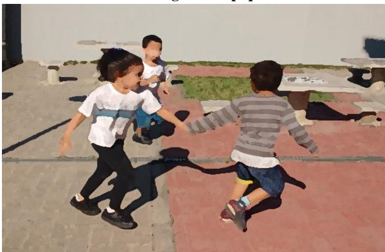
Figura 09: pique