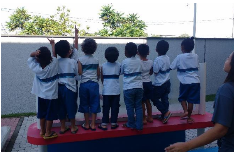
Figura 10: o pássaro

... E, em um piscar de olhos, de repente, mais um pássaro (figura 10)!