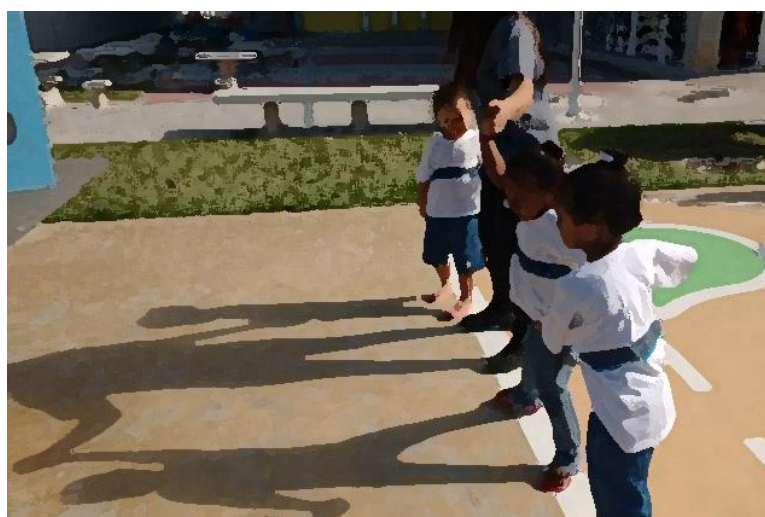
Figura 08: luz e sombras