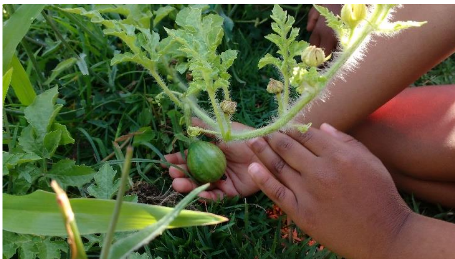
Figura 30: o broto