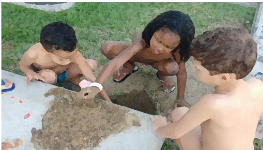
Figura 20: tesouros na terra