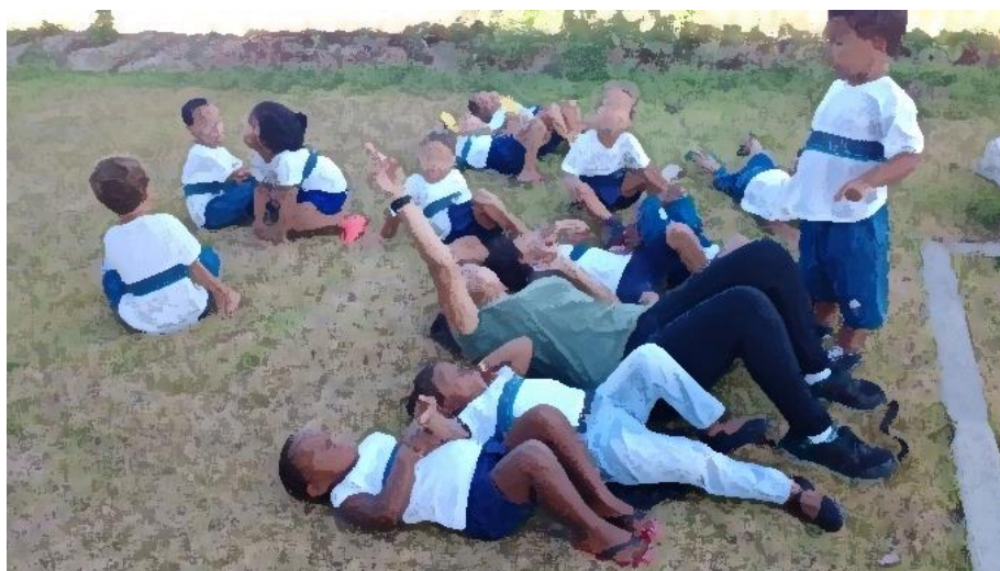
Figura 03: miudezas do céu

Descobrimos coisinhas miúdas no céu (figura 03).