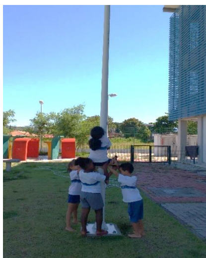
Figura 17: escalar o poste