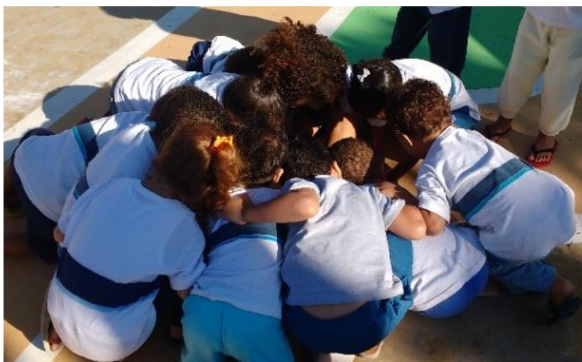
Figura 02: miudezas da terra