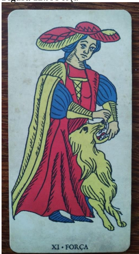
Figura 12: A Força