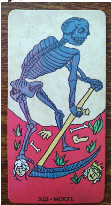
Figura 14: A Morte