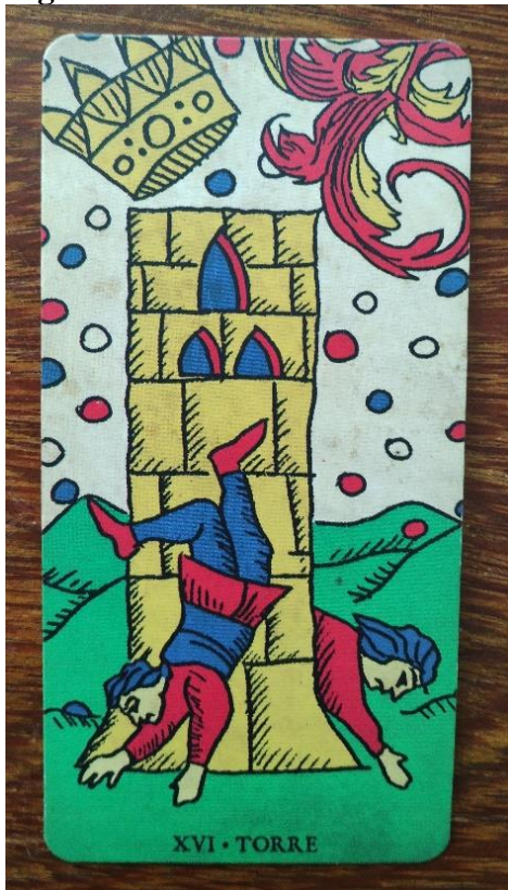
Figura 17: A Torre