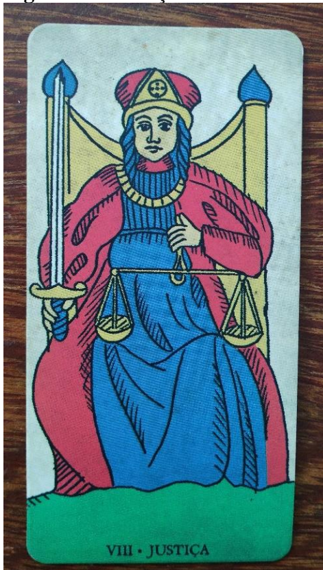
Figura 9: A Justiça