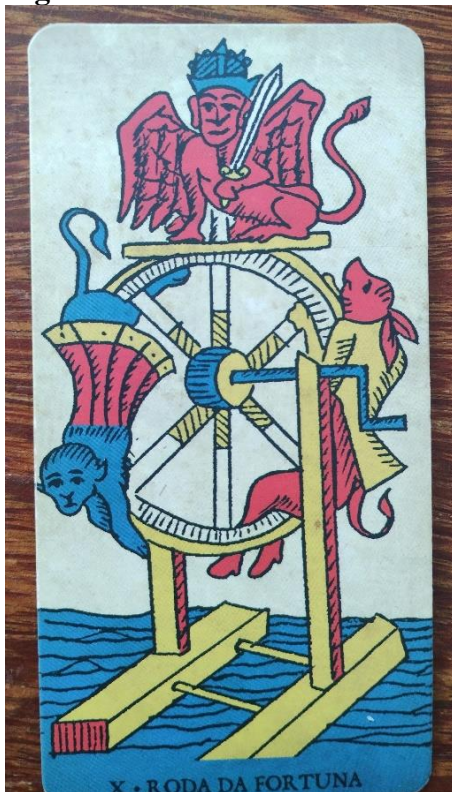
Figura 11: A Roda da Fortuna