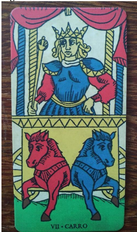
Figura 8: O Carro