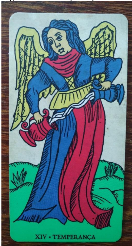
Figura 15: A Temperança