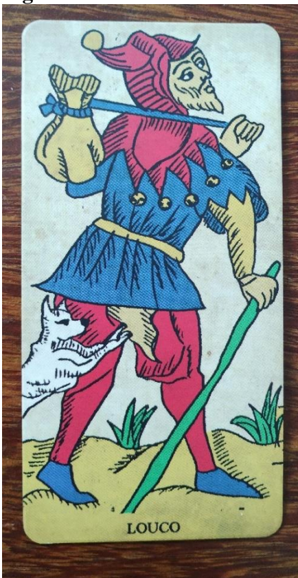
Figura 1: O Louco