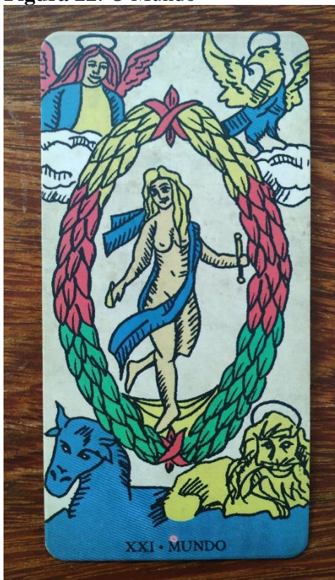
Figura 22: O Mundo