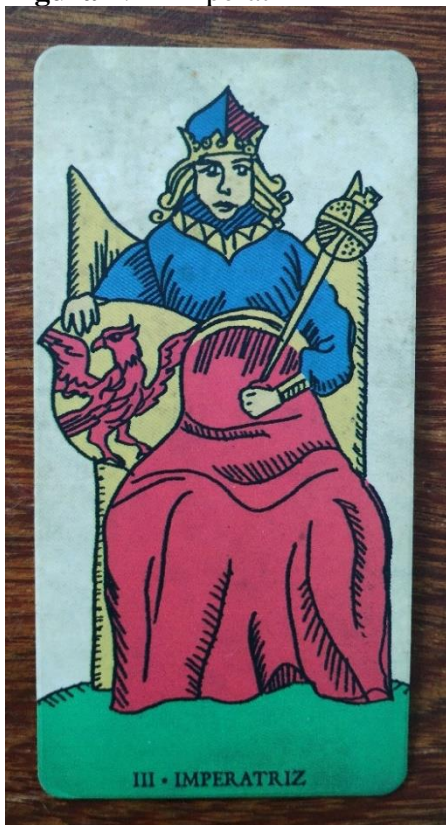
Figura 4: A Imperatriz