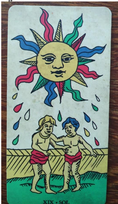
Figura 20: O Sol