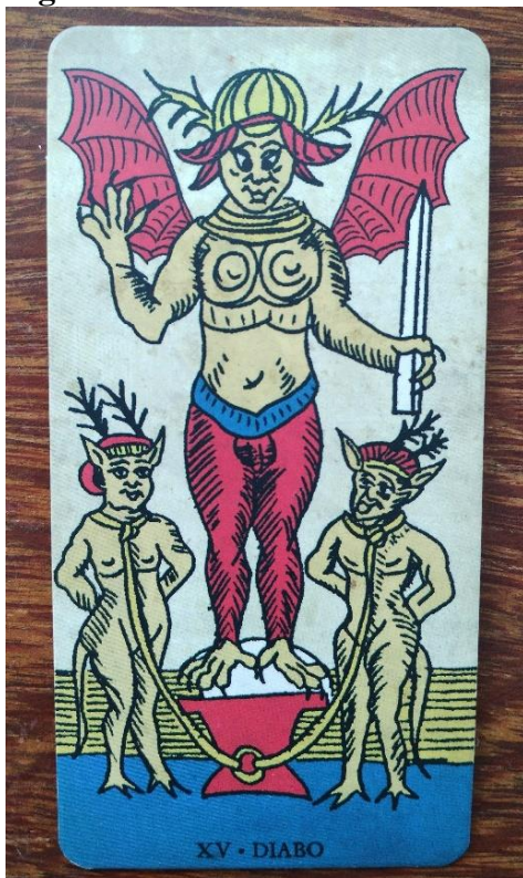
Figura 16: O Diabo