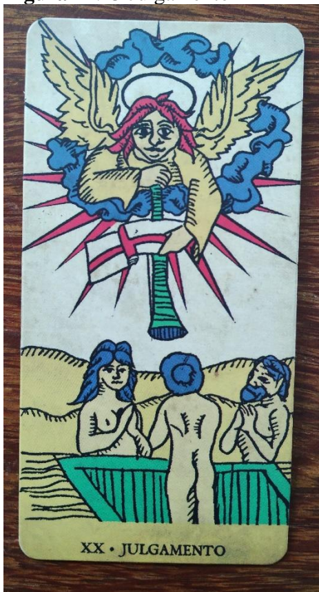
Figura 21: O Julgamento