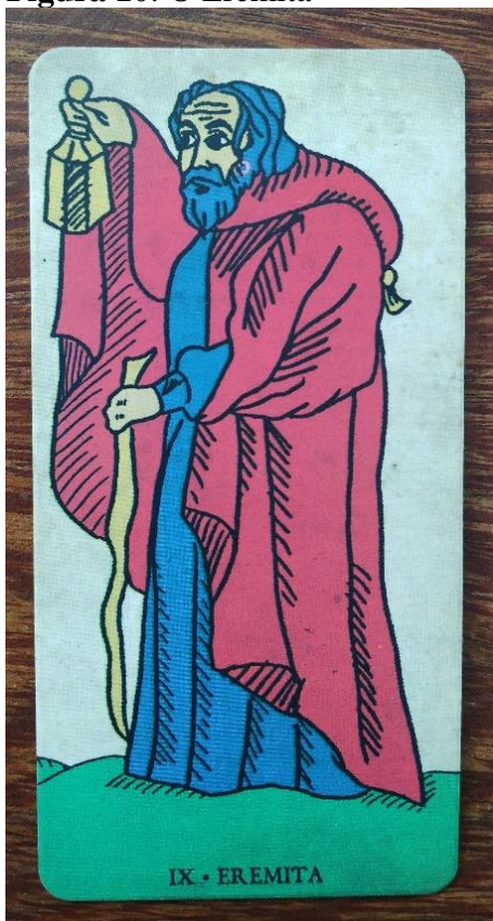
Figura 10: O Eremita