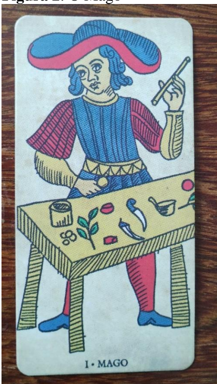
Figura 2: O Mago