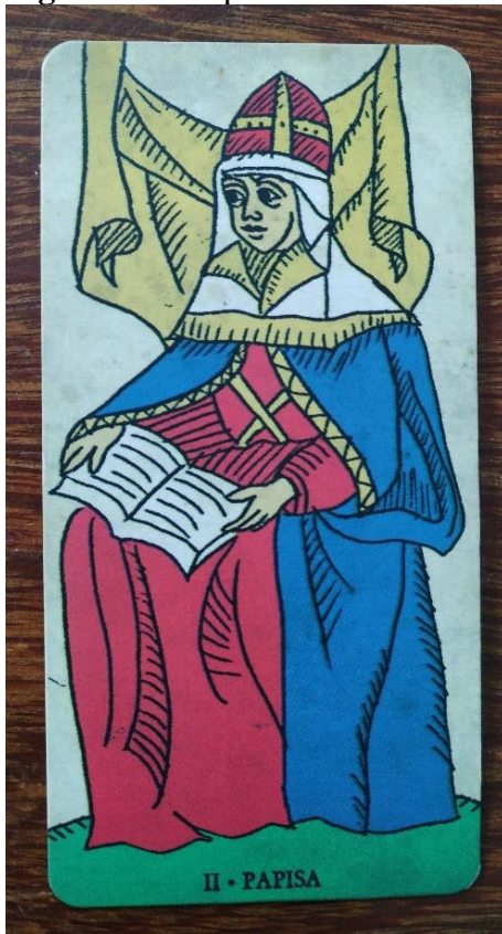
Figura 3: A Papisa