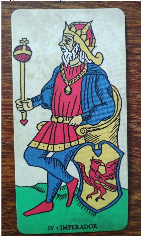
Figura 5: O Imperador