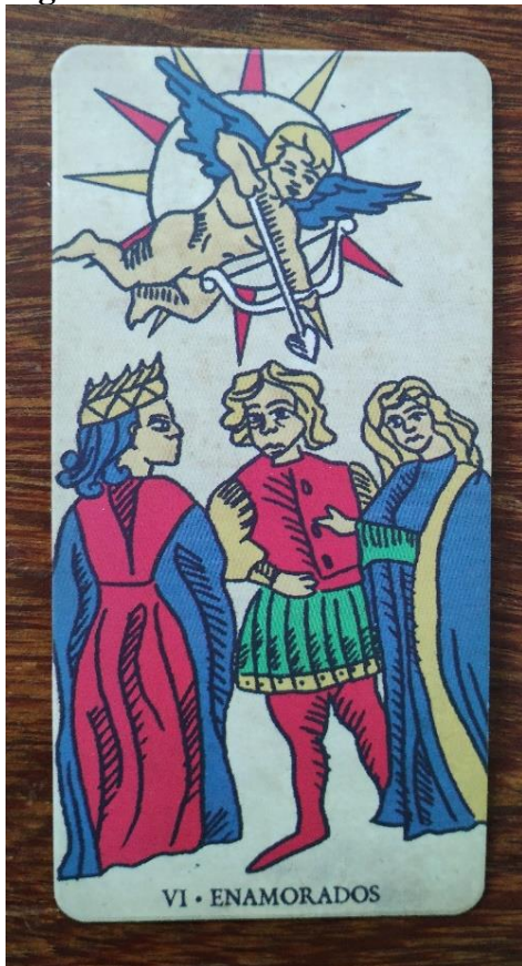
Figura 7: Os Enamorados