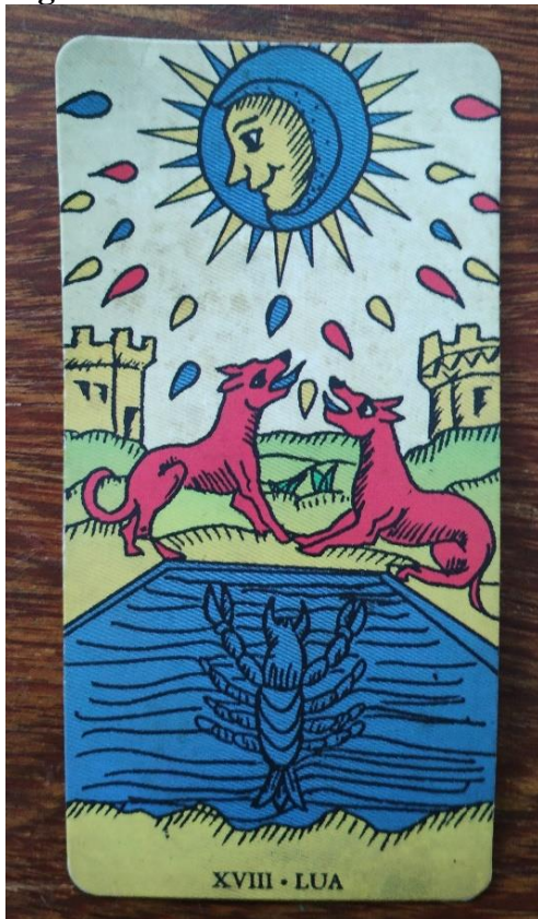
Figura 19: A Lua