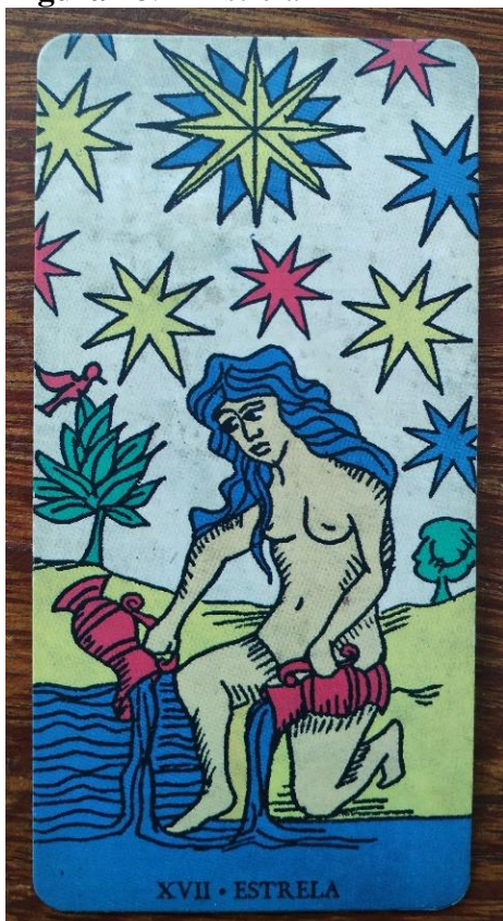
Figura 18: A Estrela