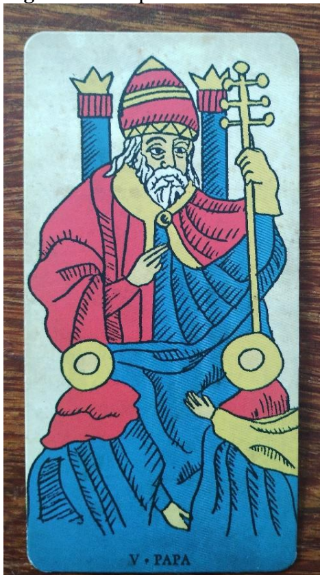
Figura 6: O Papa