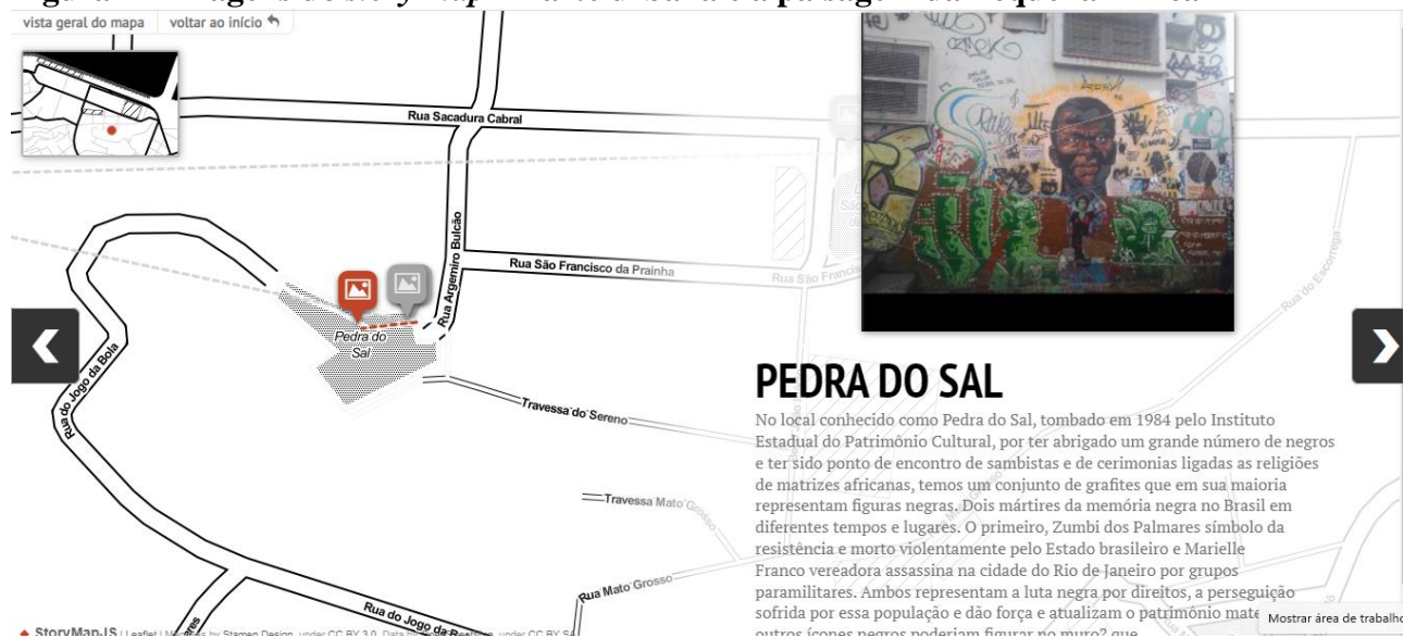
Figura 2 - Imagens do story map - A arte urbana e a paisagem da Pequena África