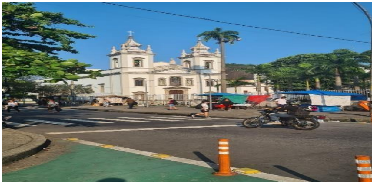
Imagem 15 – Igreja de São Francisco Xavier do Engenho Velho

Sigo na rua e a arborização continua muito próxima, os prédios colados uns nos outros e finalmente chego na praça. Antes de atravessar, vejo o rio, esse rio passa por baixo da escola onde trabalho, ele foi canalizado para isso. A praça tem uma faixa verde pintada na rua que segue no decorrer da rua São Francisco Xavier, essa faixa deixou a calçada mais larga, e os alunos da escola Municipal Orsina da Fonseca colaboraram com ideias para o desenvolvimento dela junto da CET RIO.