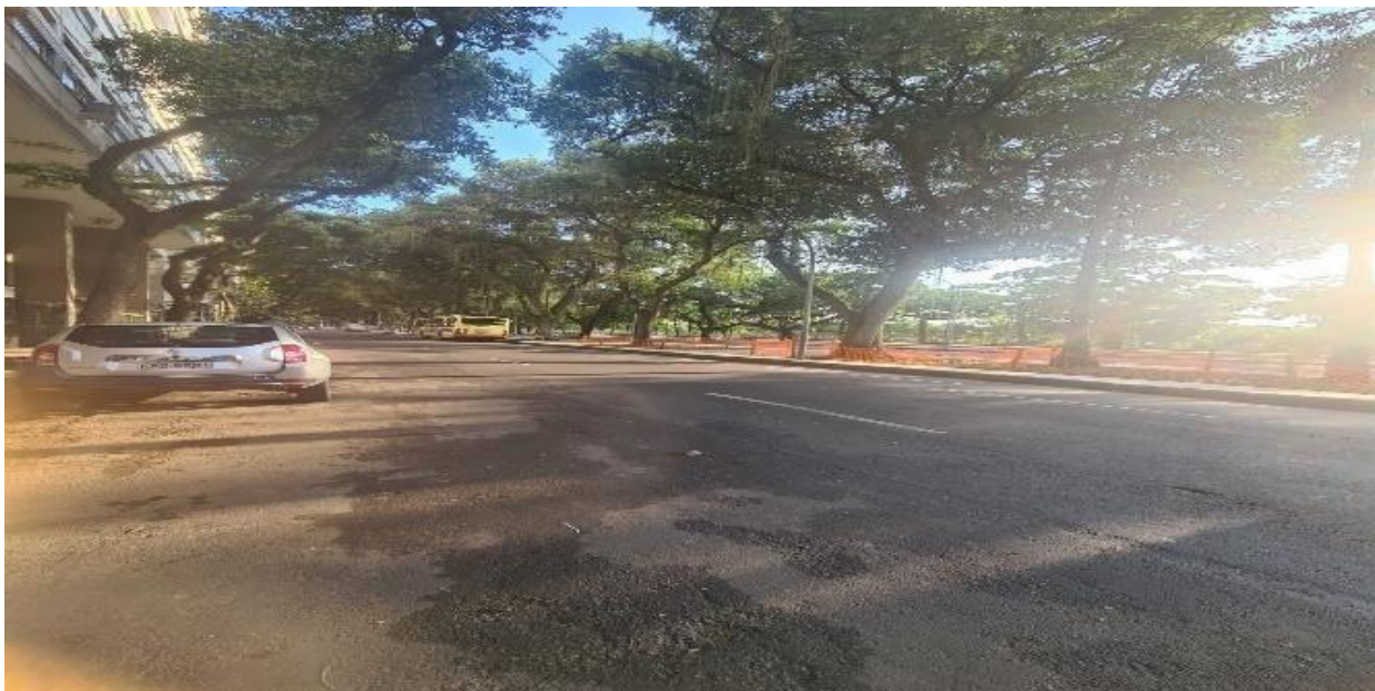
Imagem 10 – Avenida Augusto Severo

Na rua do Catete, passo por prédios bem altos, e logo depois encontro o Palácio do Catete e diversos edifícios antigos e baixos me acompanham. As calçadas intercalam entre estreitas e largas, e as árvores são espaçadas entre elas até chegar à Glória. Nesse ponto, o Aterro do Flamengo e sua vegetação colidem com o bairro e o verde sombreia as avenidas, criando um túnel verde onde os raios de luz tentam passar e muitas vezes fazendo o asfalto brilharem refletir nos vidros de garrafas de cerveja quebradas. Essas garrafas são frequentemente descartadas na rua, sem serem reutilizadas ou recicladas pelas empresas que as vendem e muitas vezes navalham a pele e os pneus das bicicletas.