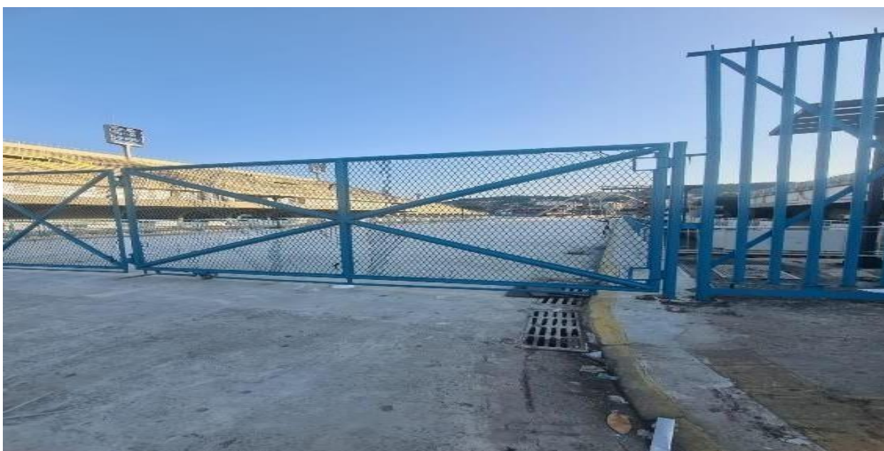
Imagem 13 – Sambódromo

Aproveito que os carros pretos pararam o trânsito e sigo com eles passando por baixo do elevador que segue em direção ao túnel Santa Barbara. Leio a placa que anuncia: “O maior carnaval do mundo”. O sambódromo costuma evocar memórias de carnavais passados; a grande avenida é mágica mesmo sem a folia. A luz do sol ilumina a avenida, revelando todo o brilho e a magia de fevereiro, mesmo que por apenas alguns segundos.