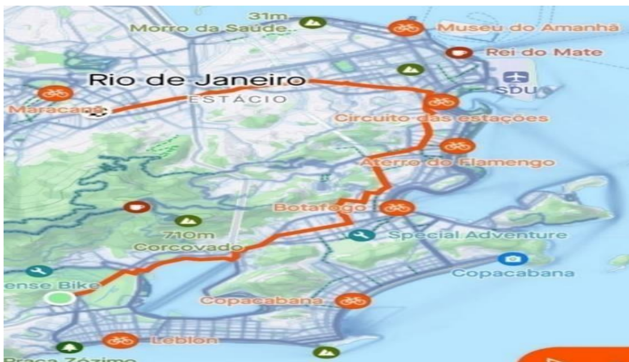
Imagem 2 - O trajeto

Esse trabalho sobre o trajeto do estudante seria elaborado em sala de aula, onde eu apresentaria o percurso da minha residência até a escola onde trabalho, desenhando e narrando esse trajeto e descrevendo as paisagens no percurso tão diverso entre a zona sul e a zona norte da cidade do Rio de Janeiro.