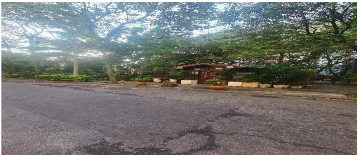
Imagem 8 – Praça Radial Sul