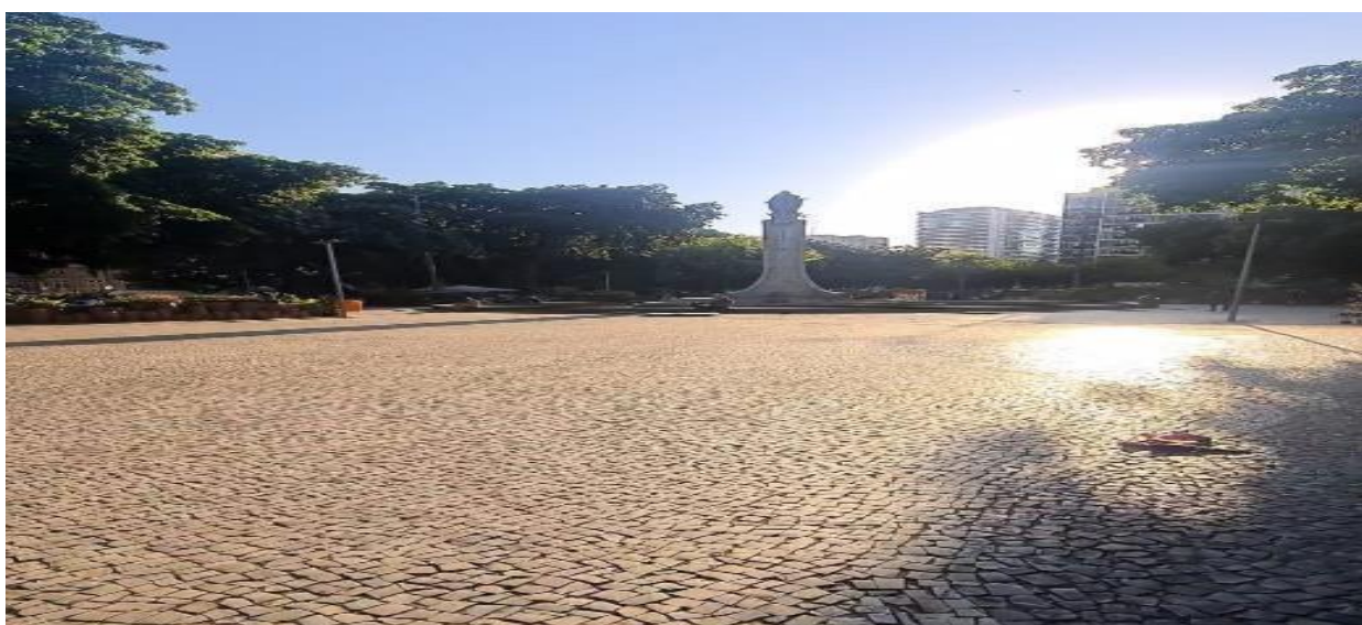
Imagem 9 – Largo do Machado

Entre Árvores e flores, avisto turistas, vendedores, pessoas esperando por seus trabalhos, moradores deitados e se comunicando, pessoas deixando estação do metrô e a luz do sol brilhando mais refletindo sobre as vidraças de um novo espigão que transparece fazer com que a fonte no centro da praça se torne um local de encontros e desencontros no meio do trânsito urbano um oásis para construção de relações na cidade.