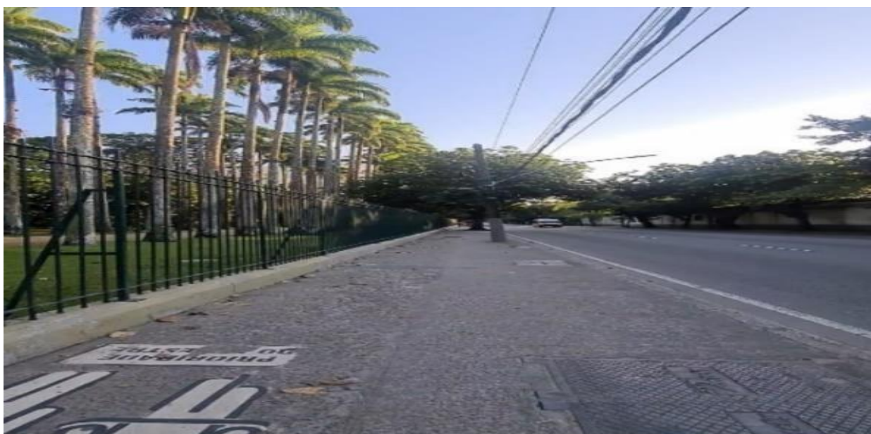
Imagem 4 – Jardim Botânico

O verde me acompanha durante todo o percurso e devido ao efeito de borda do parque do Jardim Botânico, a temperatura cai às 6 da manhã, e o frio acerta o meu corpo e avisto o Cristo Redentor no topo do corcovado. A temperatura mais baixa se perpetua até eu deixar a frente do parque, mas não aumenta muito durante o caminho até a rua General Garzon. Isso se deve ao rio que passa, às arquiteturas baixas do jôquei clube marcadas por bustos de cavalos numa de suas entradas, e à lagoa ao fundo. Antes de chegar à Lagoa, viro à esquerda na estátua do Chacrinha, famoso apresentador da década de 50, e avisto mais um canal no meio da Avenida Lineu Paula Machado, que somando-se as grandes árvores da avenida e os jardins do prédio deixam a temperatura mais baixa.