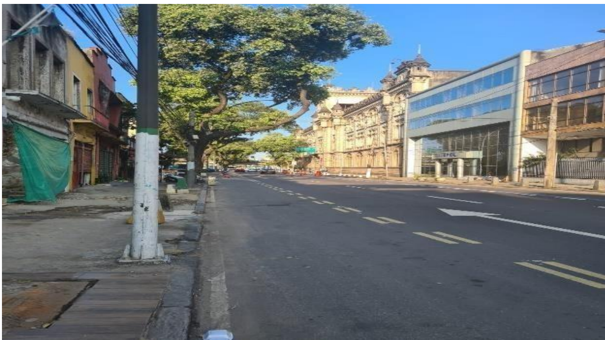
Imagem 12 – Batalhão da polícia militar