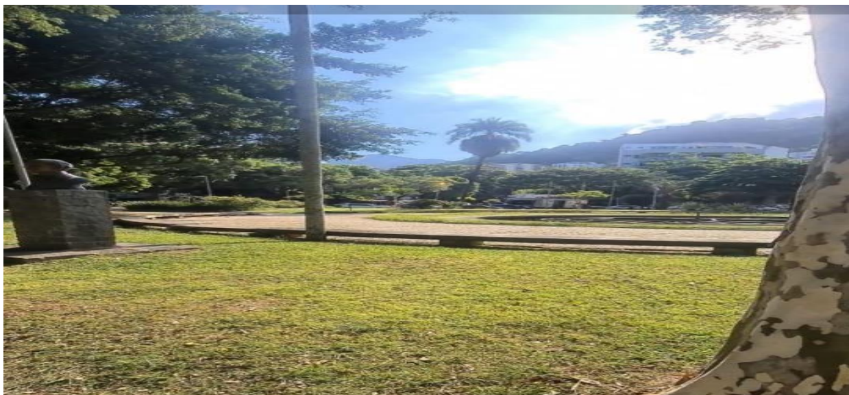
Imagem 3 – Praça Santos Dumont