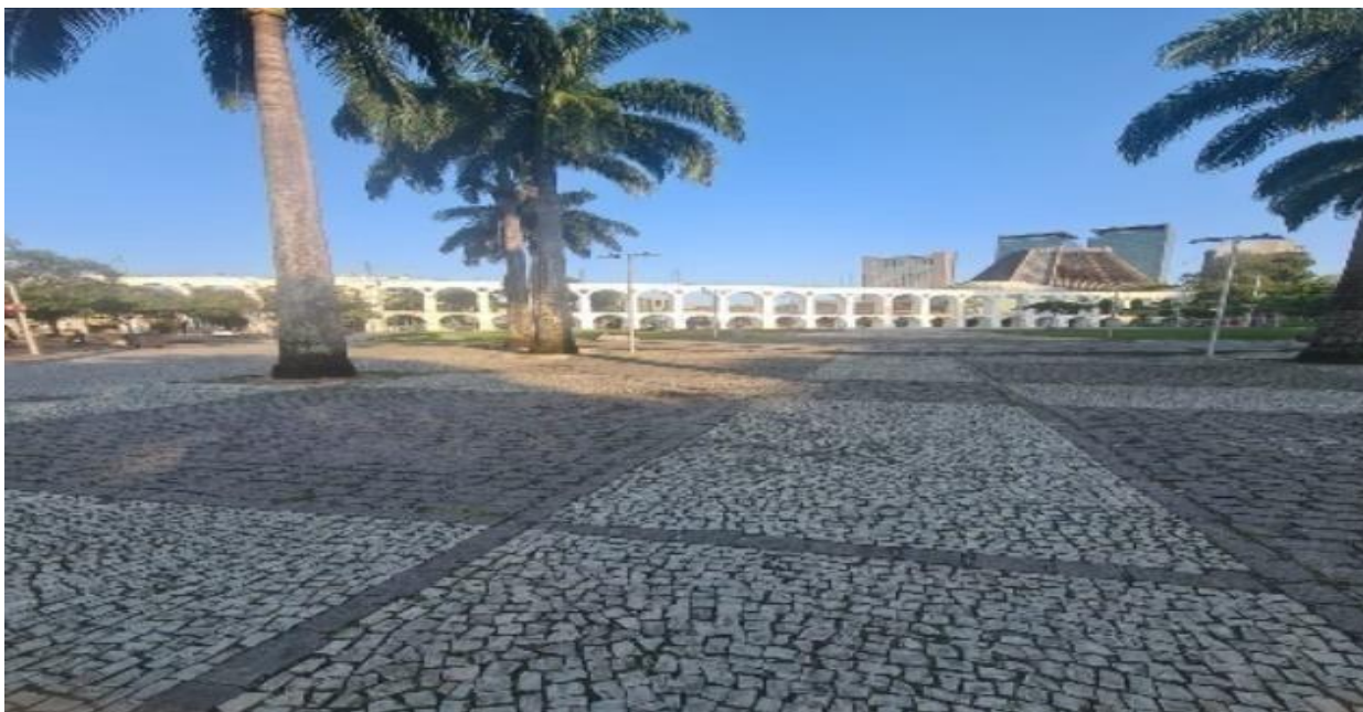
Imagem 11- Arcos da Lapa