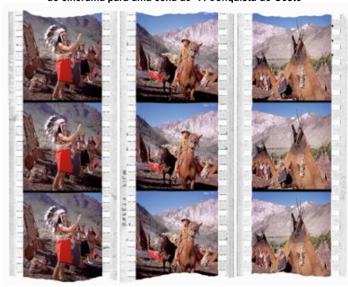
Figura 2 – Simulação das três projeções que juntas compõem o tríptico do cinerama para uma cena de “A Conquista do Oeste”

popular e aclamado, como Debbie Reynolds, estrela de Cantando na Chuva (1952) e um dos maiores nomes do cinema de faroeste, John Wayne. Contudo, talvez o que trouxe mais impacto ao espectador foi o uso do Cinerama, um sistema de projeção cinematográfica onde três projetores tradicionais de película 35mm são sincronizados para exibir a imagem uma tela longa e curva. A Conquista do Oeste foi o primeiro filme narrativo a usar essa tecnologia, já que anteriormente a tecnologia era utilizada apenas para documentários (Hardy, 1985, p. 281). Certamente, assistir a essa obra – em seu contexto de lançamento – trazia uma experiência imersiva tanto pela amplitude da projeção quanto pelo impacto visual das imagens apresentadas através dessa tecnologia. Com efeito, o filme teve uma boa recepção em seu lançamento nos Estados Unidos e, das oito indicações ao Oscar em 1964, ganhou as estatuetas de Melhor Roteiro Original (James R. Webb), Melhor Montagem (Harold F. Kress) e Melhor Som (Estúdio de som da Metro-Goldwyn-Mayer; Frank E. Milton) (Newman, 2018, p. 125).