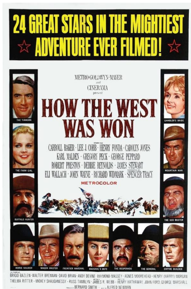
Figura 1 - Poster original do filme “A Conquista do Oeste”

Lei” ( The Outlaws ), além de um epílogo que faz referência ao estado de Los Angeles nos anos 1960, o momento presente do lançamento da obra. 6