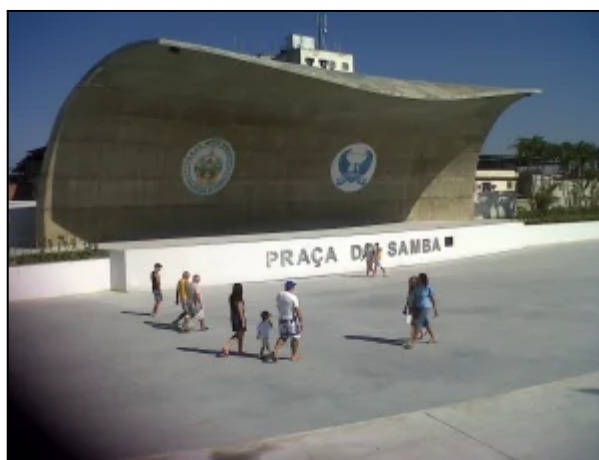
Figura 3 - Ponto 3: Praça do Samba

No terceiro ponto, os alunos podem ser direcionados ao interior do parque, em direção a praça do Samba, palco onde são realizados shows artísticos em algumas ocasiões. Nesse palco, estão presentes os emblemas das agremiações de samba Portela e Império Serrano, que têm suas sedes no bairro. Nesse contexto, o professor pode explorar a importância cultural de Madureira para os moradores da região, incluindo os antigos residentes da comunidade Vila das Torres, que exerciam sua identidade territorial por meio de suas relações com as agremiações. Além disso, o docente pode abordar o baile charme como uma expressão da identidade cultural do bairro.