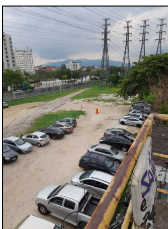
Figura 2 - Ponto 2: Passarela

Neste ponto, o professor poderá aprofundar o processo de construção do Parque Madureira e as consequências para a comunidade Vila das Torres, que foi totalmente removida para a inauguração do empreendimento. É importante que o docente destaque que o local anteriormente ocupado pela comunidade não foi transformado em parque urbano, mas sim em um estacionamento e torres elétricas. Ou seja, a remoção dos moradores esteve efetivamente ligada apenas à construção do parque, ou trata-se de um processo de segregação socioespacial e negação do direito à cidade? O docente pode incentivar os alunos a refletirem sobre essa questão e a discutirem suas percepções sobre o processo.