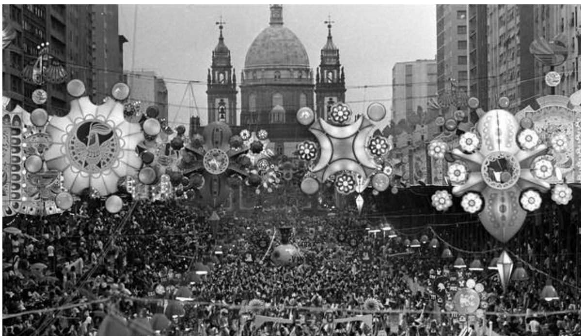
Figura 2 – Desfile da Unidos de Vila Isabel na década de 1970 na Avenida Presidente Vargas

Um momento chave para isso foi a construção da Passarela do Samba, o Sambódromo, em 1984, pelo governador do Rio de Janeiro na época, Leonel Brizola. Até aquele ano, as escolas de samba desfilaram em vários lugares no centro do Rio, começando pela Praça XI, passando pelas avenidas Rio Branco, Antônio Carlos, Presidente Vargas e Marquês de Sapucaí (Figuras 2, 3, 4 e 5), além do estádio do Clube de Regatas Vasco da Gama e do Campo de Santana. A construção do Sambódromo significou um ganho para a infraestrutura do carnaval e a economia gerada pelo fim da montagem e desmontagem de arquibancadas móveis que todos os anos acabaram falando mais alto, tornando a passarela do samba a casa do desfile principal desde então (Figura 6).