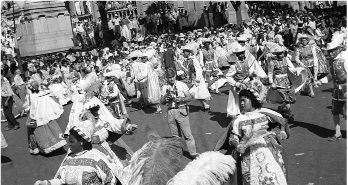
Figura 3 – Desfile da Portela na Avenida Rio Branco, na década de 1950