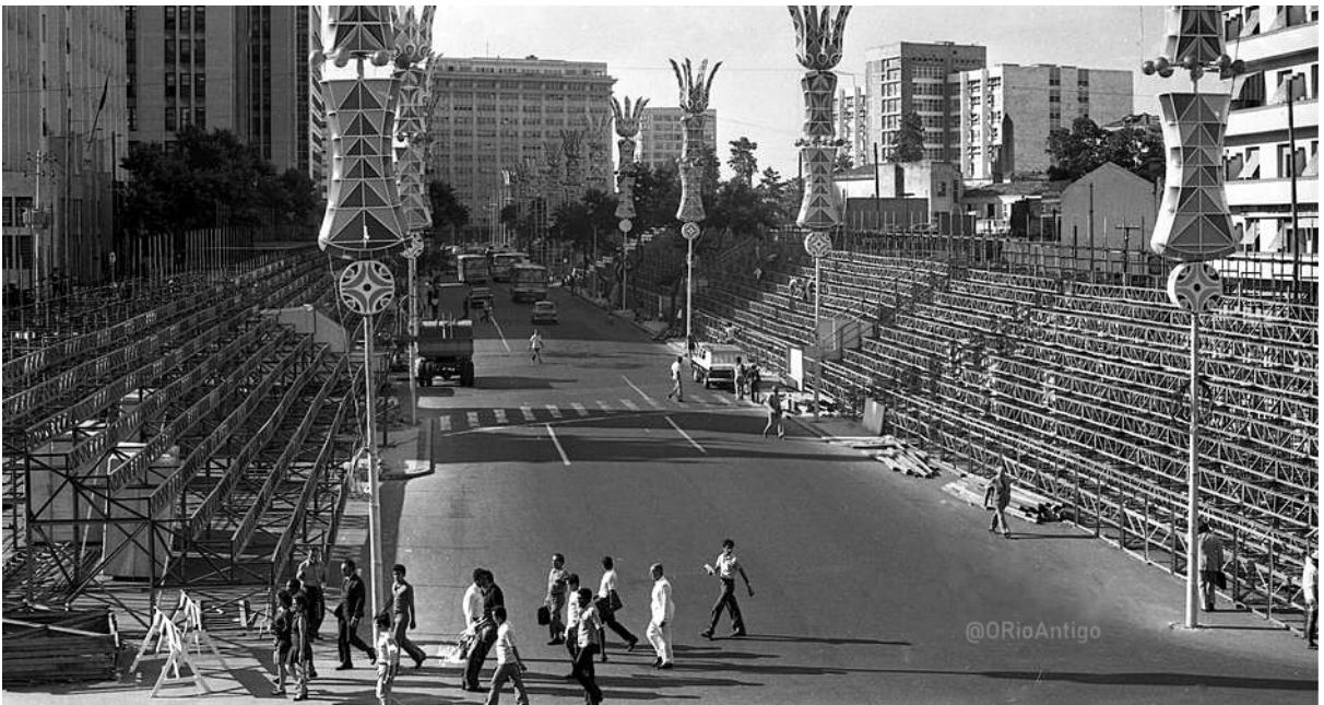
Figura 4 – Montagem das arquibancadas para o desfile das escolas de samba na Avenida Antônio Carlos, no centro do Rio, na década de 1970