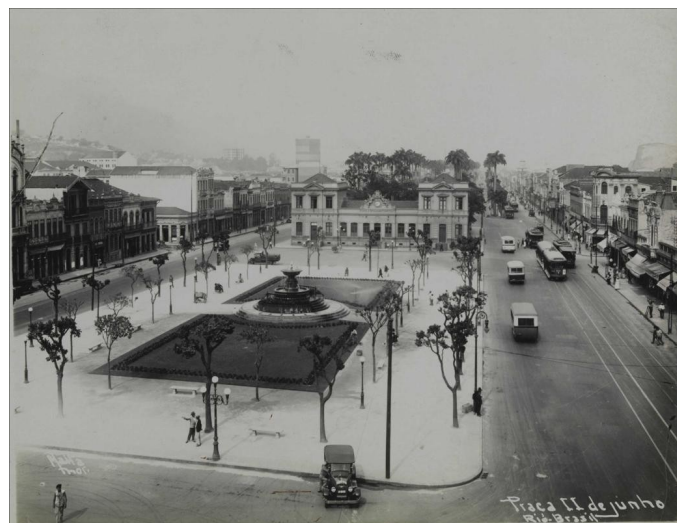
Figura 1 – Panorâmica da Praça Onze de Junho na década de 1920

O local escolhido para realização dos desfiles foi a Praça Onze de Junho, localizada na região central do Rio de Janeiro (Figura 1). Considerada “uma África em miniatura” pelo compositor Heitor dos Prazeres 16 (CABRAL, 2011, p. 76), sua escolha se deu pela concentração da população negra no local e por ter sido ali onde viveu Tia Ciata 17 , mãe de santo que se tornou uma liderança comunitária, cuja a casa era ponto de encontro de sambistas e batuqueiros. Além disso, era no bairro onde ocorriam os desfiles dos ranchos carnavalescos (NETO, 2017, p. 107).