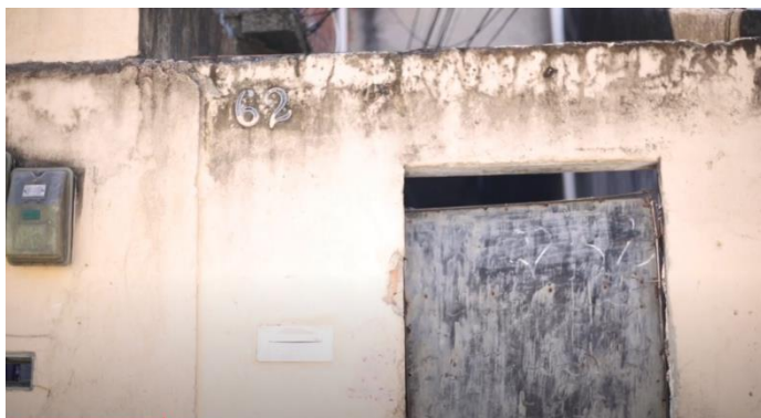
Figura 10: A frente do quintal da minha família, onde aconteceram as entrevistas.