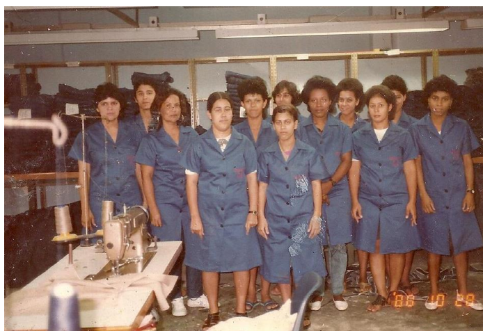
Figura 2: Mulheres trabalhadoras, sérias, na sala de costura da fábrica US King.