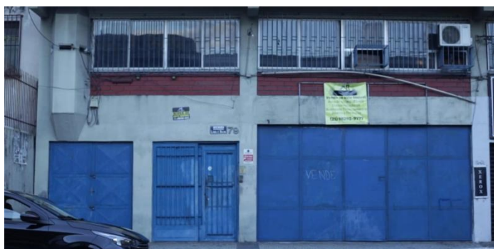
Figura 4: Foto da fachada da fábrica Kristylux (ainda em funcionamento), Duque de Caxias-RJ.