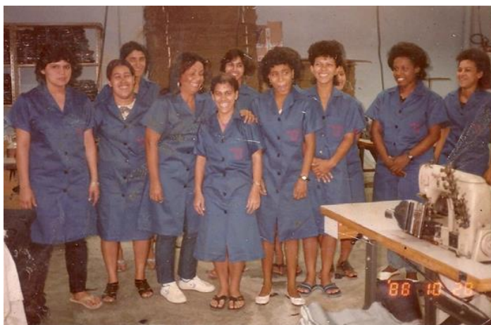
Figura 1: Mulheres trabalhadoras sorrindo e gargalhando, na sala de costura da fábrica US King.