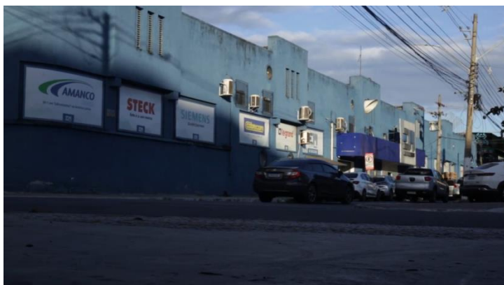
Figura 3: Foto atual da fachada da antiga Fábrica Zarkos, Duque de Caxias-RJ.