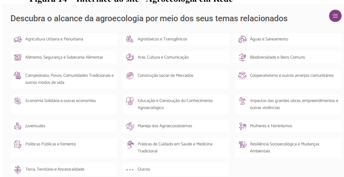
Figura 14 – Interface do site “Agroecologia em Rede”

O uso de recursos em rede, por intermédio de uma ferramenta online, tem sido largamente mobilizado por movimentos sociais populares e por entidades da sociedade civil, no sentido de capilarizar os valores da agroecologia. Assim, a experiência “agroecologia em rede” ancora-se numa base de dados alimentada por aqueles que ocupam os territórios com experiências dessa natureza.