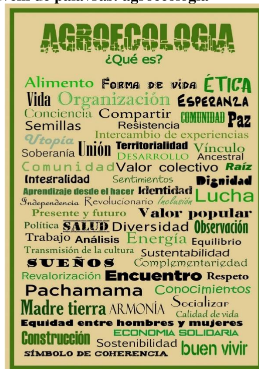
Figura 11 – Nuvem de palavras: agroecologia

Assim, desafiaria uma produção agrícola fundada na Revolução Verde, que historicamente buscou aumentar a produtividade pelo uso de sementes transgênicas e de agrotóxicos. Modelo extremamente predatório dos recursos naturais, inclusive com aumento do desmatamento, e que causa sérios danos à saúde humana.