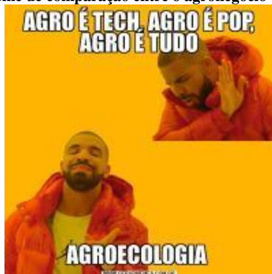
Figura 8 – Meme de comparação entre o agronegócio e a agroecologia

As charges e quadrinhos já foram tradicionalmente incorporados ao repertório de recursos pedagógicos presentes nas aulas de Sociologia. Todavia, caberia explorar melhor as potencialidades pedagógicas associadas com o uso de memes em sala de aula. Vamos apresentar alguns exemplos e possibilidades de uso em sala de aula.