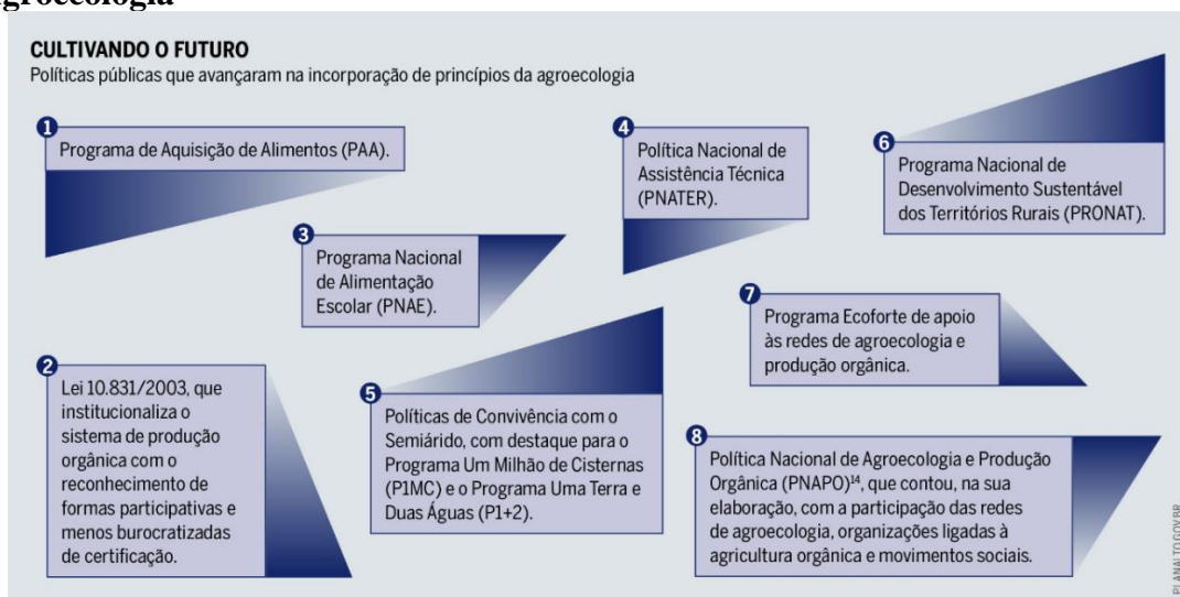
Figura 3 – Políticas públicas que avançaram na incorporação dos princípios Agroecologia