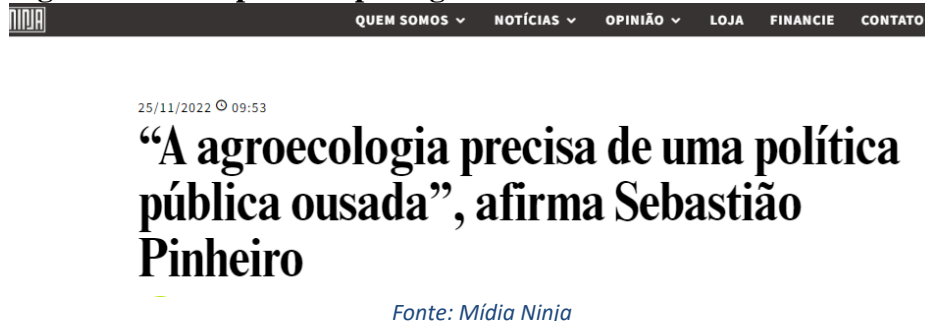
Figura 6 – Exemplo de reportagem da mídia alternativa