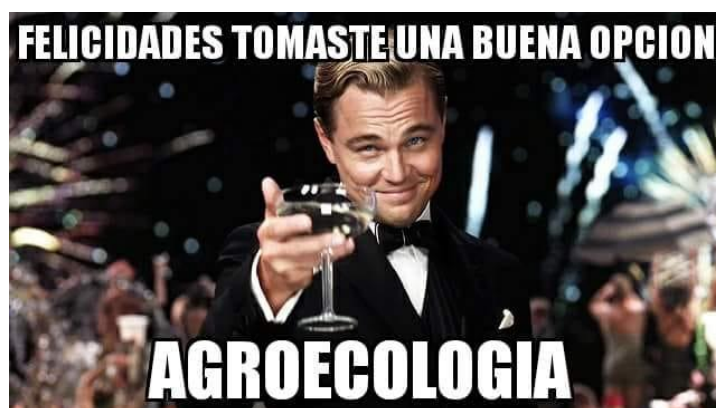
Figura 12 – Meme brinde do Di Caprio à agroecologia

A figura 11 mostra um exemplo de “nuvem de palavras” associada com o termo agroecologia. O ponto de partida da atividade consiste em propor para os estudantes em sala de aula uma “tempestade de ideias”. De tal maneira, o(a) docente pode formular uma pergunta do tipo: Que palavras você associa com agroecologia? E a partir das respostas de seus estudantes, utilizar um aplicativo como o Mentimeter Word Clouds 12 , ou outro do tipo, para sistematizar as respostas e criar uma representação visual.