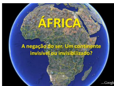
Figura 1 – Vídeo “A África que nunca vimos, ou que ninguém nos mostra”

Uma forma de iniciar o tema é provocar a turma sobre o que ela sabe sobre a África, quais são as suas ideias, referências e impressões. O vídeo abaixo, intitulado “A África que nunca vimos, ou que ninguém nos mostra”, apresenta, com muitas imagens, o continente africano de uma forma poucas vezes vista nos livros didáticos.