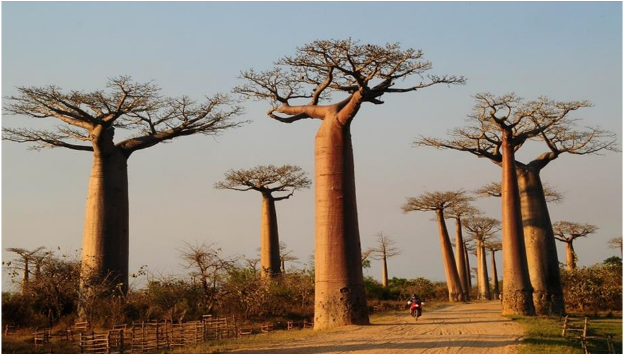
2.Baobá, árvore símbolo africano.

fonte de energia: esta árvore é um Baobá. O autor escolheu o Baobá para compor sua obra por ser uma árvore sagrada e muito importante para os africanos, pois exerce grande representatividade.