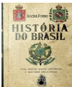
Figura 1: capa da 19ª edição do manual “História do Brasil”, de Rocha Pombo

Fonte: Laboratório de Ensino e Material Didático da USP. 2