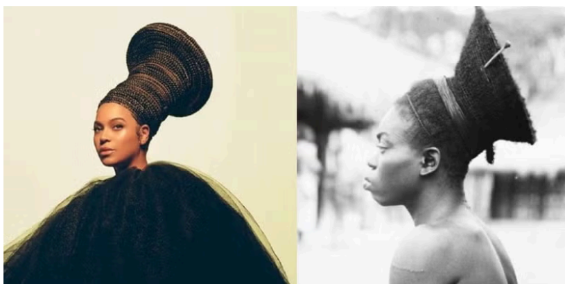
Figura 5: À esquerda, a cantora Beyoncé durante o segmento da canção Brown Skin Girl , contido em Black is King , com penteado inspirado no povo Mangbetu, da atual República Democrática do Congo, no qual, originalmente, simboliza realeza e status; à direita, uma mulher da etnia Mangbetu, com penteado similar. 5