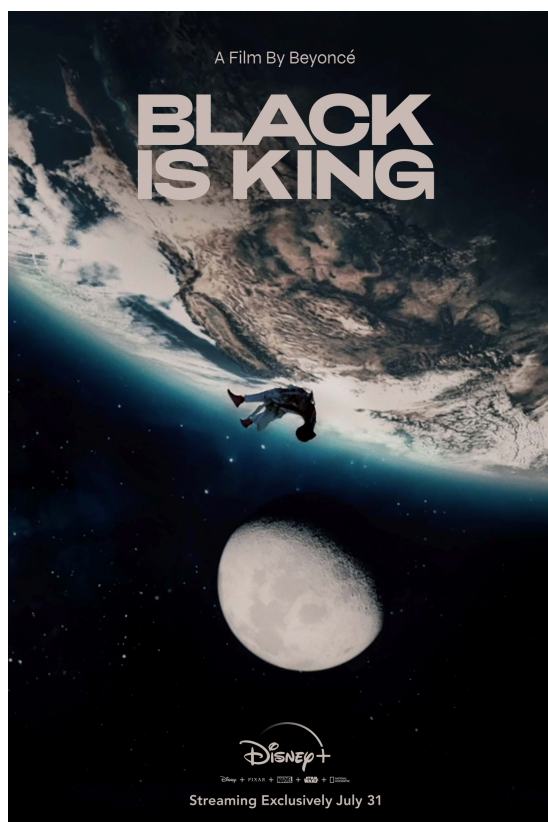
Figura 4: Pôster cinematográfico do filme Black is King .