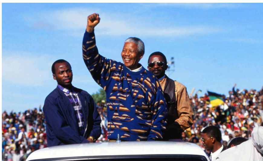
Figura 3: o ativista e ex-presidente Nelson Mandela em campanha presidencial pela África do Sul, em 1994.