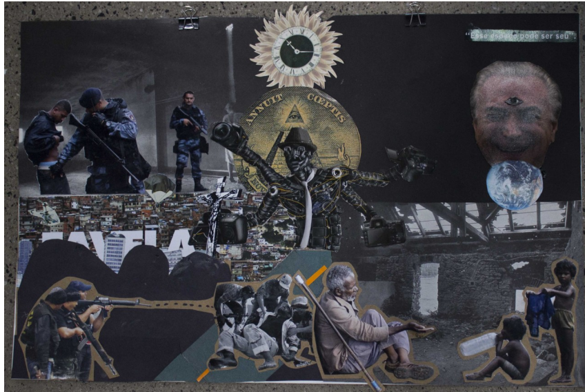
Figura 1 – Fotocolagem de aluno da oficina “Fotocolagem: remixando imagens”, 2018