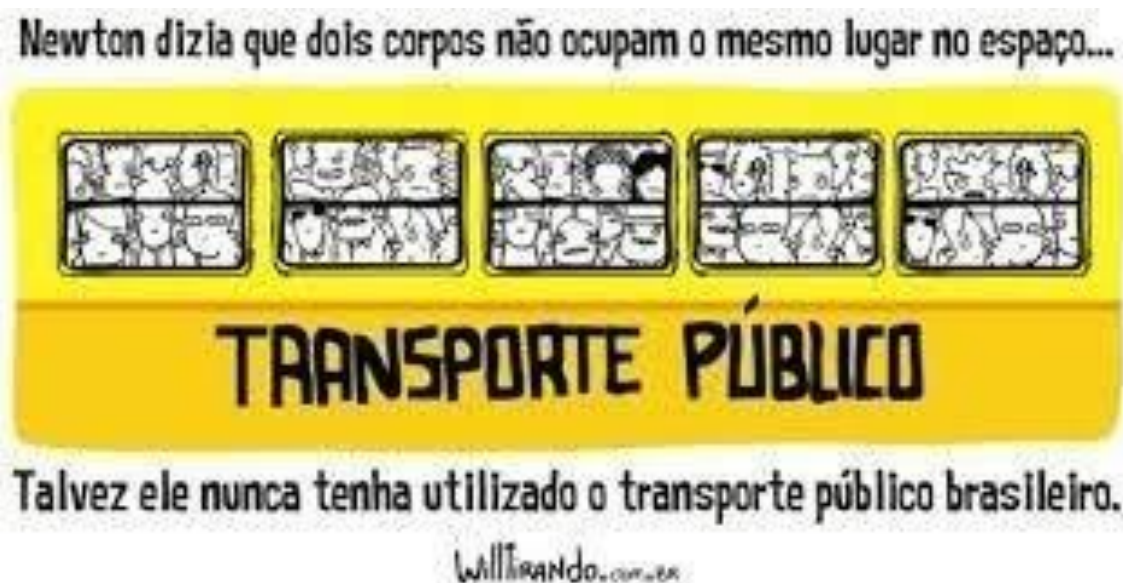
Figura 3 – Charge transporte público