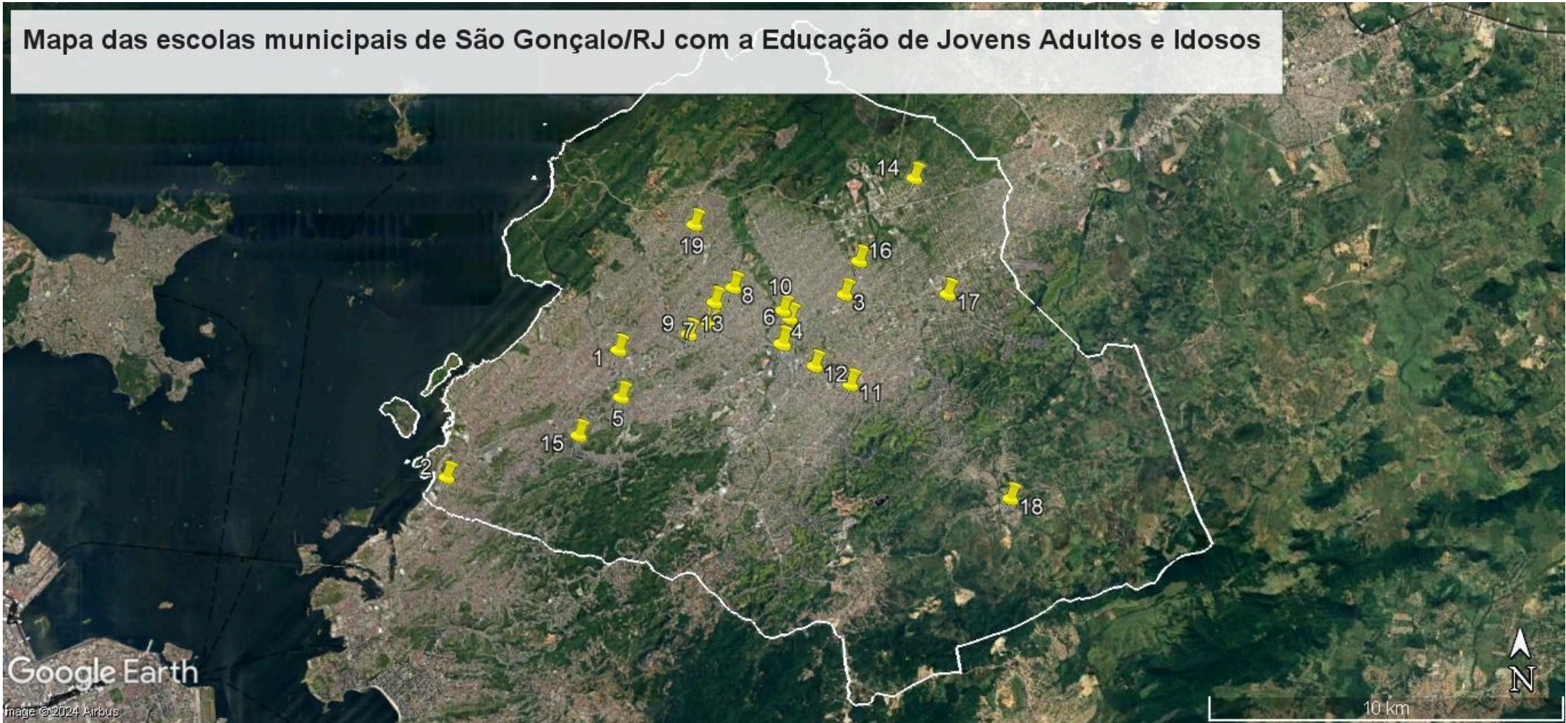
Mapa das escolas municipais de São Gonçalo/RJ com a Educação de Jovens Adultos e Idosos