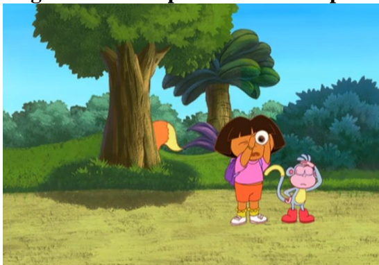
Figura 4 – Dora procurando o Raposo.

ficam em destaque nesse momento, seguindo mais uma vez a proposta de Iniciação Cartográfica. (COELHO, 2018, p.62)