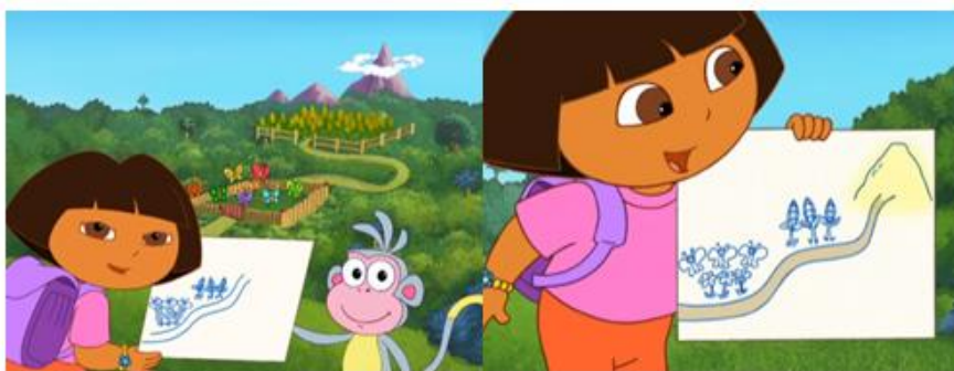
Figura 2 – Dora demonstrando o mapa que ela mesma produziu.

Em diversos momentos é possível destacar a Iniciação Cartográfica utilizando o desenho animado “Dora, a aventureira”. Para destacar mais ainda o mapa, foi escolhido o episódio “O mapa perdido”, pois o personagem mapa é sequestrado pelo pássaro pateta, que faz uma pequena confusão, achando que ele era pequeno graveto e o leva com intuito de construir seu ninho. Nesse momento, Dora se vê perdida, pois o mapa sempre a guia, então rapidamente o mapa lhe diz como fazer para ser recuperado, e Dora faz seu próprio mapa para encontrá-lo na “montanha altíssima”. Dora procura recursos em sua mochila para desenhar os caminhos que precisa percorrer para chegar até o mapa, sendo estes: o Jardim de borboletas, o Campo de milho, e por fim, a montanha altíssima, como ilustrado nas Figura 2.