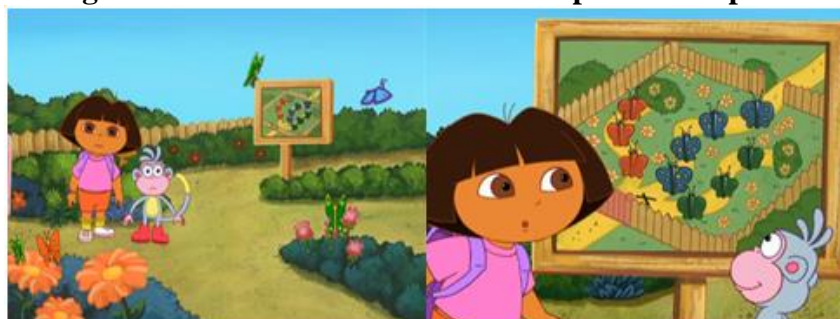
Figura 3 – Dora e Botas tentando compreender a placa.

Com o objetivo de chegar até a montanha altíssima, sem a ajuda do amigo Mapa, Dora e Botas precisaram procurar recursos que os auxiliem a encontrar o caminho correto, e eles se deparam com uma placa (Figura 3), a qual precisam compreender, pois nela se encontra um tipo de o mapa que explica como passar pelo Jardim das Borboletas para então chegar até o milharal.