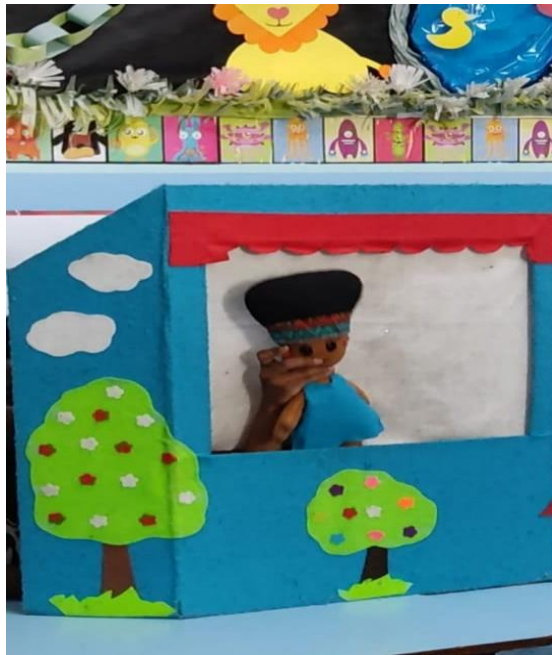
FIGURA 13. Dramatização: Renatinha, Pitico e o coelho

E, principalmente, a importância de gostarmos de nós mesmos.