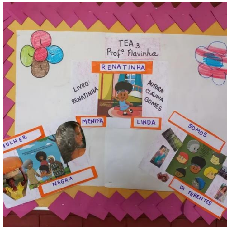
FIGURA 6. Renatinha na Educação Especial