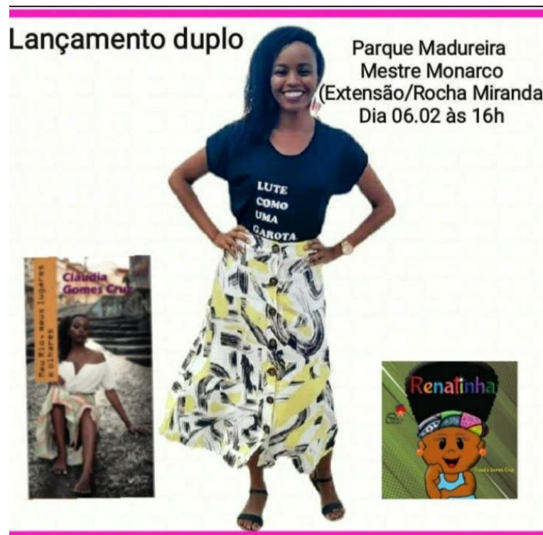
FIGURA 3. Divulgação dos lançamentos

Renatinha nasceu em novembro de 2021, assim como uma outra obra de poemas escrita por mim, e seu lançamento foi realizado no dia 06 de fevereiro de 2022 no Parque Madureira.