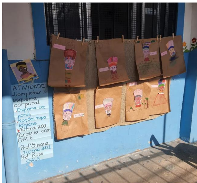
FIGURA 9. Renatinha, 2º ano e GALE aprendendo juntos

As atividades acima demonstram que é possível apresentar narrativas outras para nossos discentes e romper com uma hegemonia do conhecimento que, grosso modo, só nos interdita no caminho da humanidade.