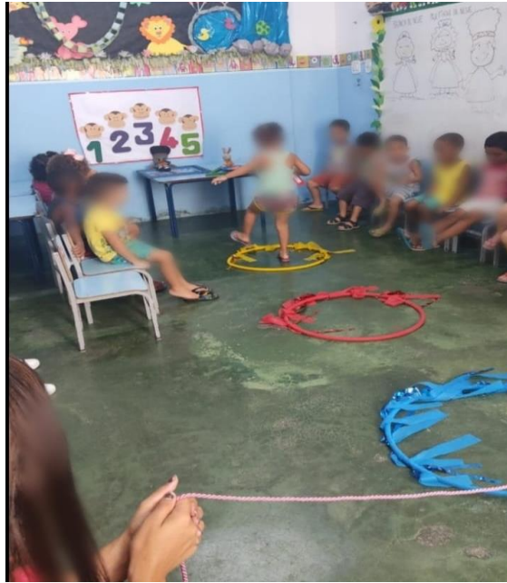
FIGURA 11. Renatinha e os alunos exercitando o corpo

Na prefeitura de Duque de Caxias os alunos da Educação Infantil realizam troca de roupa ao chegarem na unidade escolar. Os alunos chegam de uniforme e a troca de roupas é realizada, pois na saída após o asseio (banho) colocam novamente. Desta forma, eles entram e saem uniformizados. Feita a ressalva, que considero importante, continuemos: