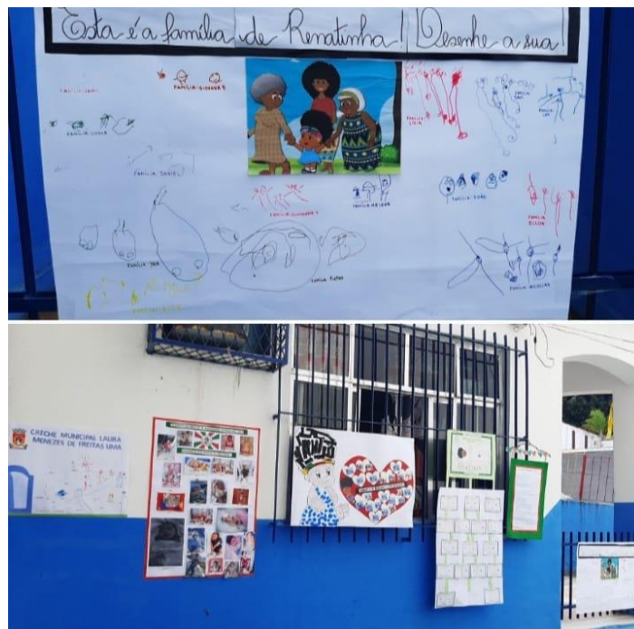
FIGURA 12. Renatinha e famílias