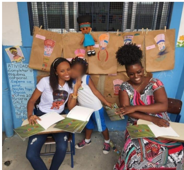
FIGURA 17. Renatinha para os alunos

A outra, de uma aluna branca, logo após a pergunta do colega: “Por que você não escreve uma história com uma menina branca?” Esta considerei importantíssima, pois me pareceu uma curiosidade real da menina. Com um vocabulário que no momento considerei adequado para faixa etária dela respondi que escrevo sobre personagens negros porque na nossa sociedade já existem muitos livros em que pessoas brancas aparecem. Então, priorizo escrever sobre personagens negros para que tenhamos mais representatividade.