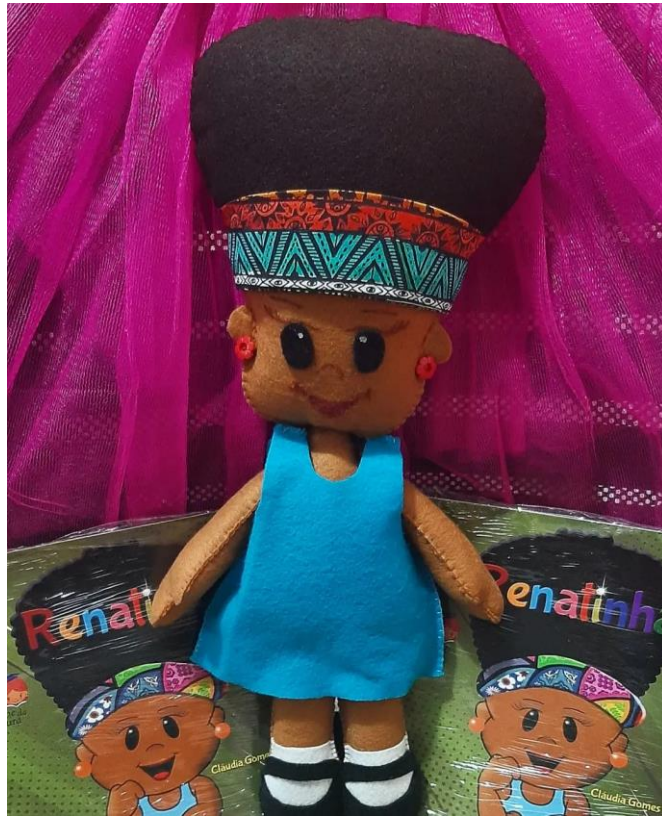
FIGURA 18. Renatinha é o poder!

Foram duas visitas realizadas até o momento e alguns convites para outras que acontecerão em breve, porém, o futuro de Renatinha com ou sem visitas é impactar crianças negras e não negras no intuito de mostrar a elas a importância de se respeitar corpos e saberes negros. Renatinha é uma possibilidade, assim como outros títulos também o são.