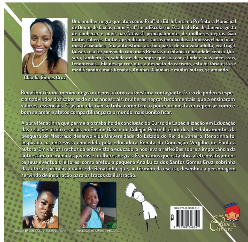
FIGURA 2. Renatinha - Quarta capa