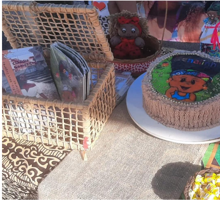
FIGURA 4. Lançamento

O livro que foi escrito durante a quarentena foi publicado pela Editora Clube da Cultura e lançado, presencialmente, numa tarde recheada de afetos e encantamentos. Convém sinalizar que as condições sanitárias já possibilitavam encontros em locais abertos devido à baixa no número de óbitos ocasionados pela Covid-19.