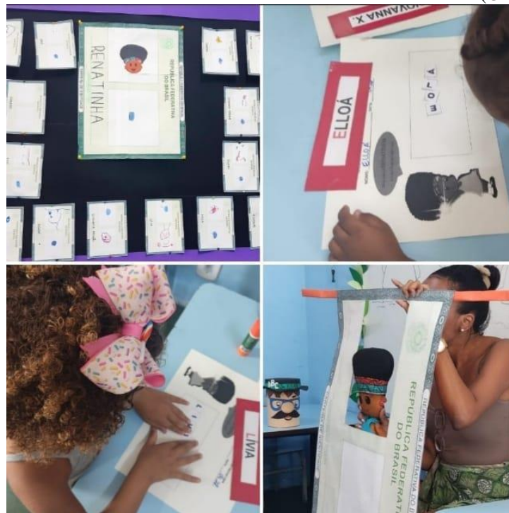
FIGURA 10. Renatinha e Identidade

Derrubar o "gigante" eu vou É lição de coragem e amor Eu sou "guerreiro do bem" vou caminhar A minha história vai te emocionar (GRANDE RIO, 2012)