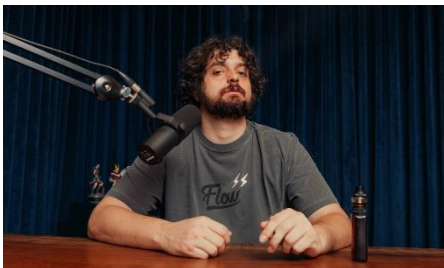
O influenciador digital e podcaster Monark

18/02/2022 - 08:22 / Atualizado em 18/02/2022 - 08:54