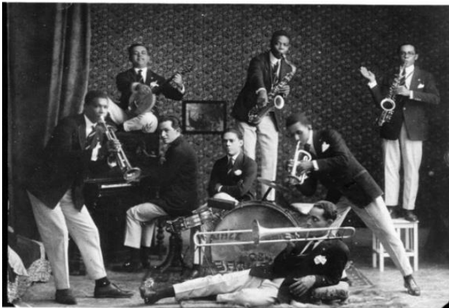
Os Oito Batutas | Reprodução

Com fevereiro, vem aí um oba-oba merecido e necessário para festejar a Semana de Arte Moderna de 1922, que completa os seus 100 anos.