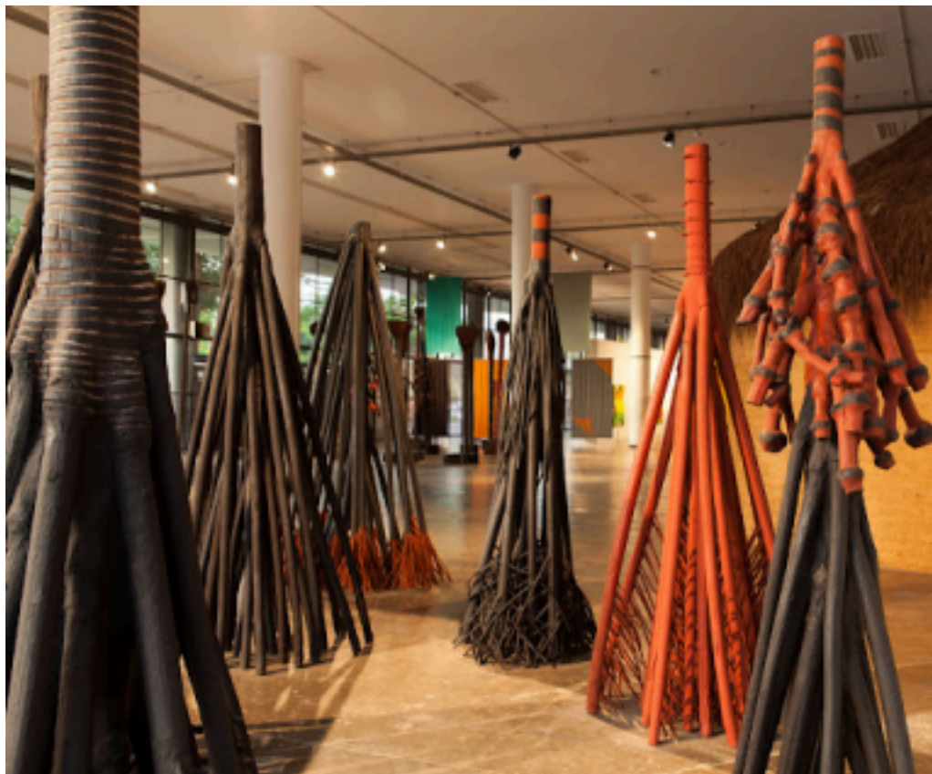
VISTA DA INSTALAÇÃO DE FRANS KRAJCBERG NA 32ª BIENAL DE SÃO PAULO, 2016