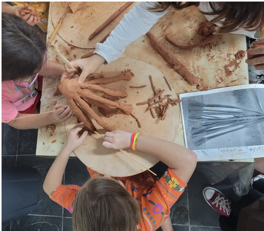
PROCESSO CRIATIVO DE RELEITURA EM ARGILA DA OBRA DE FRANS KRAJCBERG, 2024