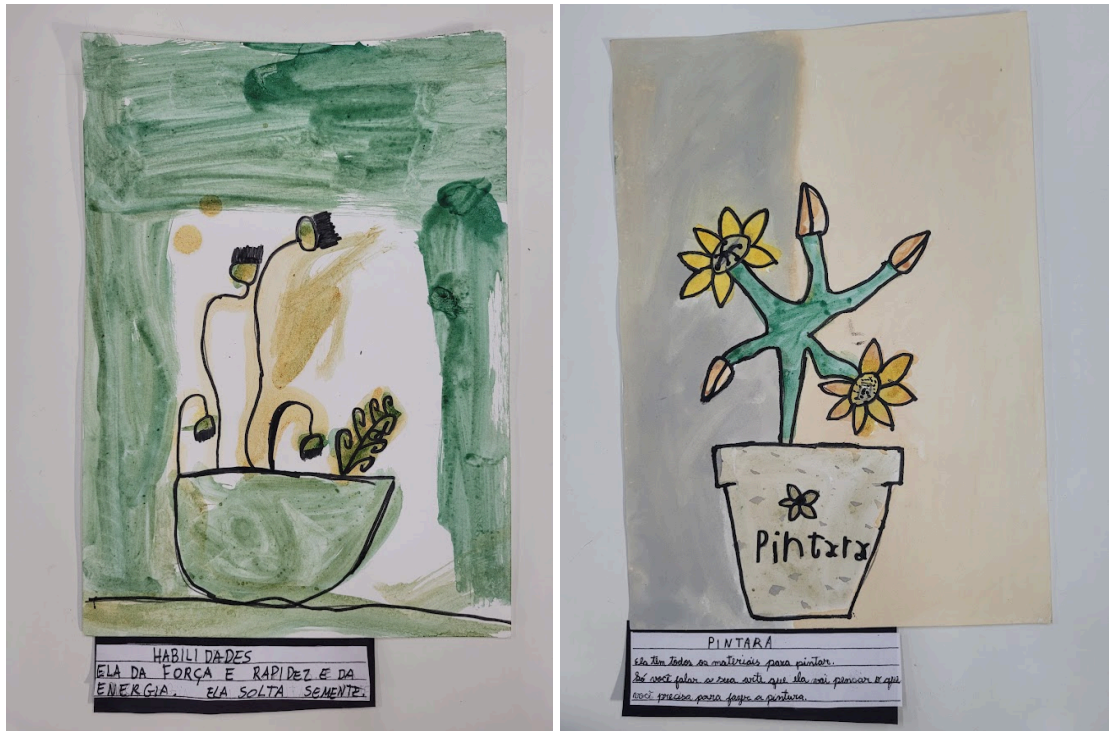
JARDIM ENCANTADO.

A potência da arte atrelada às diversas áreas do conhecimento é quase infinita. A partir dos dados analisados e dos estudos em sala de aula, foi observado que essa interdisciplinaridade é muito produtiva quando se trata de reconexão com o eu interior e com a natureza que nos cerca. Unindo imagens como, por exemplo, as de nossas digitais com as de troncos de árvores, conseguimos a atenção dos alunos para as semelhanças entre nós e nosso entorno. A proximidade com a terra ajuda a elaborar internamente que além de produzir grande parte do que comemos, também dela nasce uma vasta gama de cores que podemos transformar em tinta, em giz, além de podermos com a terra modelar objetos e esculturas. Aliás, o contato com o barro, além de desenvolver a percepção, a imaginação e a criatividade, aguça os sentidos, ajudando a conectar mente e corpo. Ver uma floresta de plástico causa tamanho estranhamento que gera reflexão em relação às embalagens plásticas. As experiências vividas no ateliê poderiam ser citadas por muito tempo, tendo em vista as inúmeras possibilidades de abordar as conexões humanas através das linguagens da arte. Apresentar às crianças, o quanto antes, o que quer que seja que possa servir como ponto de partida para diálogos a respeito da nossa natureza e nossa relação com o planeta em que vivemos. Existe inspiração maior do que o mundo natural?