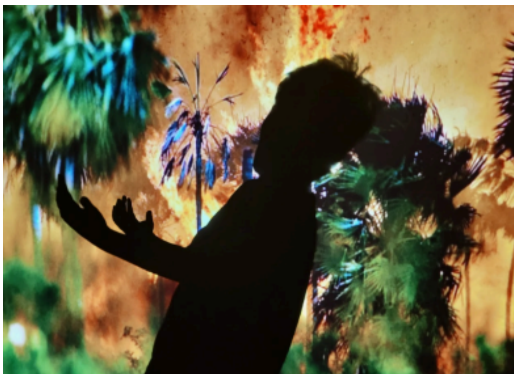
Figura 1: Floresta em chamas

"A arte é contemplação. É o prazer do espírito que penetra a natureza e descobre que a natureza também tem alma." Esta frase atribuída a Auguste Rodin pareceu nortear meu trabalho desenvolvido no último ano. Perceber a arte como uma forma de descobrir a essência da natureza e da vida é fundamental se quisermos explorar a profundidade do mundo. Ao projetar imagens do fotógrafo Araquém Alcântara, as reações das crianças em sala de aula diante do fogo trouxeram a certeza de que ainda não estamos totalmente anestesiados. As fotos dos incêndios florestais provocaram as sensações esperadas: desamparo, desespero, vulnerabilidade, impotência. Se alguns meses antes, na mesma turma, houve enorme espanto ao trazer a ideia de que somos todos animais, vê-las sendo tocadas de corpo e alma pela arte e pela natureza foi um grande avanço. A partir de um exercício com luz e sombra, pedi que esboçassem as reações sentidas com as imagens através do corpo e cliquei os resultados.