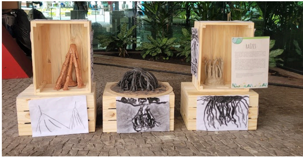
RELEITURAS EM ARGILA E EM CARVÃO DA OBRA DE FRANS KRAJCBERG, 2024