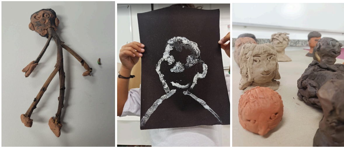
EXEMPLOS DE AUTORRETRATOS UTILIZANDO MATERIAIS NATURAIS, COMO SAL, BARRO E GRAVETOS.