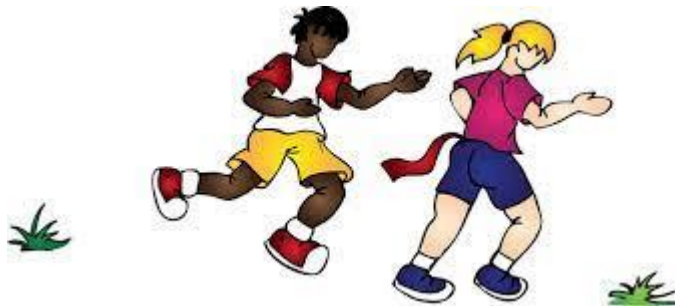
FIGURA 6-Pega Rabo

• Retirar tiras de jornais ou de panos presas nas roupas (Pega rabo): Cada aluno(a) deve ter uma tira de jornal ou de pano presa na calça. Ao sinal do(a) professor(a) os(as) discentes devem tentar pegar as tiras dos(as) colegas.