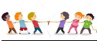
FIGURA 1-Cabo de Guerra

• Cabo de Guerra: A atividade, também chamada de jogo da corda, é uma atividade esportiva onde duas equipes competem entre si para ver qual delas possui a maior força puxando um cabo. Iniciada a disputa, vence o time que conseguir puxar o grupo adversário para depois da linha central.