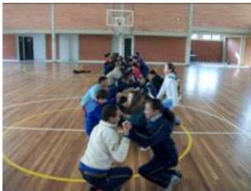
FIGURA 2-Briga de Galo

• Briga de Galo: A atividade é realizada com os alunos e alunas agachados, de cócoras, e a marcação do ponto é feita quando alguém consegue desequilibrar o/a oponente fazendo-o/a encostar as mãos, joelho, glúteo ou costas no chão. Não é permitido agarrar ou puxar o/a colega.