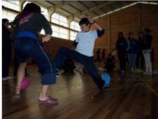
FIGURA 5-Estourar balões

• Estourar balões amarrados nos tornozelos dos colegas: Cada aluno(a) deve ter uma bexiga amarrada por barbante no tornozelo. Ao sinal do(a) professor(a), os(as) discentes devem pisar para estourar a bexiga dos(as) colegas, sem deixar que pisem na sua.