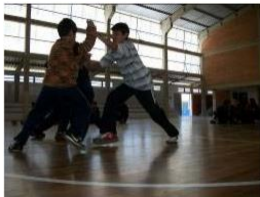
FIGURA 4-Sumô Adaptado

• Sumô adaptado: Divididos em duplas, teriam que empurrar os/as colegas para fora da delimitação no tatame.