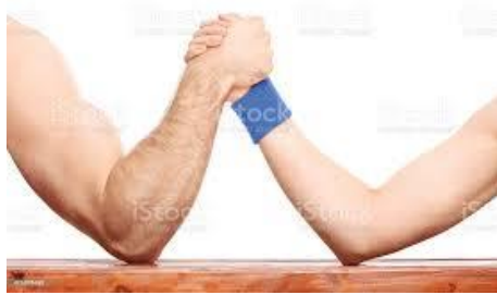
FIGURA 3-Queda de Braço

• Queda de braço: Jogo em que dois adversários, colocados frente a frente, mantendo os cotovelos apoiados em uma superfície fixa e os braços fletidos e segurando a mão um do outro, realizam força para que um deles perca o desafio ao bater com o dorso da mão na superfície de apoio.