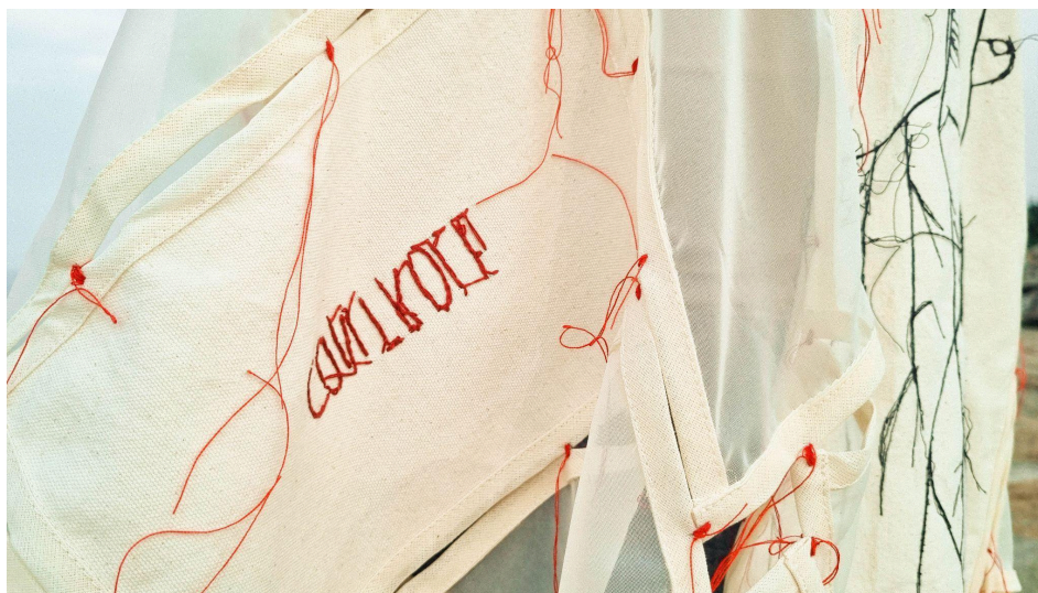
Figura 8 - Detalhe da obra O que sabem as mãos