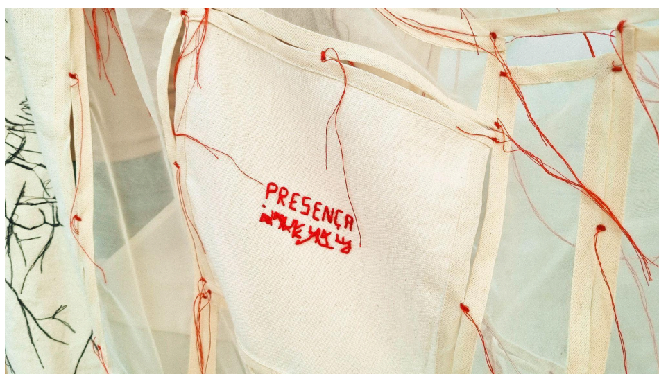
Figura 7 - Detalhe da obra O que sabem as mãos

Como seria possível haver uma aula de artes em que sujeitos não estivessem presentes? Como haver um ambiente de aprendizagem sem afeto? Como um discurso morto poderia alguém acordar? “A um discurso que não é uma expressão de amor falta o poder mágico de acordar os que dormem, falta o poder mágico para criar.” (Alves, 1986, p. 24). Traria a mim imensa alegria poder dizer que se vestir de um discurso que é uma “expressão de amor” é um caminho tranquilo e prazeroso. Mas esse é o ponto, não é um discurso que se pode vestir, é um discurso que parte do que se é, e se colocar exposto dessa forma diante de outros é deixar que a descontinuidade, a trama aberta, sejam vistas.