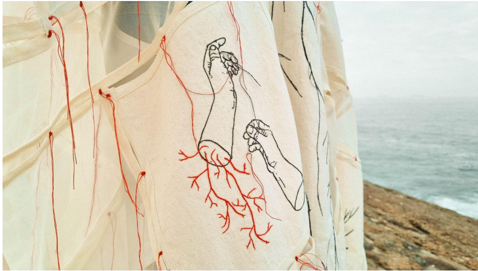
Figura 2 - Detalhe da obra O que sabem as mãos