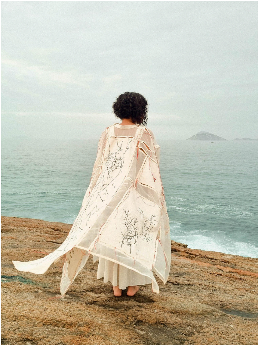
Figura 9 - Obra O que sabem as mãos