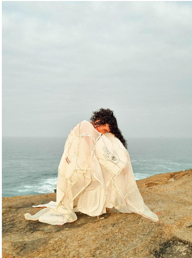
Figura 6 - Obra O que sabem as mãos