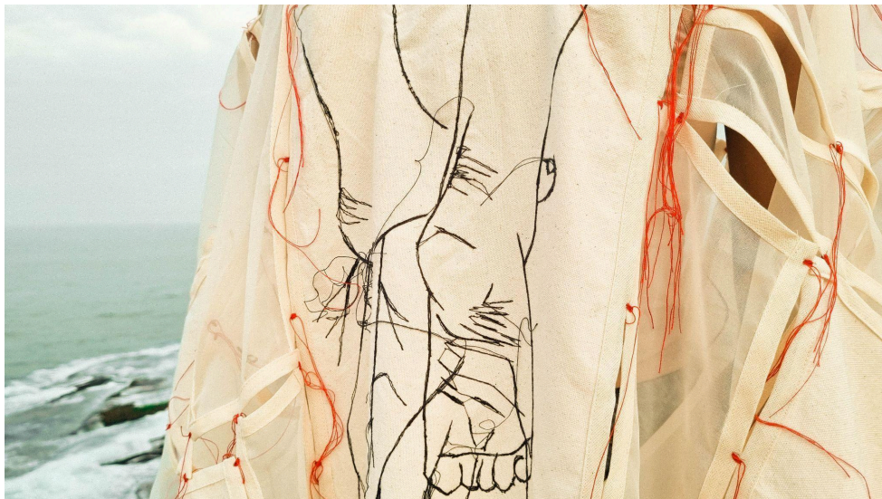
Figura 1 - Detalhe da obra O que sabem as mãos

como prosseguir, como transpor o desenho para o tecido? Só tinha meu lápis e canetas comuns... Eles não me ofereciam a permanência que eu buscava, então me veio à memória o potinho com linhas e agulhas para remendar pequenos rasgos que tínhamos em casa. E se eu desenhasse com linhas e agulha? "Uma descobridora", pensei acerca de mim mesma, inventora de caminhos; sem saber que na verdade nada havia descoberto. Aquele desenhar com linhas e agulhas, também conhecido como bordado, é que havia me achado. Aquele que um dia foi um jaleco branco se tornou registro do processo de me entender como alguém capaz de materializar ideias. Um nó invisível a "desatar" meu processo criativo. Não só abriu caminhos, mas se tornou o próprio caminho a ser trilhado por meu desejo de criar.