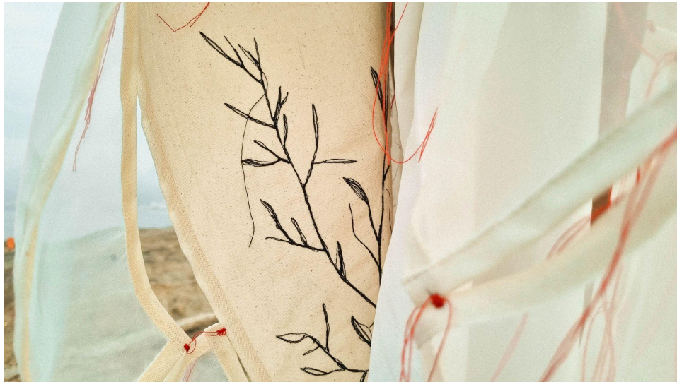
Figura 10 - Detalhe da obra O que sabem as mãos