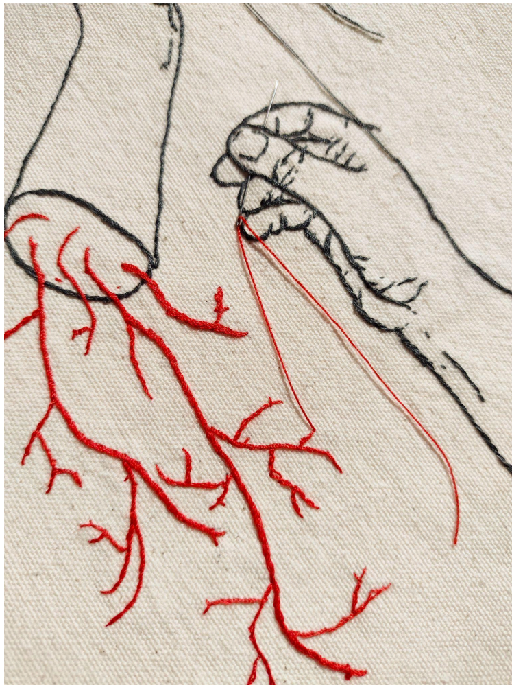
Figura 3 - Detalhe da obra O que sabem as mãos

O que a princípio parecia uma desconexão a uma história de afeto, no ato de entrelaçar a linha às tramas do tecido dou continuidade a algo que não começou em mim, mas que me atravessou. Algo passado por mulheres de geração em geração chega a mim, não pelo caminho óbvio, mas através da rede e se fez teia, que não segue um caminho linear. Eu, feito aranha vou tecendo conexões, nós que se interligam em processo de expansão.