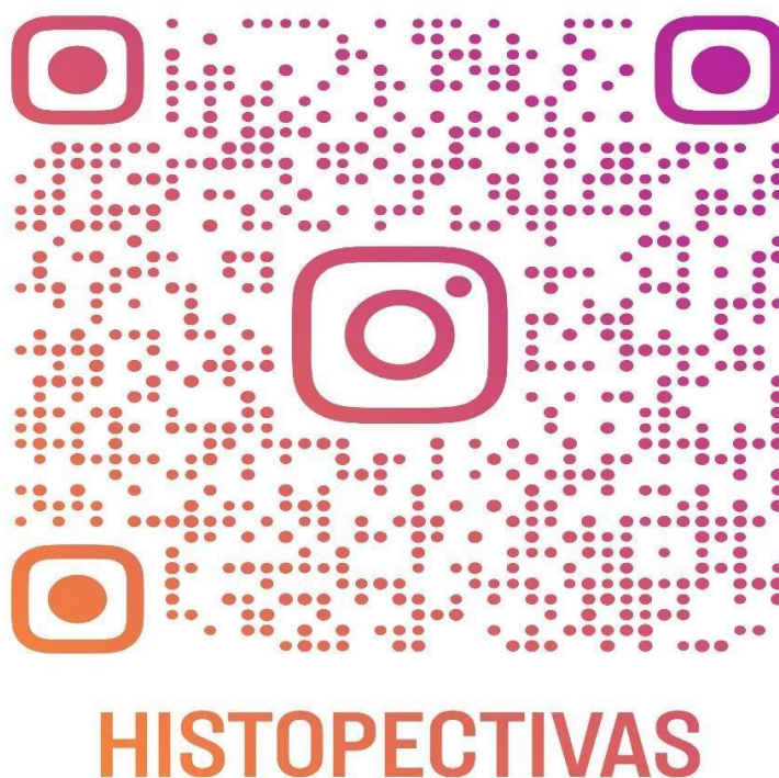
Imagem 1: QRcode da página Histopectivas no Instagram para acesso aos vídeos descritos nesse trabalho.

A página “Histopectivas” pode ser acessada através desse QRCode, assim como os vídeos do projeto “Histo é Samba” e as demais propostas da página.