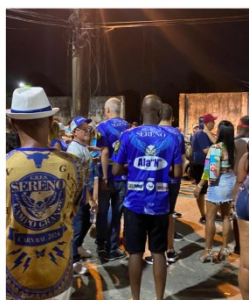
ENSAIO TÉCNICO DE RUA - 26/11/2023