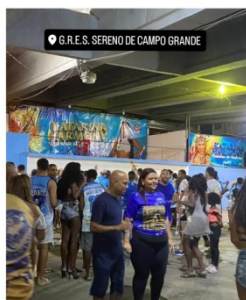
PÓS ENSAIO NA QUADRA - 26/11/2023