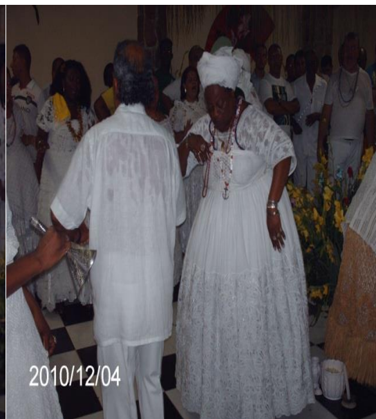
Fotografia 2 – Yalorisá em transe