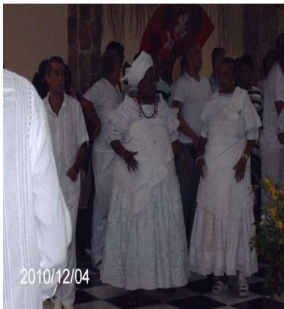
Fotografia 1 – Roda de Sàngó