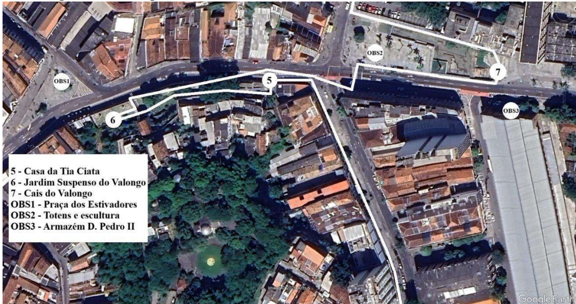
Mapa da região do Valongo.