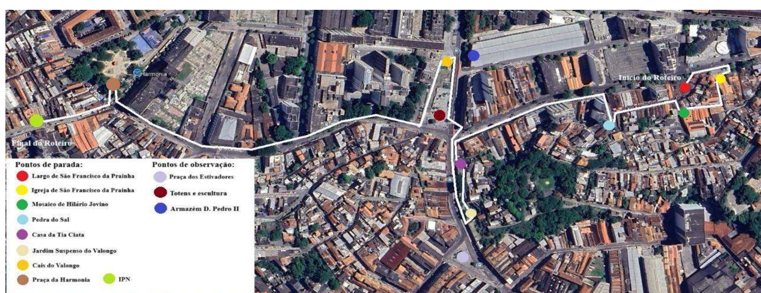
Mapa geral do roteiro na Pequena África.

Após dialogarmos a respeito das motivações bibliográficas, limitações pedagógicas, exercício da memória, experiências prévias, metodologia de linguagem, e a organização do roteiro com a escola e responsáveis, seguiremos a partir de agora o processo de construção de um roteiro de aula de campo na região conhecida como Pequena África. Ao longo do desenvolvimento deste roteiro daremos ênfase aos temas que serão abordados em cada um dos locais de parada, sendo que, tomaremos como base para a realização dos diálogos os roteiros que realizei junto aos guias organizados pelo IPN, uma vez que estes têm-se mostrados muito completos quanto aos aspectos factuais. Mas junto a isto, no entanto, outras informações serão agregadas através de perguntas, provocações e paralelos capazes de recuperar aspectos históricos e culturais da Pequena África para a realidade dos alunos cuja escola situa-se no bairro de Lins de Vasconcelos, na Zona Norte do Rio. Por fim, o roteiro como um todo está dividido em três áreas principais: Morro da Conceição, Valongo e Instituto dos Pretos Novos, conforme se pode verificar nos mapas a seguir, nos quais destacamos o caminho a ser percorrido ao longo do roteiro. Lembrando que o roteiro deverá se iniciar por volta das 9 horas de manhã.