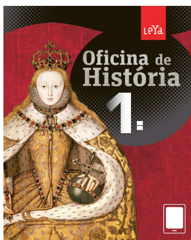
Figura 1 – Capa do livro didático