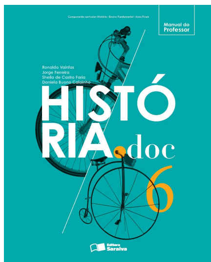
Figura 4 – Sumário do livro didático