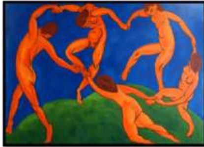
Figura 15: Quadro “A Dança” (Henri Matisse)