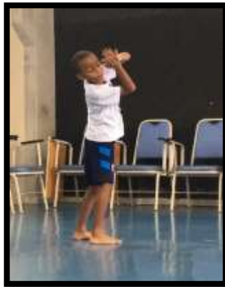
Figura 16: Sequência de improvisação

“A Dança do homem das cavernas” surgiu como forma de abordar a dimensão histórico-cultural da Dança, buscando a sua compreensão enquanto manifestação cultural inerente a natureza humana, na qual o próprio corpo é a linguagem. Portanto, com este tema, pretende-se que a criança possa compreender que, desde a Pré-História, quando possuía uma relação de integração com a Natureza, o Homem se expressa e se comunica pela linguagem corporal.