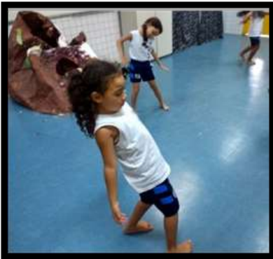
Figura 11: Percebendo o limite entre o equilíbrio