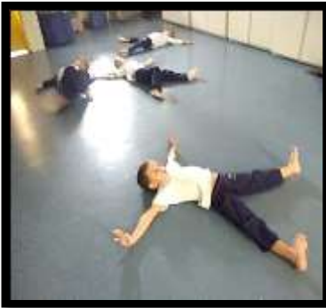
Figura 1: expansão do corpo