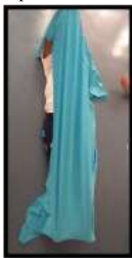
Figura 3: Expansão e recolhimento do corpo com o tecido