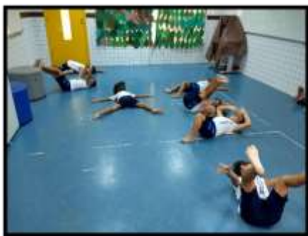
Figura 21: Experienciando a plasticidade