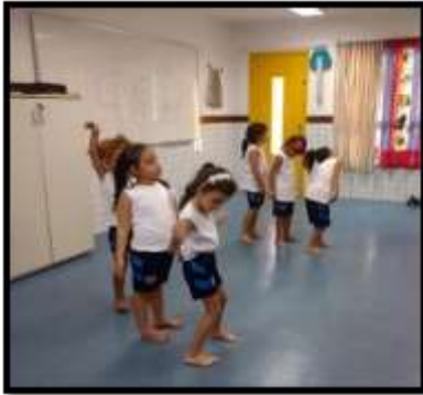
Figura 19: Jogo das sombras