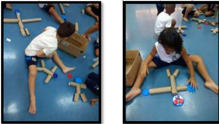
Figuras 4 e 5: Montando o quebra-cabeças do corpo

Buscando-se estratégias lúdicas para a abordagem do esquema corporal, utilizou-se materiais reciclados como objetos lúdicos com o objetivo de que as crianças pudessem construir coletivamente uma representação do corpo e suas partes (localização, tamanho, características) mas sem perder de vista que, conforme afirma Merleau-Ponty, “não reúno as partes do meu corpo uma a uma; essa tradução e essa reunião estão feitas de uma vez por todas em mim: elas são meu corpo próprio” (MERLEAU-PONTY, 1994, p. 207), ou seja, que o corpo não é um mero conjunto de partes articuladas.