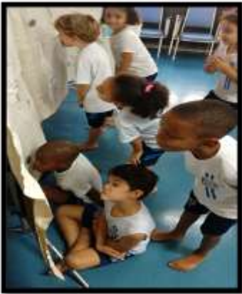
Figura 8: Espelando o corpo