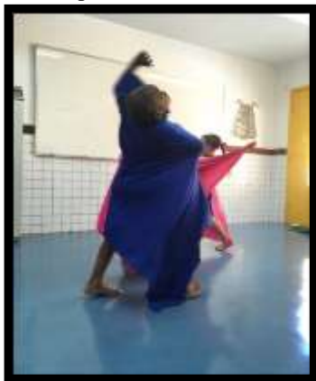
Figura 13: Objeto como extensão do corpo