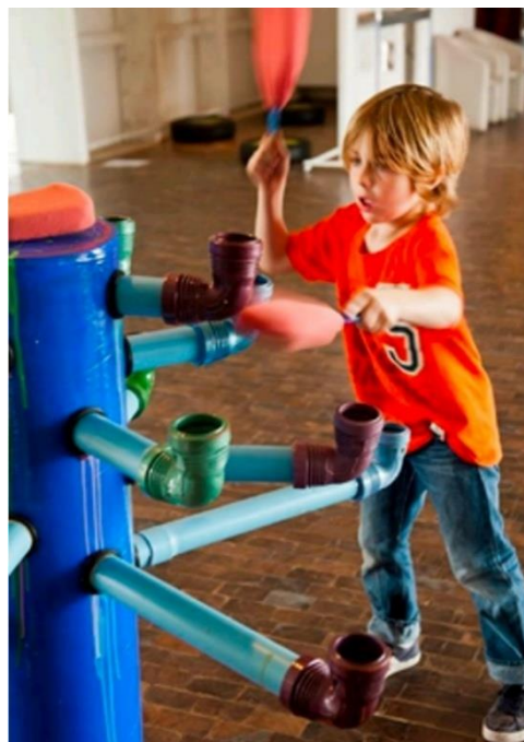
Figura 3 – Escultura de VIBRA: Estaciones Sonoras

Uma excelente possibilidade pedagógica é a exploração de parques sonoros. E, nesse sentido, Lino nos apresenta a proposta VIBRA: Estaciones Sonoras (Calvo, 2018), do pesquisador argentino Julio Calvo, defensor da ideia de que “todos, como ouvintes, como executantes, somos músicos” (Calvo, 2021, p. 1).