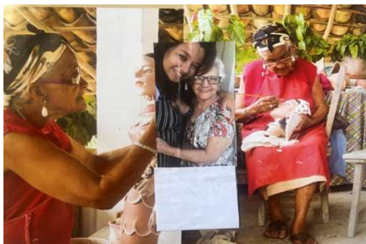
Figura 8- Colagem: Toda avó tem sua receita.

A ideia era juntar essas duas avós em uma imagem só, sendo a receita um resultado desse trabalho manual e eu que perpetuarei seus ensinamentos.