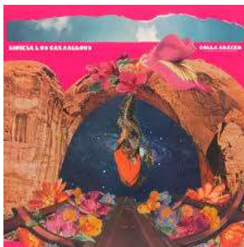
Figura 3: Álbum, Goela abaixo, Liniker e os Caramelows. Artista: Domitila de Paulo