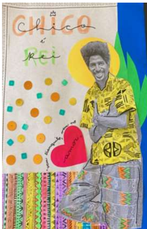
Figura 2 - Colagem com imagem de Chico Chocalho

O sentimento sobre esse dia é tão forte na minha memória, que, sinto a vibração das pessoas cantando de forma alegre e emocionadas por entregar um carnaval tão bonito, realizando o sonho e potencializando os do Chico. Acompanha-lo pós carnaval, no dia a dia, me fez entender o potencial da sua figura, para as novas gerações, impulsionando a arte e dando visibilidade a nossa raiz, estimulando novos Chicos, Rapha, e tantas outras personalidades que contribuem para nossa cultura. Ambos são exemplos de pessoas-artistas contemporâneos afrofuturistas, que enxergam novos horizontes, mudam suas realidades e constroem novos futuros.