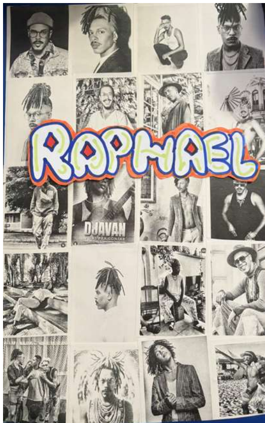
Figura 1 - Colagem com várias imagens do Rapha