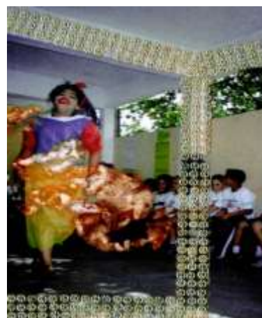
Figura 6 : Encantada, 2020, M Dias Preto.