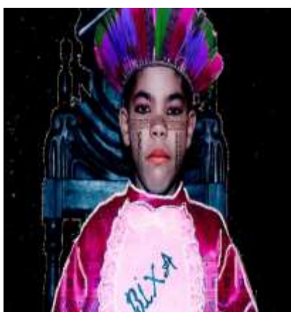
Figura 5: Formatura em Biparia, 2020 M. Dias Preto

também reforça que, ao intervir nas fotografias, é possível intervir em sua própria vida. Expondo seus processos de cura, também encoraja outros corpos dissidentes a buscarem se reconhecerem em suas próprias histórias. “O apagamento histórico sobre corpos afro, indígenas e LGBTQIA+ reverbera até os dias atuais através do pouco acesso a imagens fotográficas das suas ancestrais. Isso implica na falta de reconhecimento e representação imagética das dessas origens, deixando em branco o espaço que é tomado pela cultura da LGBTQfobia e do racismo. E é justamente esse espaço que queremos ocupar”.