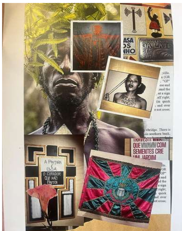
Figura 6 - Colagem sobre Brasis : Brasil é preto

Por isso, a criação da imagem a seguir (Fig. 6), que eu chamo de “O Brasil é preto”. Por mais resistente que ainda seja a aceitação de que somos formados mais pela cultura negra e indígena do que europeia, é importante ressaltar como essas imagens, artistas, figuras populares, o samba e a religião fazem parte de nós. Então, escolhi as imagens que prenderam minha atenção e me fizeram querer reunir tudo que eu tento validar em sala para que haja um novo olhar e reflexão do papel da arte, como nas obras de artistas trans, com questionamento “se a arte fosse travesti” da artista Rosa Luz.