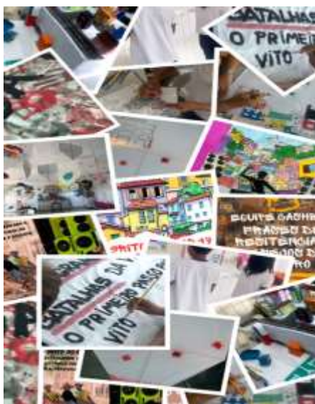
Figura 8- Colagem com trabalhos dos alunos

A colagem mostrada na figura 8 é um compilado desses trabalhos realizados pelos alunos, com objetivo de apreciá-los como artistas e produtores que foram, e uma realização pessoal de conseguir proporcionar essa experiência a eles.