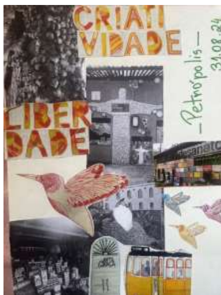
Figura 7- Colagem sobre o museu do Artesanato

A grande maioria dos alunos também não podem comprar. Diante da realidade atual da escola pública, o material “descartável” pode e deve ser explorado, saindo da condição de lixo, podendo entregar um trabalho minucioso, delicado e grandioso, sendo uma ótima solução, como referências para serem tratadas e trabalhadas em sala de aula.