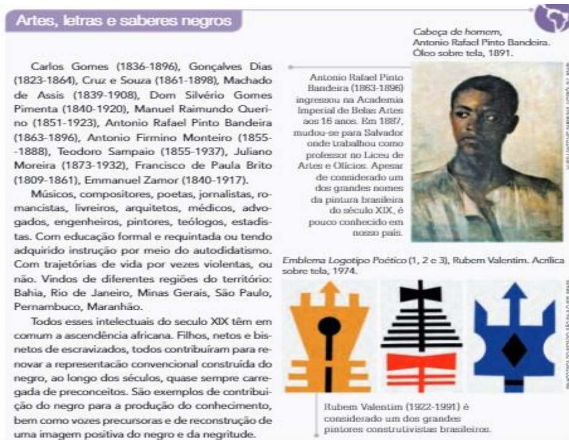
Figura 8 – Artes, letras e saberes negros

Fonte: CAMPOS, Flávio de; CLARO, Regina; DOLHNIKOFF, Miriam. Segundo Reinado e Proclamação da República. In: História: escola e democracia . 8º ano. 1 ed. São Paulo: Moderna, 2018. p. 244.