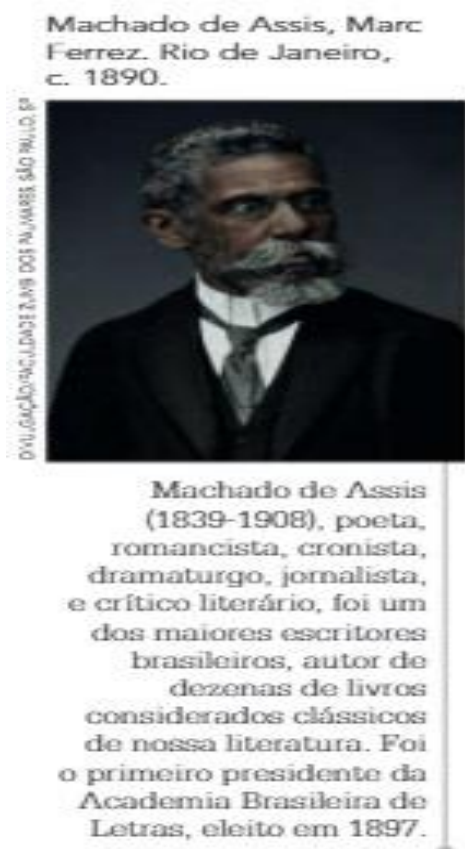
Figura 9 – Machado de Assis, c. 1890p. 238. Figura 10 – Conceição Evaristo p. 243