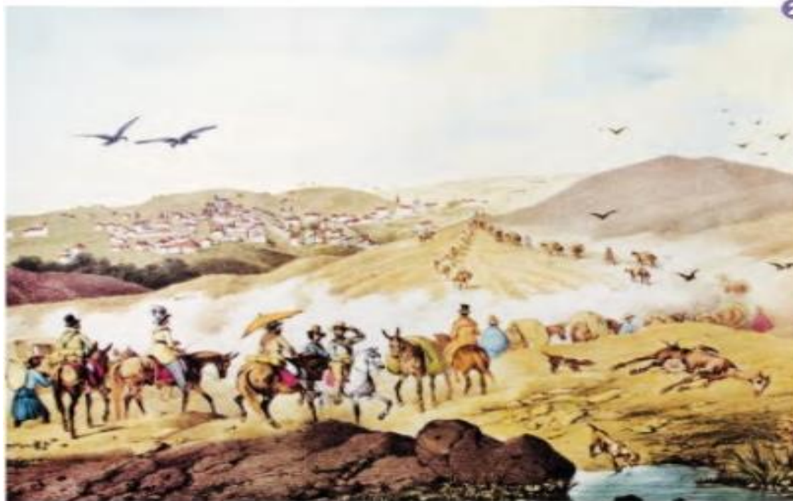
Caravana de comércio, Johann Moritz Rugendas. Litografia colorida, c. 1835.