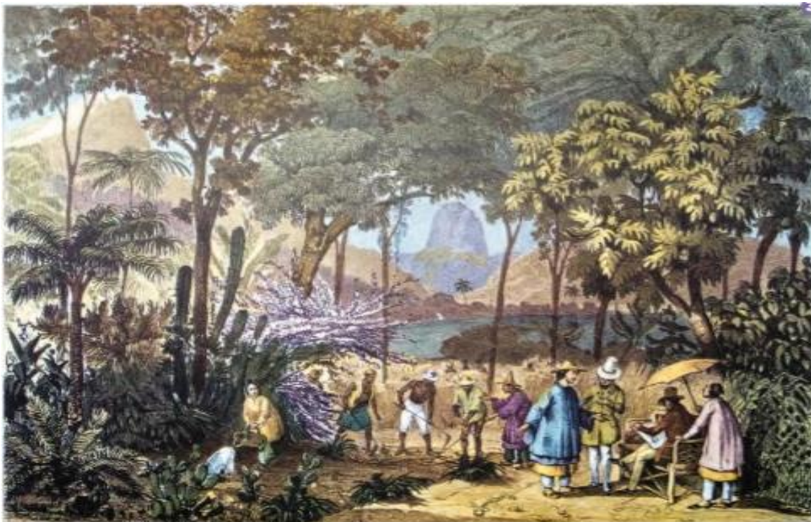
Plantação chinesa de chá no Jardim Botânico do Rio de Janeiro, Johann Moritz Rugendas. Litografia colorida, c. 1835.