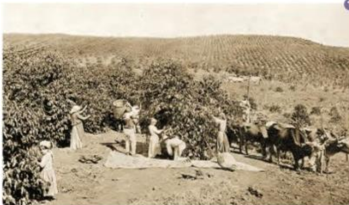
Imigrantes europeus em colheita de café. Araraquara, c. 1900.

Fonte: CAMPOS, Flávio de; CLARO, Regina; DOLHNIKOFF, Miriam. Segundo Reinado e Proclamação da República. In: História : escola e democracia. 8ºano. 1 ed. São Paulo: Moderna, 2018. p. 234.