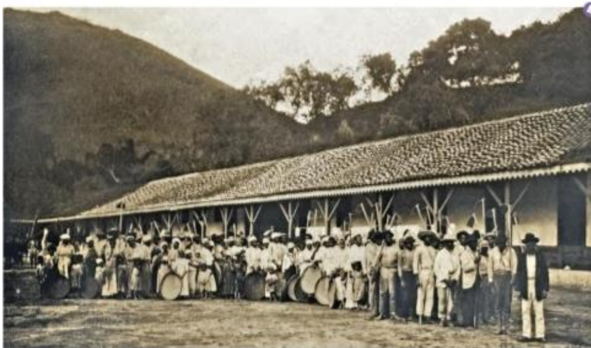
Partida para a colheita do café, Marc Ferrez. 1885.