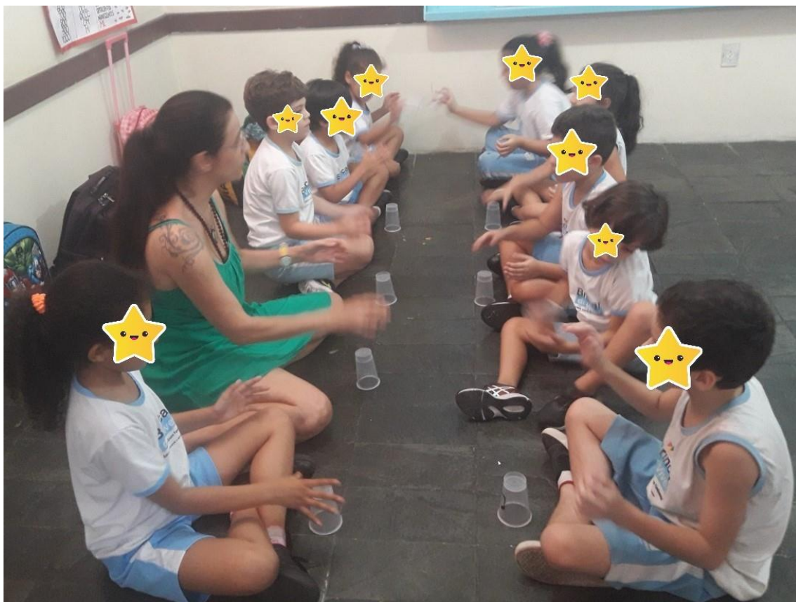
Figura 2- Jogos de mãos e copos