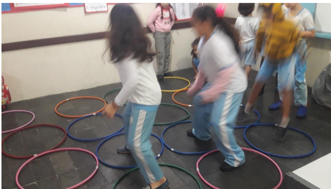
Figura 4 – Amarelinha Africana