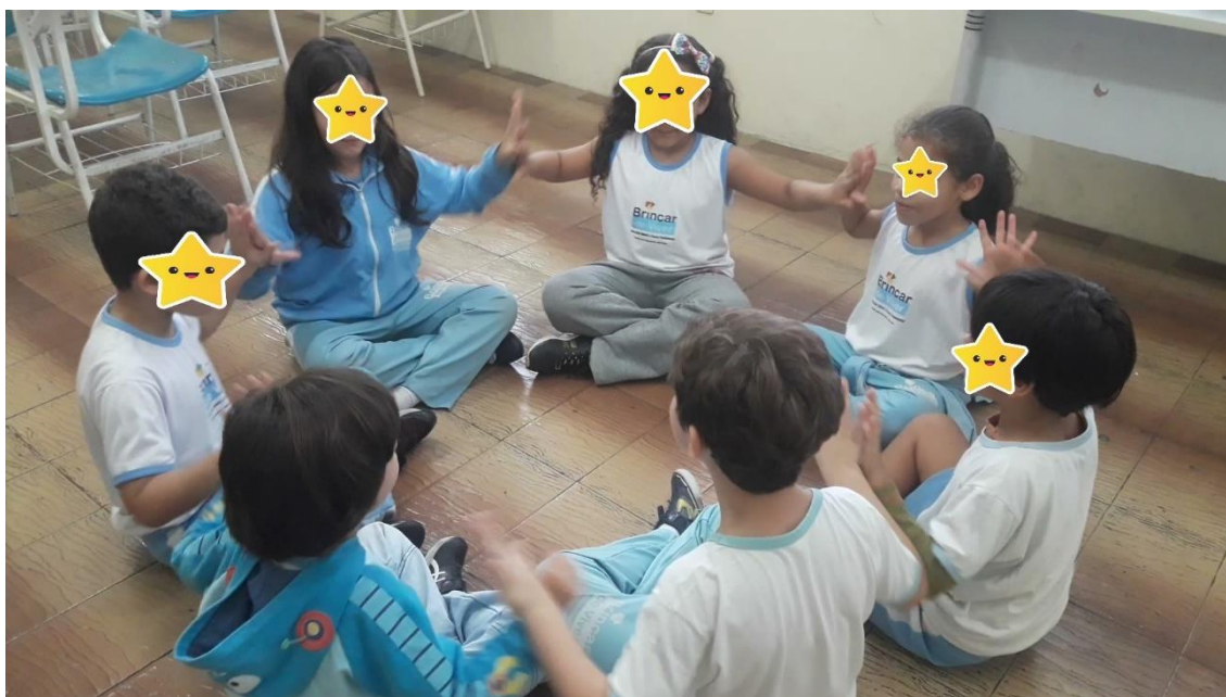
Figura 5 – Atividade Chocolate

-socioemocionais: cooperação, autoconfiança, criatividade, motivação.